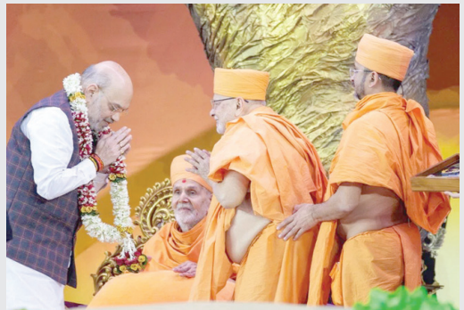
કાર્યકરમાં સંગીત, પારંપરિક નૃત્ય સાથે લેજર લાઇટીંગે લોકોને મંત્રમુગ્ધ કરી દીધા. સુવર્ણ કાર્યકર મહોત્સવનું દિપ પ્રાગટ્ય કરવામાં આવ્યું હતું. આ દરમિયાન મહંત સ્વામી, ગૃહમંત્રી અમિત શાહ અને મુખ્યમંત્રી ભુપેન્દ્ર પટેલ મંચ પર પહોંચ્યા હતા. જેમાં કેન્દ્રીય ગૃહ મંત્રી અમિત શાહ અને મુખ્યમંત્રી ભુપેન્દ્ર પટેલનું પુષ્પ માળા પહેરાવી સ્વાગત કરવામાં આવ્યું.

। (એજન્સી) અમદાવાદ, તા.૮ । અમદાવાદના નરેન્દ્ર મોદી સ્ટેડિયમમાં આજે BAPS સ્વામિનારાયણ સંસ્થા દ્વારા 'કાર્યકર સુવર્ણ મહોત્સવ' યોજવામાં આવ્યો છે. ત્યારે આ મહોત્સવમાં ગુજરાત, સહિત અન્ય રાજ્યો અને વિદેશથી ૧ લાખથી વધુ કાર્યકરો અમદાવાદના સ્ટેડિયમમાં હાજર રહ્યા છે. ત્યારે મહંત સ્વામી મહારાજ સૌ કાર્યકરોને આશીર્વાદ આપવા માટે સ્ટેડિયમમાં પધાર્યા હતા. સ્ટેડિયમમાં સંગીત અને નૃત્યના વિવિધ કાર્યકરો કાર્યકર સુવર્ણ મહોત્સવની ભવ્ય ઉજવણી કરવામાં આવી હતી.