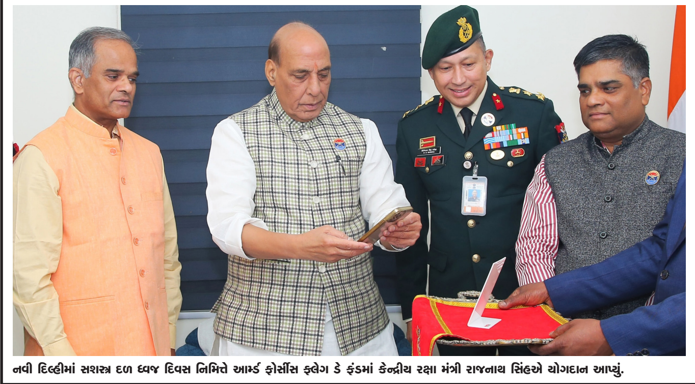
નવી દિલ્હીમાં સશસ્ત્ર દળ ધ્વજ દિવસ નિમિત્તે આર્મ્ડ ફોર્સિસ ફ્લેગ ડે ફેડમાં કેન્દ્રીય રક્ષા મંત્રી રાજનાથ સિંહએ યોગદાન આપ્યું.

નવી સરકારે શપથ લીધા હતા. ૫ નવેમ્બર, ૨૦૨૪ ના રોજ, ટ્રિબ્યુનલે આપકવેરા વિભાગ દ્વારા દાખલ કરવામાં આવેલી અપીલને ફગાવીને તેના સ્ટેન-ની પુષ્ટિ કરી, જેથી તેના અગાઉના નિર્ણયને સમર્થન આપ્યું. આ નિર્ણય સાથે, આપકવેરા સત્તાવાળાઓ દ્વારા અગાઉ જપ્ત કરવામાં આવેલી મિલકતોને મુક્ત કરવામાં આવી છે. ઓક્ટોબર, ૨૦૨૧ માં અધિકારીઓએ બેનામી પ્રોપર્ટી ડિવેન્શન એક્ટ (PBPP) હેઠળ ૧,૦૦૦ કરોડ રૂપિયાથી વધુના મૂલ્યની સંપત્તિઓ જપ્ત કરી હતી. આ કાર્યવાહીમાં મહારાષ્ટ્ર અને મુંબઈમાં અજિત પવાર સાથે જોડાયેલા લોકોના આવાસો અને કાર્યાલયોમાં સર્ચ કરવામાં આવ્યું હતું, જેમાં તેના સંબંધીઓ, બહેન અને નજીકના સહયોગી સામેલ હતા.