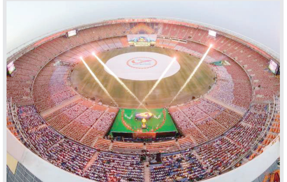
BAPS કાર્યકર સુવર્ણ મહોત્સવ : નરેન્દ્ર મોદી સ્ટેડિયમમાં અદભુત શો

શાસ્ત્રીજી મહારાજ અને ત્યારબાદ બ્રહ્મસ્વરૂપ યોગીજી મહારાજે આ કાર્યકર પ્રવૃત્તિના બીજા રોપ્યા અને કમશ: તેઓ અંકુરિત થયા. સુવર્ણ કાર્યકર મહોત્સવનું દિપપ્રાગટ્ય કરવામાં આવ્યું હતું. આ દરમિયાન મહંત સ્વામી, ગૃહમંત્રી અમિત શાહ અને મુખ્યમંત્રી ભુપેન્દ્ર પટેલ મંચ પર પહોંચ્યા હતા. જેમાં કેન્દ્રીય ગૃહ મંત્રી અમિત શાહ અને મુખ્યમંત્રી ભુપેન્દ્ર પટેલનું પુષ્પ માળા પહેરાવી સ્વાગત કરવામાં આવ્યું.