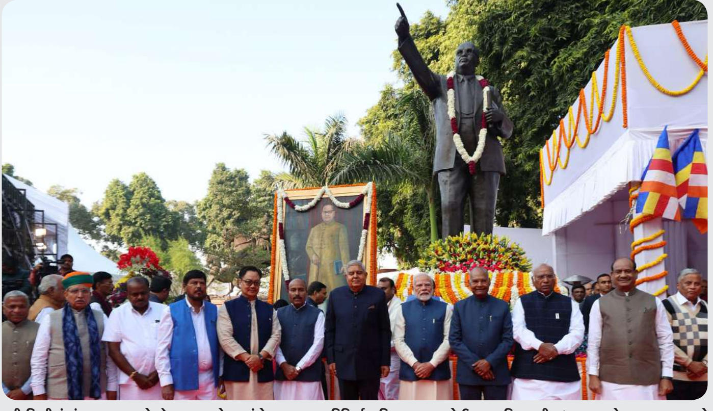
નવી દિલ્હીમાં સંસદ ભવન ખાતે ડો. બાબાસાહેબ આંબેડકરના મહાપરિનિવાળ દિવસના અવસરે ઉપરાષ્ટ્રપતિ જગદીપ ધનખર અને અન્ય મહાનુભાવો સાથે વડાપ્રધાન નરેન્દ્ર મોદી પણ હાજર રહ્યા હતા.

। (એજન્સી) નવી દિલ્હી, તા.૬ । ઉત્તર પ્રદેશના પીલીબીતમાં એક ભયાનક રોડ અકસ્માત સર્જાયો છે. એક સ્પીડમાં આવતી કારે કાબુ ગુમાવ્યો અને ઝાડ સાથે અથડાઈને ખીણમાં ખાબકી હતી. આ કારમાં ૧૧ લોકો સવાર હતા. જેમાંથી ૬ના મોત થયા છે અને ૫ લોકો ગંભીર રીતે ઈજાગ્રસ્ત થયા છે. અકસ્માત બાદ ઈજાગ્રસ્તોને સારવાર માટે હોસ્પિટલમાં ખસેડવામાં આવ્યા હતા. અહેવાલો અનુસાર, કારમાં સવાર લોકો લગ્ન સમારોહમાંથી પરત ફરી રહ્યા હતા. કારમાં સવાર તમામ ઉત્તરાખંડના રહેવાસી હતા. અકસ્માતની માહિતી મળતાં પીલીબીતના ન્યુરિયા પોલીસ સ્ટેશનની પોલીસ ઘટનાસ્થળે પહોંચી હતી અને સ્થાનિક લોકોની મદદથી કારને ખાડામાંથી બહાર કાઢી હતી. આ દરમિયાન જેસીબીની પણ મદદ લેવી પડી હતી. ગુરુવારે (પાંચમી ડિસેમ્બર) રાત્રે કુલ સ્પીડ કાર ટનકપુર હાઈવે પર અચાનક એક ઝાડ સાથે અથડાઈ અને ખીણમાં પડી અને પલટી ગઈ.