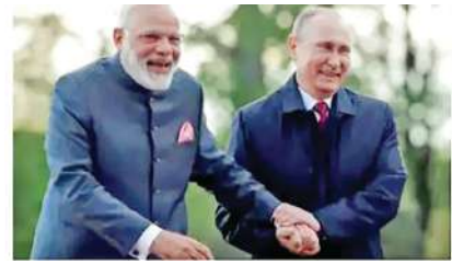
નેતૃત્વમાં ભારતની આર્થિક પ્રગતિને રેખાંકિત કરે છે. તેમણે ભારત સરકાર અને નાના અને મધ્યમ કદના ઉદ્યોગો (એસએમઇ) માટે “સ્થિર પરિસ્થિતિઓ” ઊભી કરવાના તેના પ્રયાસોની પ્રશંસા કરી હતી, ખાસ કરીને “મેક ઇન ઇન્ડિયા” કાર્યક્રમ પર વિશેષ ધ્યાન કેન્દ્રિત કરીને પ્રધાનમંત્રી નરેન્દ્ર મોદીની આગેવાની હેઠળની આર્થિક પહેલો પર પ્રકાશ પાડ્યો હતો. પુતિને