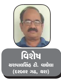
વિશેષ સશબ્દાલક્ષિંટી ડી. વાલેલા (દરબાર ગઝ, ઘરા)

સંસારના સર્વ વિષયોમાં મન હટી જાય અને ઈશ્વર સાથે એકરૂપ થઈ જાય એ મુક્તિ, પરમાત્મા આનંદ સ્વરૂપ છે મન સંસારના વિષયો સાથે એક થતું નથી, કારણ સંસાર જડ છે અને મન જડ નથી, પણ અર્થચેતન છે, સજાતીયમાં જ આથી મન ઈશ્વર સિવાય કોઈની સાથે અભિન્ન થતું નથી, એક થતું નથી, સંસારના વિષયોમાં રચ્યો પચ્યો રહેતો હોય તે પણ કો'ક વખત તો એનાથી ઘૂણા અનુભવે છે.