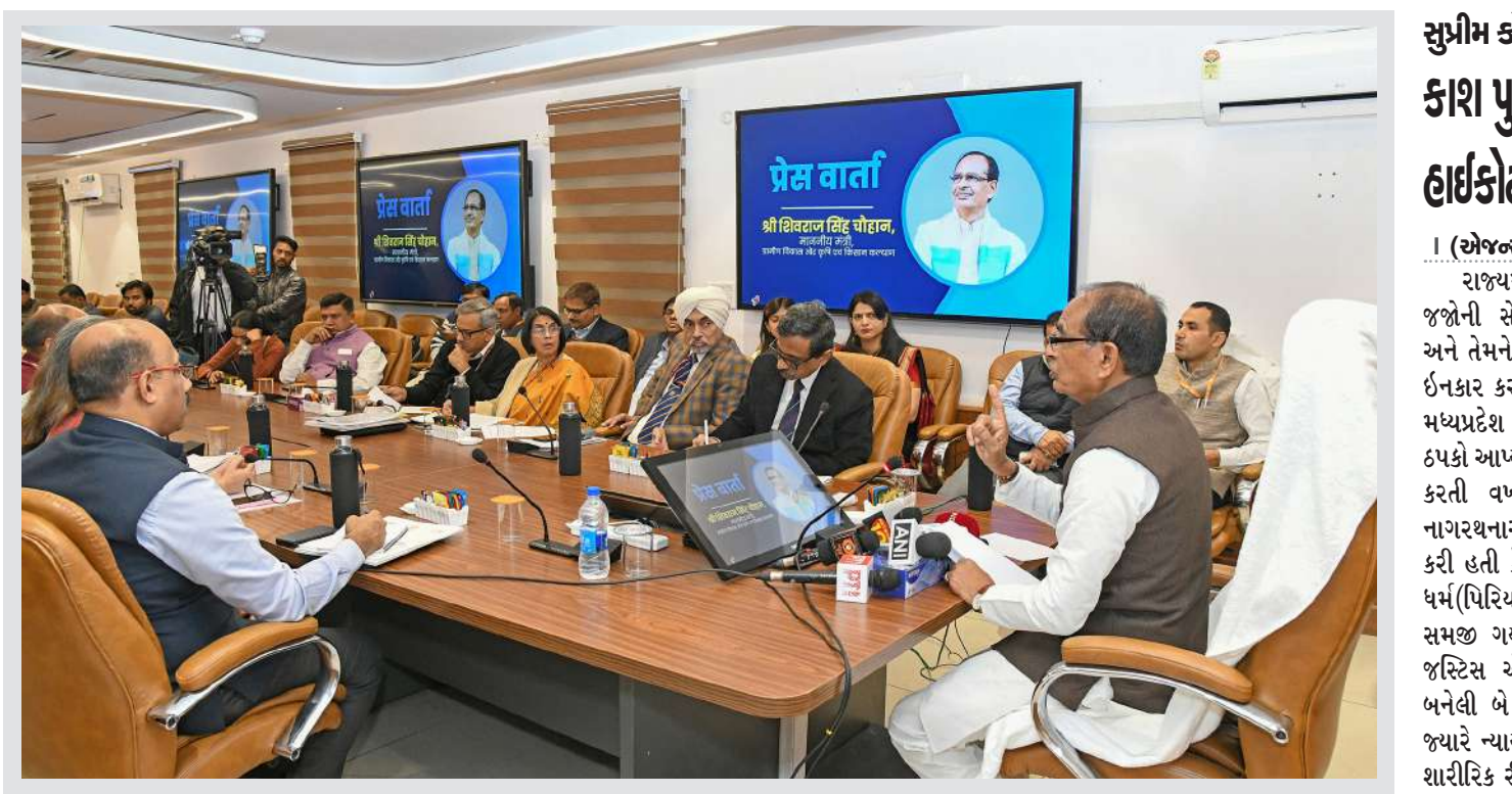
નવી દિલ્હીમાં કેન્દ્રીય કૃષિ અને ગ્રામીણ વિકાસ મંત્રી શિવરાજ સિંહ ચૌહાણે ગ્રામીણ વિકાસ મંત્રાલય હેઠળના ગ્રામીણ વિકાસ વિભાગની સિદ્ધિઓ વિશે મીડિયાને માહિતી આપી.

। (એજન્સી) ગાંધીયાબાદ, તા.૪ । દિલ્હીને અડીને આવેલા ગાંધીયાબાદમાં દિલ્હી-મેરઠ એક્સપ્રેસ હાઈવે પર ગાંધીપુર બોર્ડર પર ભારે ટ્રાફિકજામના દ્રશ્યો જોવા મળ્યાં. રાહુલ ગાંધી સંબંધ જઈ રહ્યાં છે અને કોંગ્રેસના કાર્યકર્તાઓ પર ઉત્તર્યાં છે. જેમાં બેરીકેડિંગના કારણે ટ્રાફિકજામમાં ફસાયેલા લોકોએ ભડક્યાં હતા અને નારેબાજી કરવા લાગ્યા હતા. મળતી માહિતી મુજબ, ટ્રાફિકજામમાં અટવાયેલા લોકોએ કોંગ્રેસ નેતા રાહુલ ગાંધી અને પ્રિયંકા ગાંધી વિરુદ્ધ પણ સૂત્રોચ્ચાર કર્યા હતા. જાણવા મળ્યું છે કે, કોંગ્રેસના સમર્થકોએ નારેબાજી કરનારા લોકોને માર માચ્યો હતો. આ પછી સામાન્ય લોકો અને કોંગ્રેસના કાર્યકર્તાઓ વચ્ચે ઘર્ષણ થયું હતું. સમગ્ર ઘટનાનો વીડિયો સોશિયલ મીડિયામાં વાઈરલ થઈ રહ્યો છે. કોંગ્રેસ કાર્યકર્તાઓ અને મુસાફરી કરી રહેલા લોકો વચ્ચે ઘર્ષણનો વીડિયો વાઈરલ થઈ રહ્યો છે. વીડિયોમાં જોવા મળે છે કે, કોંગ્રેસના સમર્થકો નારેબાજી કરતાં કેટલાક લોકોને હટાવી રહ્યા છે અને તેમની સાથે ઝઘડો કરી રહ્યાં છે. જ્યારે કોંગ્રેસના સમર્થકો અમુક લોકો સાથે મારામારી પણ કરી રહ્યાં છે અને ધક્કો મારીને ત્યાંથી હટાવી રહ્યાં છે. ગાંધીપુર બોર્ડર પર ફસાયેલા એક વ્યક્તિએ કહ્યું કે, મને ખબર નથી કે અમને કેમ રોકવામાં આવી રહ્યાં છે? રાહુલ ગાંધી રસ્તાની બીજી બાજુ છે તો આ રસ્તો કેમ રોક્યો? જનતાને પરેશાની ભોગવવી પડી રહી છે. આ સાથે અન્ય કેટલાક લોકોએ પણ નારાજગી વ્યક્ત કરી હતી. જ્યારે કોંગ્રેસ તરફથી કહેવામાં આવી રહ્યું છે કે, નારેબાજી કરી રહેલા લોકો ભાજપના કાર્યકર્તા હતા. જો કે, બધાને જગ્યા પર થી હટાવી રવામો આવ્યાં છે. સમગ્ર ઘટનાને લઈને પોલીસ સ્થળ પર તૈનાત કરી દેવામાં આવી છે. રાહુલ ગાંધી પણ દિલ્હી પરત જતા રહ્યા છે.