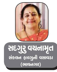
સંકલન ફાલ્ગુની વસાવડા (ભાવનગર)

કેટલું સુંદર પ્રાર્થના ગીત છે, પરંતુ આટલી સરસ રચનાનાં રચયિતા વિશે બહુ કોઈ ખાસ માહિતી નથી, ગુગલ પણ આમાં મારી કોઈ સહાયતા ન કરી શક્યું, કેવી અજીબ લાગે તેવી વાત છે નહીં!! આપણે તો પાંચ શબ્દો આમતેમ કરી લખીએ તો મારી રચના!! મારી રચના!! કરી ઢંદેરો પીટ્યા કરીએ છીએ, અને આટલી સરસ રચના કોઈ આપણને દાન કરી ગયું.