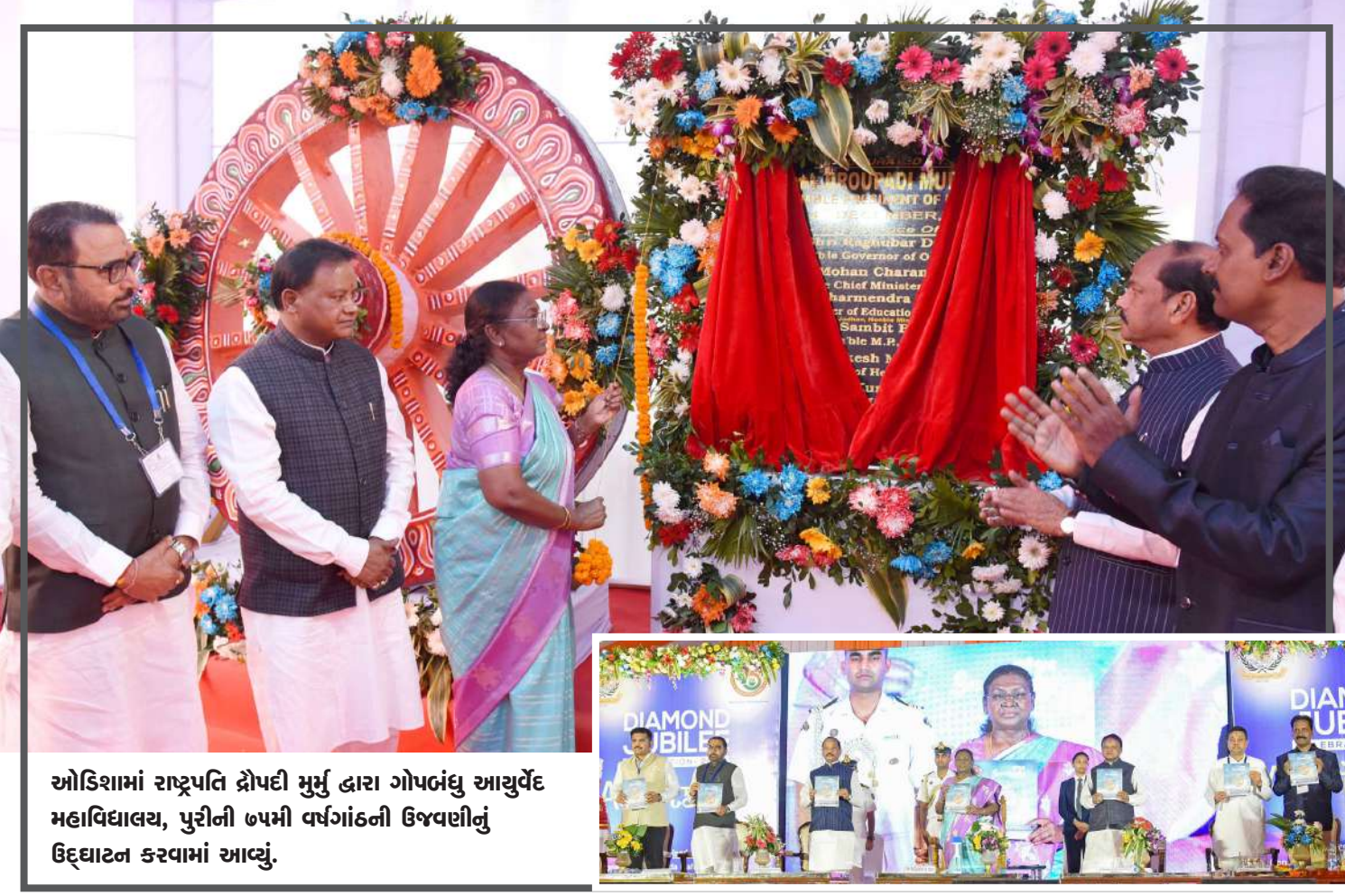
ઓડિશામાં રાષ્ટ્રપતિ દ્રોપદી મુર્મુ દ્વારા ગોપબંધુ આચુર્વેદ મહાવિદ્યાલય, પુરીની ૭૫મી વર્ષગાંઠની ઉજવણીનું ઉદ્ઘાટન કરવામાં આવ્યું.