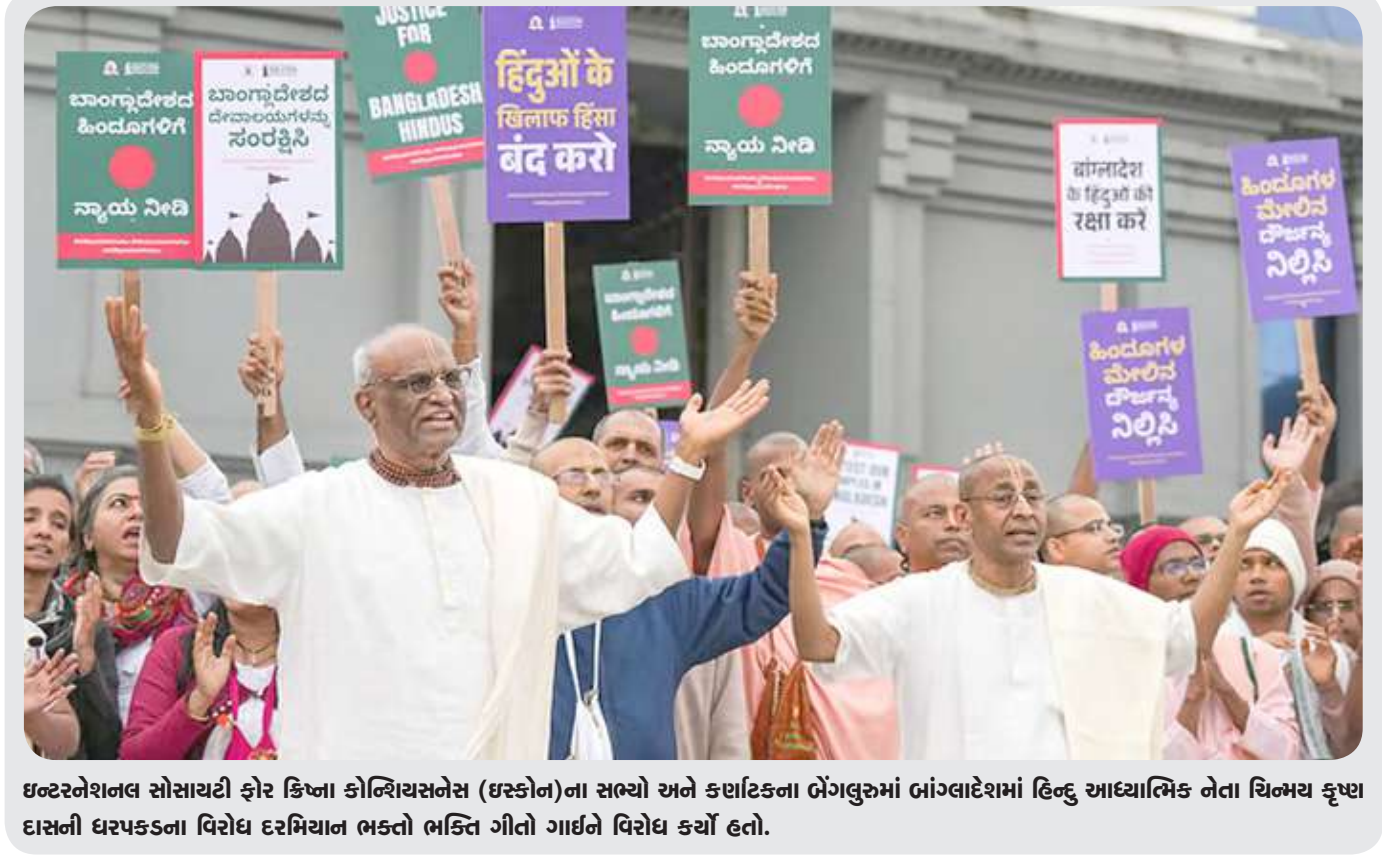
ઈન્ડિયન સોસાયટી ફોર ક્રિષ્ના કોન્સિયસનેસ (ઈસ્કોન)ના સભ્યો અને કથાકર્તાઓ દ્વારા ભગવાનને ધરમપ્રકાશન વિરોધ દરમિયાન ભક્તો ભક્તિ ગીતો ગાઈને વિરોધ કર્યો હતો.

ચેમ્પિયન્સ ટ્રોફી ૨૦૨૫નું આયોજન કયા અને કેવી રીતે થશે તે અંગેનો વિવાદ અટકવાનું નામ નથી લઈ રહ્યો. ભારત અને પાકિસ્તાન વચ્ચેના વિવાદને કારણે હજુ સુધી તેનું શેડ્યુલ જાહેર કરવામાં આવ્યું નથી. આઈસીસીએ ૨૯ નવેમ્બરના રોજ એક બેઠકનું આયોજન કર્યું હતું, જેમાં ચેમ્પિયન્સ ટ્રોફી ૨૦૨૫ના આયોજન અંગે નિર્ણય લેવાનો હતો, પરંતુ આ બેઠક બીજા દિવસ સુધી સ્થગિત કરવામાં આવી. હવે અપડેટ આવી રહ્યા છે કે, પાકિસ્તાન ક્રિકેટ બોર્ડ (PCB) આ ટૂંક સમયમાં હાઈબ્રિડ મોડલ હેઠળ યોજવા માટે સહમત છે, પરંતુ કેટલીક શરતો પણ મૂકી છે. ICCએ પાકિસ્તાન ક્રિકેટ બોર્ડ (PCB)ને અલીમેન્ટ આપ્યું હતું કે, ૨૦૨૫માં ચેમ્પિયન્સ ટ્રોફીની હોસ્ટિંગ માટે હવે હાઈબ્રિડ મોડલ જ