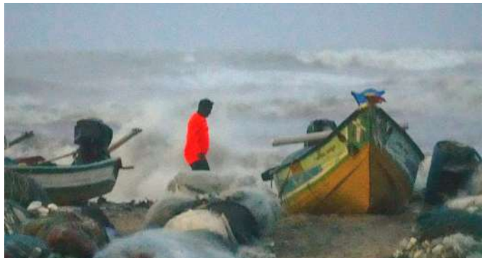
રહ્યું હતું. તે નબળું પડીને ડીપ ડિપ્રેસનમાં ફેરવાઈ ગયા હતા. IMDએ જણાવ્યું કે, ચક્રવાત ફેંગલ છેલ્લા એક કલાક દરમિયાન લગભગ સ્થિર છે. આગામી ત્રણ કલાક દરમિયાન તે ધીમે ધીમે ડીપ ડિપ્રેસનમાં ફેરવાશે. ફેંગલ ધીમે ધીમે પશ્ચિમ-દક્ષિણ-પશ્ચિમ તરફ આગળ વધશે. ચેન્નાઈ

ફેંગલ વાવાઝોડાએ મચાવી તબાહી, ચેન્નઈ જળમગ્ન, ૩ લોકોનાં મૃત્યુ વાવાઝોડુ ફેંગલે પુડુચેરી નજીક લેન્ડફોલ કર્યું, જેના કારણે ચેન્નાઈમાં ભારે વરસાદ અને પૂર આવ્યું ફેંગલ વાવાઝોડાએ મચાવી તબાહી, ચેન્નઈ જળમગ્ન, ૩ લોકોનાં મૃત્યુ વાવાઝોડુ ફેંગલે પુડુચેરી નજીક લેન્ડફોલ કર્યું, જેના કારણે ચેન્નાઈમાં ભારે વરસાદ અને પૂર આવ્યું