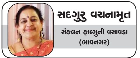
સદગુરુ વચનામૃત સંકલન ફાલ્ગુની વસાવડા (ભાવનગર)

આ પના શ્રીચરણમાં મારા સહ પરિવાર સાદર સાષ્ટાંગ પ્રેમ પ્રણામ. માનવી ઈશ્વરનો અંશ છે, અને તે જાણ વાર માટે ક્રિયા કે કર્મ વગર રહી શકતો નથી, પરંતુ તેની ક્રિયા કે કર્મ અહેતુ હોતી નથી, મોટેભાગે એની ક્રિયા લોકિક અર્થ કે હેતુ સભર હોય છે. હેતુ હોવાને કારણે ગમો અણગમો થવો સંભવ છે, અને તેથી તેને આંતરિક પ્રકૃતિમાં અને બાહ્ય પ્રકૃતિમાં સંતુલન જાળવવું હોય, તો પોતાની પ્રત્યે પણ અતૂટ વિશ્વાસ હોવો જરૂરી છે, અને બાહ્ય સંબંધ કે પ્રકૃતિ માટે પણ અતૂટ વિશ્વાસ હોવો જરૂરી છે. પરંતુ એનો મતલબ એ નથી કે તે નિષ્ક્રિય બની જીવન જીવે, કે પછી નિરસતાથી જીવન જીવે, અથવા તો આળસુ, કાયર, કે પ્રમાદી બની ને જીવન જીવે. પોતાના આંતર બાહ્ય વિશ્વાસ ની ધરોહર થકી એ શુભ મંગલ માટે થોડું ઘણું સહનશીલતા કેળવે, એ જરૂરી છે, અને આ રીતે સહજ થવું એ જ તો બુદ્ધિ નો અંતિમ નિષ્કર્ષ છે. આપણે ચરિત્રની ઓળખમાં રામાયણ કાળ ના પાત્ર પરિચય પર ચિંતન કરી રહ્યા છીએ, અને રામાયણ અંતર્ગત રાવણ એ પણ પોતાના ભાઈ વિભીષણને કાયર કહ્યો હતો, તો આજે