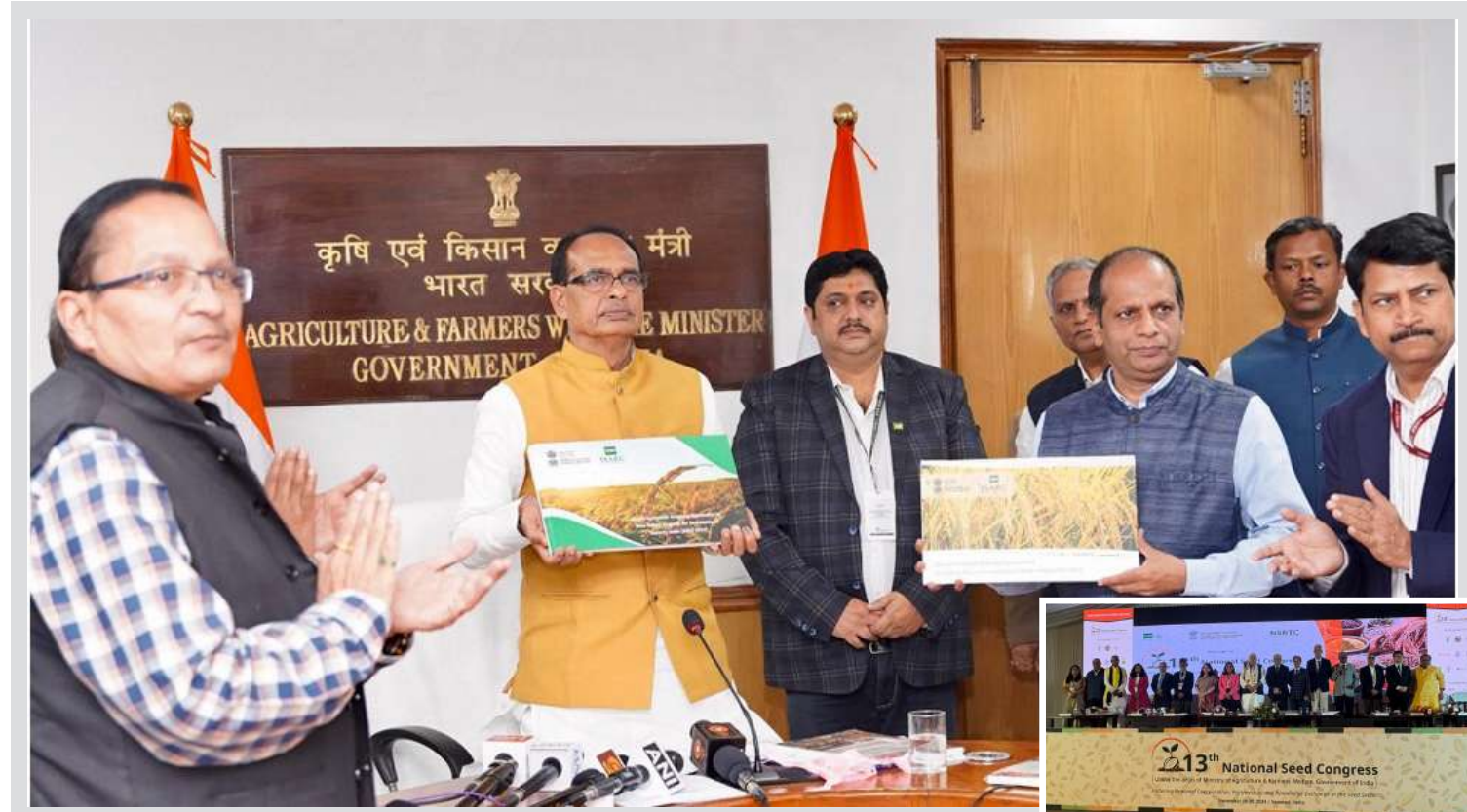
વારાણસીમાં કેન્દ્રીય કૃષિ અને ખેડૂત કલ્યાણ મંત્રી શિવરાજ સિંહ ચૌહાણે ૧૩મી રાષ્ટ્રીય બીજ કોંગ્રેસના ઉદ્ઘાટનમાં વસ્તુઅલ રીતે ઉપસ્થિત રહ્યા.