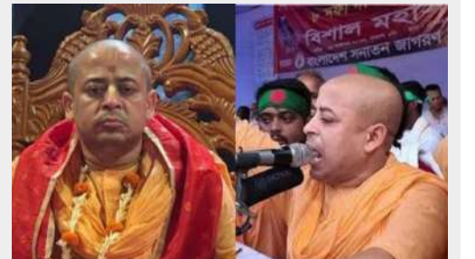
૧ ઢાકા, તા.૨૬ ।