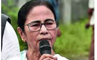
૧ (એજન્સી) કોલકાતા, તા.૨૬ ।