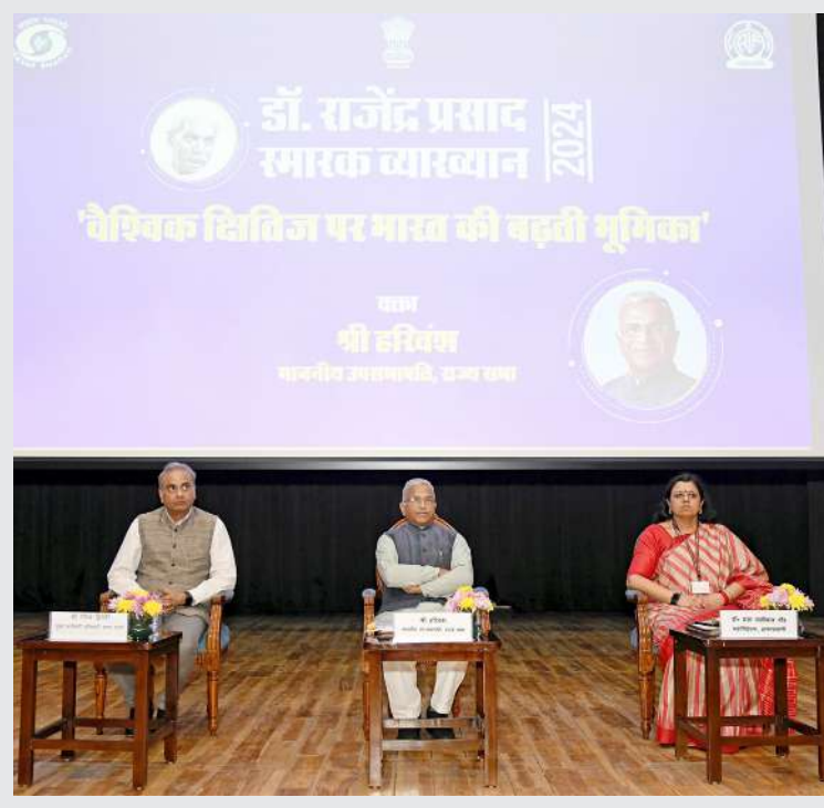
નવી દિલ્હીમાં રંગ ભવન ખાતે રાજ્યસભાના ઉપાધ્યક્ષ હરિવંશ આકાશવાણી ડો. રાજેન્દ્ર પ્રસાદ મેમોરિયલ લેક્ચર ૨૦૨૪ કાર્યક્રમમાં ઉપસ્થિત રહ્યા હતા.