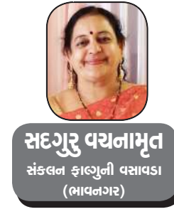
સદગુરુ વચનામૃત સંકલન ફાળુની વસાવડા (ભાવનગર)

તમે તમારા પરિવાર ને બચાવવા માટે જ્યારે કુરબાની આપતા હો ખાલી મરી જવું એમ નહીં પણ બધું છોડીને તમે જવું કરીને આખા પરિવારને બચાવવા માટે જે કરો છો ત્યારે એ પારિવારિક શહીદી છે, બીજું આખા સમાજ માટે પોતે હકદાર હોય છતાં એનો અધિકાર બધું જ સમાજના કલ્યાણ માટે જેણે જવું કરીને કુરબાની આપી હોય એ સામાજિક શહીદી છે ત્રીજું આખર રાષ્ટ્ર માટે જાણે શહીદી આપી હોય જે આપણી આ કથાના કેન્દ્રમાં છે.