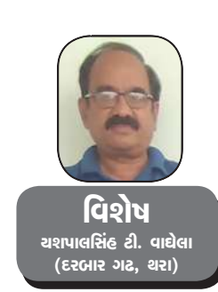
વિશેષ યશપાલસિંહ ડી. વાલેલા (દરબાર ગઝ, ઘરા)

૨૦૧૫માં વડા પ્રધાન નરેન્દ્ર મોદીએ એક રૂપિયાની નોટનું પ્રિન્ટિંગ ચાલુ કરાવ્યું છે, આ નોટનું પ્રિન્ટિંગ કામ ચાલ છે જેની પર ગાંધીજીના ચરમા અનેસ્વચ્છ ભારત લખેલું છે, એક રૂપિયાની નવી જાહેર કરેલી નોટનો રંગ ગુલાબી અને લીલો છે, જૂની નોટ ઈન્ડીગો બની હતી.