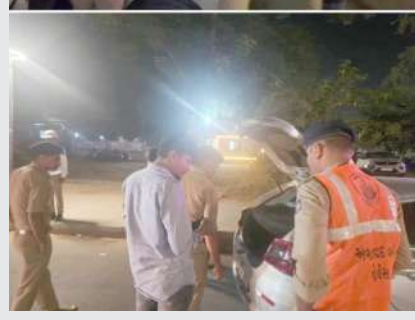
૧ (એજન્સી) અમદાવાદ, તા.૨૮

સરકારે શહેર પોલીસના અધિકારીઓને ઠપકો આપ્યા બાદ ઉચ્ચ પોલીસ અધિકારીઓએ સરકાર સુધી પોતાની કામગીરી બતાવવા નિર્દોષ લોકો પર નિયમોની આડમાં દંડો ઉગામ્યો છે. શહેર પોલીસે મેગા કોમ્બિંગ કર્યા બાદ બીજા દિવસે પણ અડધી રાત સુધી રોડ પર રહીને ૧૩ હજારથી વધુ વાહનો ચેક કર્યા હતા. જેમાં રૂ. ૧૦.૫૮ લાખનો દંડ વસૂલતા પ્રજામાં રોષ અને નારાજગી વ્યાપી છે.