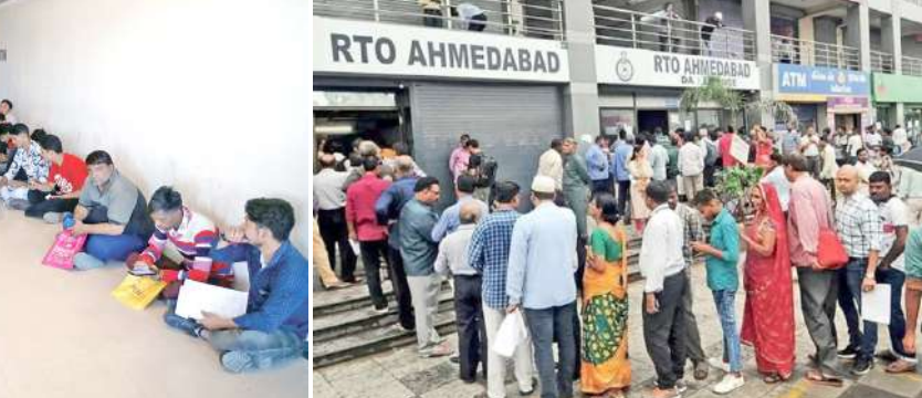
સરકારના ઠપકાનો રોષ અધિકારીઓએ સામાન્ય પ્રજા પર ઠાલવ્યો છે. જેથી ગુનેગારો હાથ ન લાગતા પોલીસે નિર્દોષ લોકો સામે કાર્યવાહીનો દંડો ઉગામ્યો છે. મંગળવારે રાત્રે પણ ઉચ્ચ પોલીસ અધિકારીઓએ ઝોન પ્રમાણે વાહન ચેકિંગ, વાહન રિટેઈન અને પ્રોહિબિશનના કેસ માટે ચોક્કસ ટાર્ગેટ આપતા શહેર પોલીસનો કાર્યકો અડધી રાત સુધી રોડ પર ઉતરી ગયો હતો.