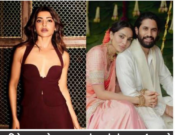
૪ ડિસેમ્બરના રોજ લગ્નના બંધનમાં બંધાવા જઈ રહ્યા છે

નાગા ચૈતન્ય અને શોભિતા ધુલીપાલાના લગ્નની તૈયારીઓ ચાલકોને આકર્ષિત કરી રહી છે. ચેન્નઈ અભિનેતાએ ભૂતકાળમાં સામન્થા રૂથ પ્રભુ સાથે લગ્ન કર્યા હતા. તાજેતરના એક ઈન્ટરવ્યુમાં, તેણીએ છૂટાછેડા અને તેની આસપાસના કલંક વિશે વાત કરી. નાગા ચૈતન્ય અને શોભિતા ધુલીપાલા ટૂંક સમયમાં જ મિસ્ટર અને મિસિસ બનવા જઈ રહ્યા છે. તેઓ ૪ ડિસેમ્બર, ૨૦૨૪ના રોજ લગ્નના બંધનમાં બંધાવા જઈ રહ્યા છે.