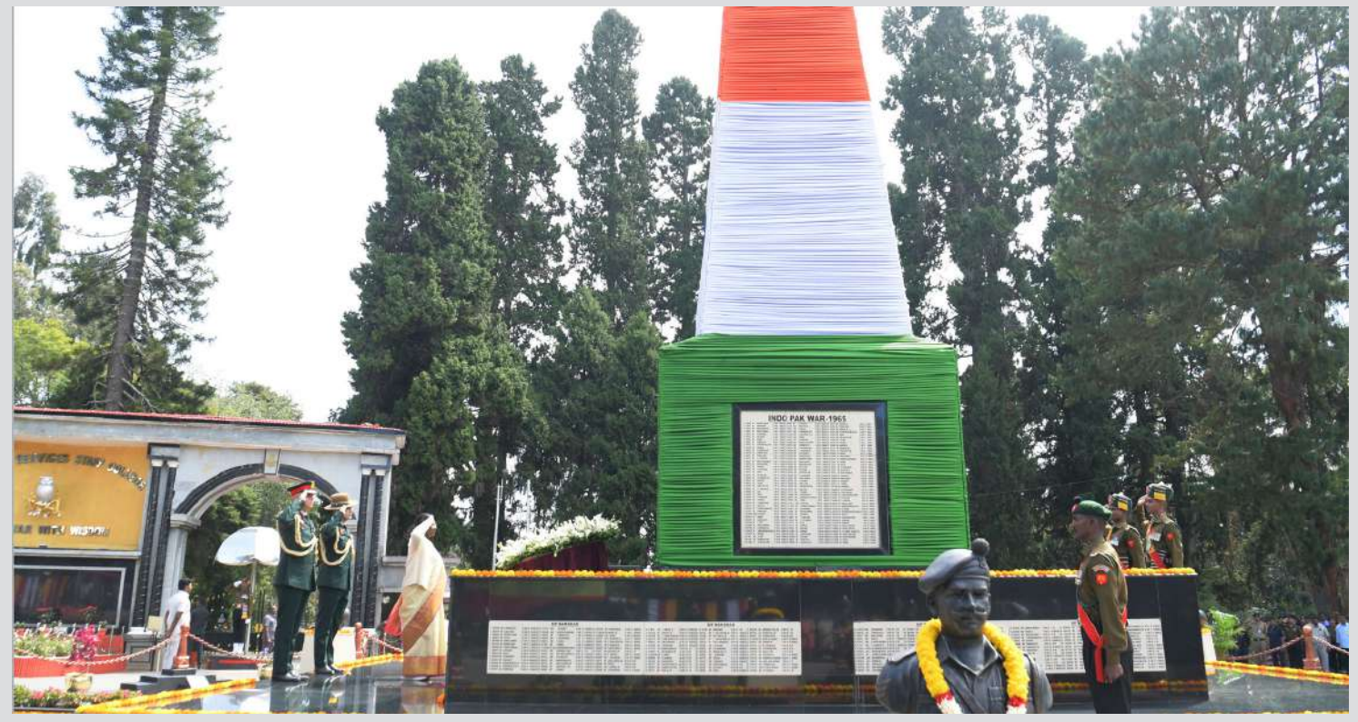
રાષ્ટ્રપતિ ટ્રોપેદી મુમુએ ડિકેન્સ સર્વિસીસ સ્ટાફ કોલેજ, વેલિંગ્ટન ખાતે સુલુ સ્મારક પર અને માતૃભૂમિની સેવામાં પોતાના જીવનનું બલિદાન આપનારા તમામ સૈનિકોને પુષ્પાંજલિ અર્પણ કરી.

1 (એજન્સી) ફારુખાબાદ, તા.૨૮ । લગ્ન અને સરકારી નોકરીને સીધો સંબંધ ઉત્તર પ્રદેશના ફારુખાબાદમાં જોવા મળ્યો હતો. વરે કન્યાના ગળામાં વરમાળા તો પહેરાવી પરંતુ, સરકારી નોકરી ન હોવાને કારણે કન્યા પક્ષે લગ્નનો ઈનકાર કરી દેતાં જાન કન્યા વગર પરત ફરવા માટે મજબૂર બની હતી. આમ, કન્યાની પ્રાર્થના નોકરી વાળા સાથે લગ્ન ન કરવાની જીદ અને વરનો સવા લાખ પગાર છતાં લાડીને સરકારી નોકરીનો મોહ એન્જિનિયરને ભારે પડ્યો હતો. પ્રાપ્ત માહિતી પ્રમાણે ફારુખાબાદમાં સરકારી ક્લાર્કના ટીકરાની જાન આવી હતી. ગેસ્ટ હાઉસમાં કન્યા પક્ષ દ્વારા તેનું ધમાકેદાર સ્વાગત પણ કરવામાં આવ્યું હતું. વરમાળા સહિતના રીતિરિવાજો મુજબ લગ્ન પણ કરાવી દેવામાં આવ્યા હતા. પરંતુ આ દરમિયાન એક વ્યક્તિએ વરરાજાની નોકરી વિશે પૂછ્યું અને વાત મારામારી પર આવી ગઈ હતી. વરરાજાના પરિવારને કન્યા પક્ષે નોકરી વિશે કહ્યું ત્યારે તેમણે જવાબ આપ્યો કે, તેમનો ટીકરો સિવિલ એન્જિનિયર છે.