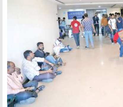
સરકારના ઠપકાનો રોષ અધિકારીઓએ સામાન્ય પ્રજા પર ઠાલવ્યો છે. જેથી ગુનેગારો હાથ ન લાગતા પોલીસે નિર્દોષ લોકો સામે કાર્યવાહીનો દંડો ઉગામ્યો છે. મંગળવારે રાત્રે પણ ઉચ્ચ પોલીસ અધિકારીઓએ ઝોન પ્રમાણે વાહન ચેકિંગ, વાહન રિટેઈન અને પ્રોહિબિશનના કેસ માટે ચોક્કસ ટાર્ગેટ આપતા શહેર પોલીસનો કાર્યકો અડધી રાત સુધી રોડ પર ઉતરી ગયો હતો.