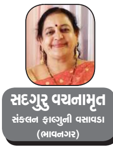
સદગુરુ વર્યાનામૃત સંકલન ફાઉન્ડેશન વસાવડા (ભાવનગર)

કવિએ તો આ ગીતમાં બાળપણના પ્રસંગોને ટાંકીને એને શબ્દ ચિત્ર આપ્યું છે. એટલે કે એને એ સમયનું બહુ એકાએક સ્મૃતિમાં આવે છે. બાળપણમાં કહેવાતી વાર્તા પણ જીવન ઘડતરમાં બહુ મહત્વનો ભાગ ભજવતી હોય છે, અને એટલે જ આપણે ત્યાં નાના બાળકોને વાર્તા દ્વારા સંસ્કાર શીખ આપવાની એક પ્રથા હતી.