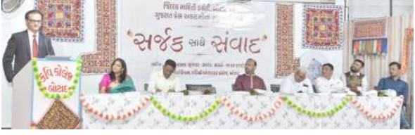
૧ (માહિતી બ્યુરો) બોટાદ, તા.૨૮