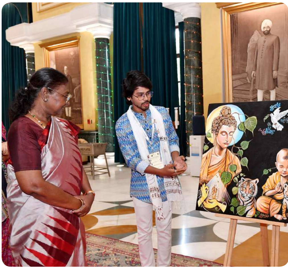
નવી દિલ્હીમાં રાષ્ટ્રપતિ ભવન ખાતે રાષ્ટ્રપતિ દ્રોપદી મુર્મુએ આદિવાસી કલાકારોને સુવિધા આપી કલાકૃતિના પ્રદર્શનની મુલાકાત લીધી.