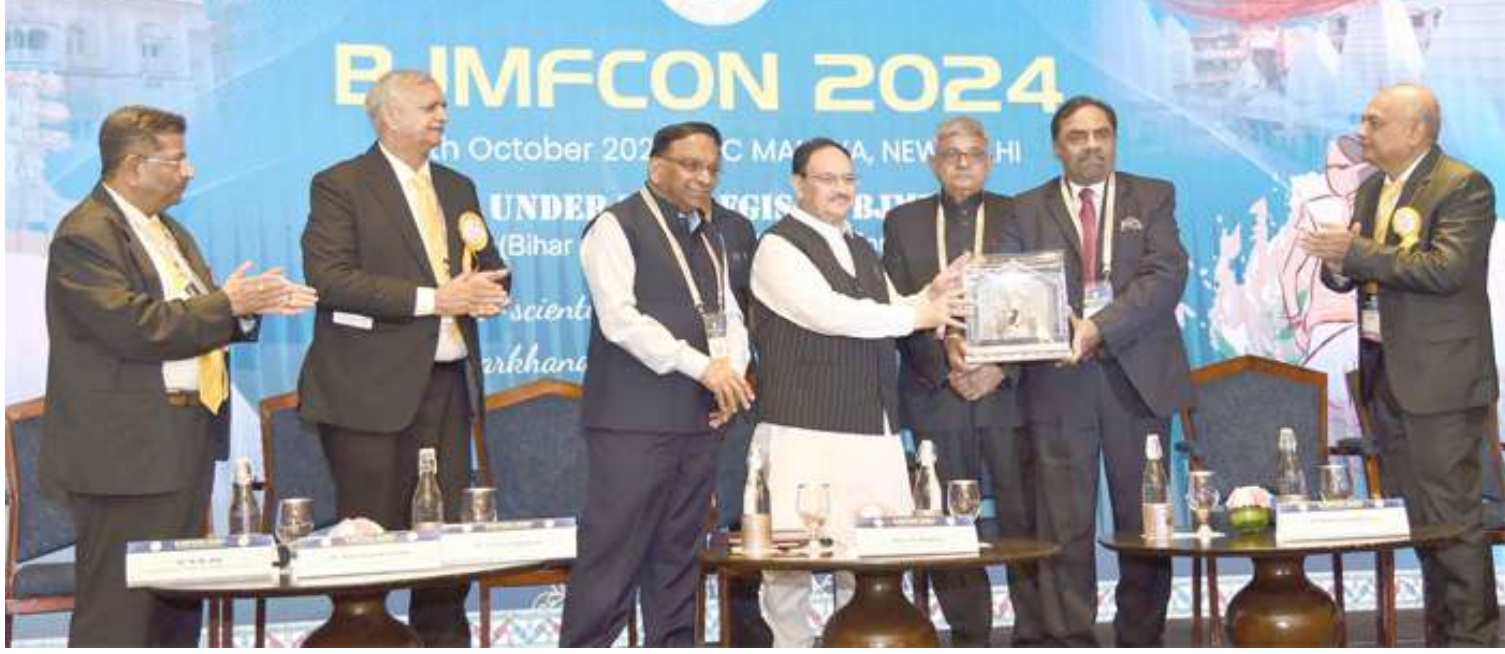
નવી દિલ્હીમાં બિહાર અને ઝારખંડ મેડિકલ ફોરમના નેજા હેઠળ BJMFCON 2024માં કેન્દ્રીય આરોગ્ય અને પરિવાર કલ્યાણ અને રસાયણ અને ખાતર મંત્રી શ્રી જગત પ્રકાશ નંદા ઉપસ્થિત રહ્યા હતાં.

આવી કોઈ ઓફર મેળવવાનો ઈનકાર કરી દીધો છે. તમને જણાવી દઈએ કે લાહોરથી ભારતનું અંતર માત્ર થોડાક કિલોમીટર છે. તેને જોતા PCBએ BCCIને દરેક મેચ બાદ ભારત પરત ફરવાનો નવો વિકલ્પ આપ્યો હતો. આપને જણાવી દઈએ કે પાકિસ્તાને ૧૯૯૬ થી કોઈ પણ ICC ટૂર્નામેન્ટનું આયોજન કર્યું નથી. આ વખતે તે ચેમ્પિયન્સ ટ્રોફી કરાવવા માટે ઉત્સુક છે. આ માટે PCBએ લાહોર, કરાચી અને રાવલપિંડીમાં યોજનારી ટૂર્નામેન્ટનું શેડ્યૂલ ICCને સુપરત કર્યું છે.