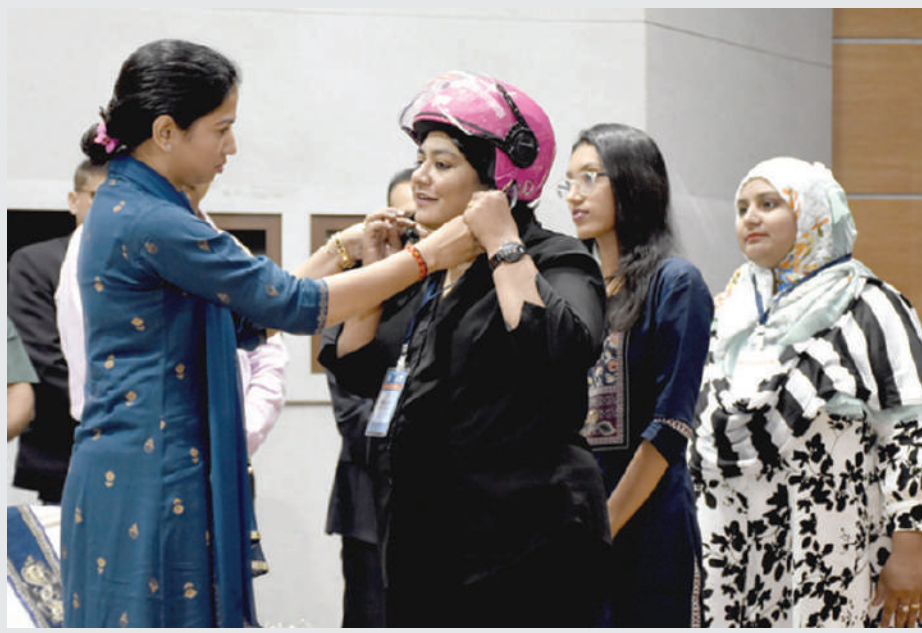
નેશનલ ફોરેન્સિક સાયન્સ યુનિવર્સિટી (NFSU) ગાંધીનગર ખાતે “ENSURING ROAD SAFETY THROUGH MOTOR VEHICLE LAWS” વિષય પર રાષ્ટ્રીય કક્ષાની કોન્ફરન્સ યોજાઈ હતી.

સુરત, તા.૨૦ | સુરતમાં દિવાળી પહેલાં પરપ્રાંતિયો વતન જવા રવાના થઈ રહ્યા છે. ઉધના રેલવે સ્ટેશન પર મુસાફરોનો ભારે ધસારો જોવા મળી રહ્યો છે. દિવાળી અને છઠ્ઠપૂજાના પર્વને લઈ યુપી, બિહાર મુસાફરો જઈ રહ્યા છે. રેલવે વિભાગ દ્વારા પ્લેટફોર્મ પર મોટી સંખ્યામાં પોલીસ કર્મચારીઓ સહિત રેલવે અધિકારીઓને તૈનાત કરાયા છે. મુસાફરોની એક લાઈન બનાવી વારાફરતી રેલવે બોગીઓમાં બેસાડવામાં આવી રહ્યું છે. રેલવે વિભાગ દિવાળી અને છઠ્ઠપૂજાના પર્વને લઈ ૮૫ વધુ ટ્રેનો દોડાવી રહી છે. આ ટ્રેનો ૧૩૮૦ યુપી, બિહારમાં ફેરા મારશે. મુસાફરનો ધસારો ઉમટી પડતાં રેલવે મુસાફરોને હાલાકી પડી રહી છે.