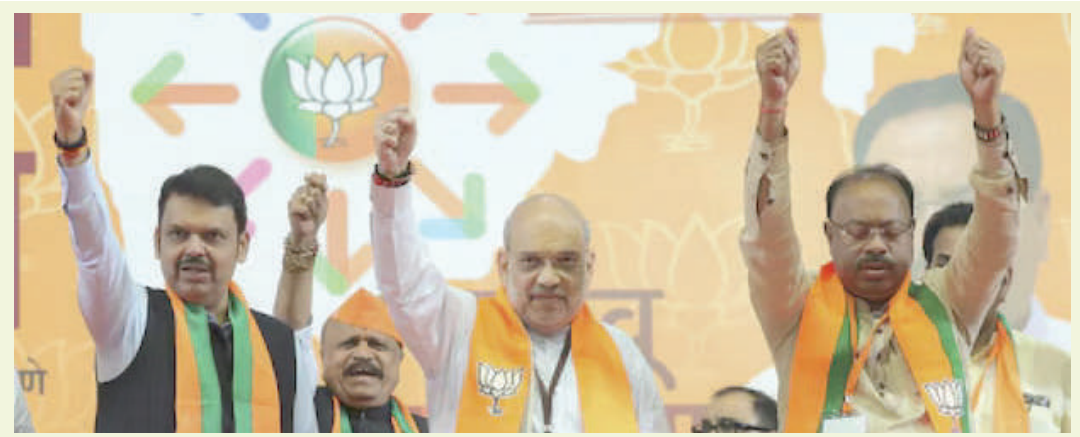
બેઠકો પર ઉમેદવારોને ટિકિટ આપી શકે છે. ચૂંટણી પંચે મહારાષ્ટ્ર ૨૦મીએ મતદાન યોજાશે, જ્યારે ૨૩મીએ ચૂંટણીના પરિણામની જાહેરાત કરાશે. જાહેર મુજબ ૨૨ ઓક્ટોબરે નોટિફિકેશન, મહારાષ્ટ્રમાં જાહેરાત કરાશે.

। (એજન્સી) મુંબઈ, તા.૨૦ । મહારાષ્ટ્ર વિધાનસભાની ચૂંટણી માટે ભાજપે ઉમેદવારોની પ્રથમ યાદી જાહેર કરી છે. જેમાં કુલ ૨૮૮ વિધાનસભા બેઠક પૈકી ૯૯ બેઠકો માટે ઉમેદવારોની યાદી જાહેર કરવામાં આવી છે. મહારાષ્ટ્ર ભાજપના દિગ્ગજ નેતા તથા રાજ્યના ઉપમુખ્યમંત્રી ફડણવીસ નાગપુર દક્ષિણ-પશ્ચિમ બેઠકથી ચૂંટણી લડશે. જ્યારે ભાજપના પ્રદેશ પ્રમુખ બાવનકુલે કામઠી, આશિષ શેલાર બાંદ્રા પશ્ચિમ, છત્રપતિ શિવેન્દ્ર રાજે ભોંસલે સતારાથી ચૂંટણી લડશે. ભાજપ મહારાષ્ટ્રમાં મહાયુતિ ગઠબંધનમાં ચૂંટણી લડવા જઈ રહ્યું છે. જેમાં ભાજપ, શિવસેના (શિંદે જૂથ), અને એનસીપી (અજિત પવાર) પણ સામેલ છે. બેઠક ફાળવણી મુદ્દે છેલ્લા કેટલાક દિવસો સુધી યોજાયેલી લાંબી બેઠકો બાદ ભાજપે ઉમેદવારોની પ્રથમ યાદી જાહેર કરી છે. મીડિયા રિપોર્ટ્સ અનુસાર, મહાયુતિ ગઠબંધન હેઠળ ભાજપ ૧૫૦-૧૬૦ બેઠકો પર ચૂંટણી લડવાની તૈયારીમાં છે, જ્યારે શિવસેના ૭૫થી ૮૫ બેઠકો પર ટિકિટ આપશે. એનસીપી ૪૮-૫૫