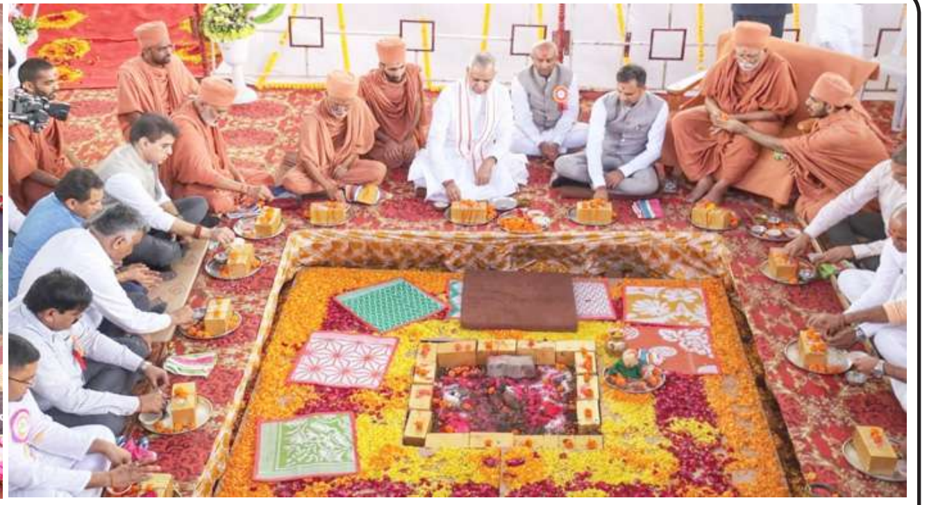
રાજ્યપાલ આચાર્ય દેવવ્રતે ગૌર-સોમનાથ જિલ્લાના ઉના ખાતે સ્વામિનારાયણ ગુરુકુળ રાજકોટ સંસ્થાની નૂતન શાખા સ્વામિનારાયણ ગુરુકુળ, ઉના તેમજ સહજાનંદ ધામનું ભૂમિપૂજન તેમજ શિલાન્યાસ કર્યું હતું.