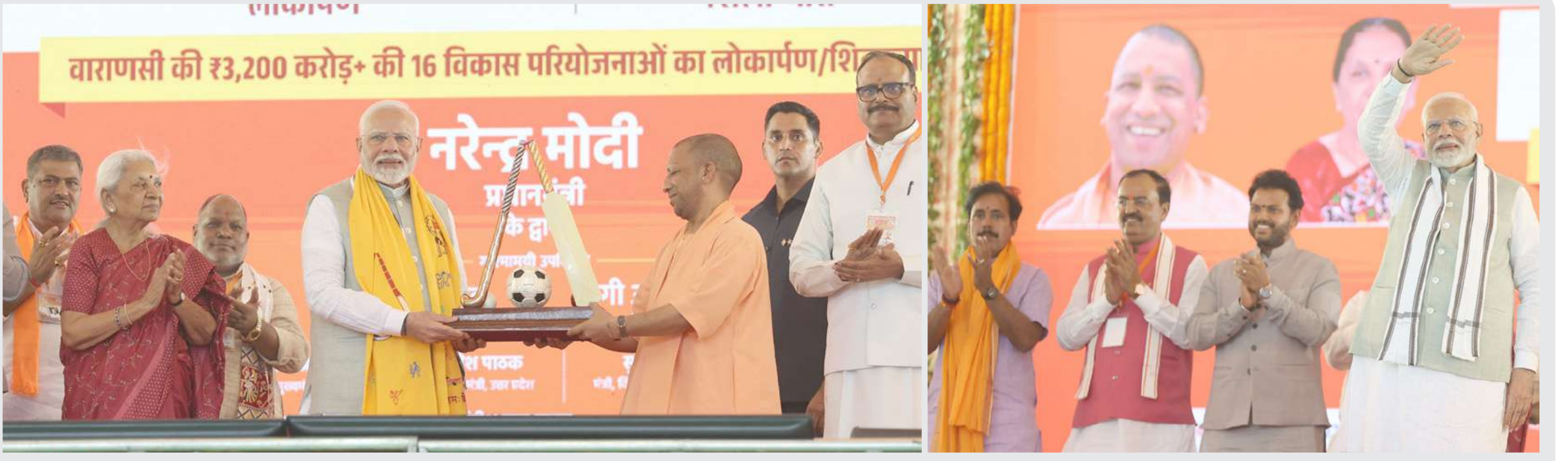
વડાપ્રધાન નરેન્દ્ર મોદી ઉત્તર પ્રદેશમાં વારાણસી ખાતે વિવિધ વિકાસલક્ષી પરિયોજનાઓનો શિલાન્યાસ અને ઉદ્ઘાટન કર્યું હતું.