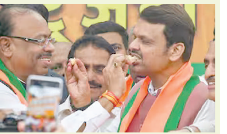
નોમિનેશનની છેલ્લી તારીખ ૨૯ ઓક્ટોબર, નોમિનેશન સ્ક્રુટિની ૩૦ ઓક્ટોબર, ફોર્મ પાછું ખેંચવાની છેલ્લી તારીખ ચોથી નવેમ્બર રહેશે.

ન્યૂઝ ડિસ્ક મુકેશ અંબાણીએ બદરીનાથ-કેદારનાથ ધામમાં કર્યા દર્શન । બદરીનાથ, તા.૨૦ । રિલાયન્સ ઈન્ડસ્ટ્રીઝના ચેરમેન અને મેનેજિંગ ડાયરેક્ટર મુકેશ અંબાણી અને તેમનો પરિવાર અવારનવાર ધાર્મિક કાર્યો કરતા રહે છે, જેની તસવીરો અને વીડિયો પણ સોશિયલ મીડિયામાં છવાતા રહે છે. દેશના સૌથી મોટા ઉદ્યોગપતિ મુકેશ અંબાણી દ્વારા આજે ફરી મોટું ધાર્મિક કાર્ય કરવામાં આવ્યું છે. તેઓએ આજે બદરીનાથ તેમજ કેદારનાથ ધામ પહોંચીને ભગવાનના દર્શન કર્યા છે. આ સાથે તેમણે મંદિરમાં પાંચ કરોડ રૂપિયાનું દાન પણ આપ્યું છે. કેદારનાથ મંદિર સમિતિના અધ્યક્ષ અજેન્દ્ર અજયે કહ્યું કે, ઉદ્યોગપતિ મુકેશ અંબાણી પહેલા બદરીનાથ ધામ પહોંચ્યા હતા. અહીં દર્શન કર્યા બાદ તેમણે કેદારનાથ ધામ જઈને દર્શન કર્યા હતા. સમિતિના ચેરમેન દ્વારા તેમનું સ્વાગત કરાયું હતું.