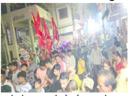
પડ્યું હતું. પગપાળા સંઘ જેમ જેમ યાત્રામાં આગળ વધતો જતો હતો તેમ તેમ નગરના દરેક માર્ગો પર મોં અંબાના આશીર્વાદ લેવા ભક્તોનો ઘસારો જોવા મળતો હતો. નગરના દરેક માર્ગો પર પગપાળા સંઘ બેંડબાજી અને નાશિક ઢોલના તાલે નીકળતા માર્ગ ભક્તો નાચતા ઝૂમતા જોવા મળતા હતા. નગરના દરેક માર્ગો પર ફટાકડાની ભવ્ય આતસભાજી કરવામાં આવતી હતી. પગપાળા સંઘને નગરના મુલાકા ચોકડી સુધી મુકવા નગરના લોકો આવેલ હતા. સહુ નગરજનો એ માર્ગ ભક્તોની પગપાળા યાત્રા સફળ રહે તેવા આશીર્વાદ આપી પગપાળા સંઘને નગરમાંથી વિદાય આપી હતી. માર્ગ ભક્તો પણ નગરના સહુ લોકોના આશીર્વાદ લઈ ધન્ય માની મોં અંબાના આશીર્વાદ થકી બોલ માંડી અંબે જય જય અંબેના જય જયકાર સાથે અંબાજી જવા રવાના થયું હતું.

। (પ્રતિનિધી) ઝાલોદ, તા.પ.। ઝાલોદ નગરમાં વાયરસ શુભ દ્વારા છેલ્લા ૨૪ વર્ષો થી પગપાળા યાત્રા સંઘ અંબાજી મંદિરે જવા આયોજન કરવામાં આવે છે. આ પગપાળા યાત્રા સંઘ ૨૦૦૦ ના વર્ષ થી ચાલે છે ફક્ત ૫ વ્યક્તિઓ થી ચાલુ કરવામાં આવેલ આ યાત્રાએ આજે મોટું રૂપ ધારણ કરેલ છે. આજની ૨૫ મી પગપાળા યાત્રાને વધાવવા મોટા પ્રમાણમાં નગરજનો ઉમટી પડેલ હતા. વાયરસ શુભ દ્વારા અંબાજી યાત્રામાં જનાર ભક્તોના નામ ૧ મહીના અગાઉથી લખવામાં આવે છે. જેથી યાત્રા દરમ્યાન કોઈ પણ પદયાત્રીને કોઈ પણ જાતની તકલીફ ન પડે. ઝાલોદ નગરનો અંબાજી મંદિરે પગપાળા સંઘ આજરોજ તારીખ ૦૪-૦૯-૨૦૨૪ ના રોજ રાત્રીના ૮ વાગે બોડિયાર મંદિરે ઉપસ્થિત રહ્યો હતો. ઉપસ્થિત સહુ લોકોએ બોડિયાર મંદિરે આરતી પૂજા તેમજ ઘવજનુ પૂજા અર્ચન કરી મોં અંબાના આશીર્વાદ લઈ સહુ માર્ગ ભક્તો બોલ માંડી અંબે જય જય અંબેના જયઘોષ સાથે નીકળ્યું હતું. નગરમાં પગપાળા સંઘની યાત્રા જેમ જેમ નીકળવા લાગી તેમ યાત્રાને વધાવવા તેમજ માતાના રથના આશીર્વાદ લેવા મોટા પ્રમાણમાં લોકો ઉમટી પડ્યા હતા. આ પગપાળા સંઘના યાત્રીઓને અંબાજી જવા આશીર્વાદ આપવાં નગરના માર્ગો પર મોટા પ્રમાણમાં માનવ મહેરામણ ઉમટી