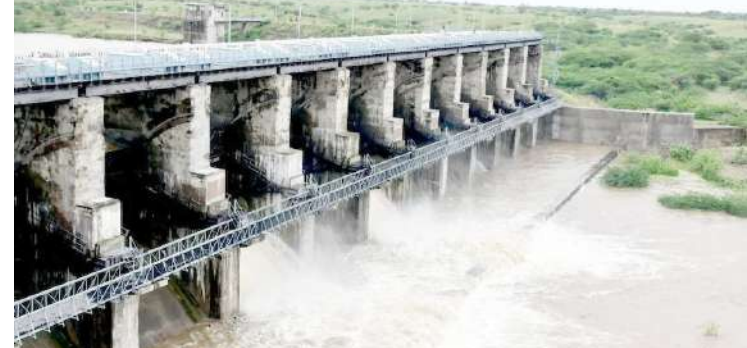
|(એજન્સી) બોટાદ, તા.૫ | સુખભાદર ડેમ બોટાદના લોકો માટે જવાદોરી સમાન છે. હાલ ઉપરવાસમાં આવે સારો વરસાદ વરસતા ડેમ છલકાયો હતો. હાલ ડેમ છલકાવવાને કારણે ડેમના ૪ દરવાજા ૧-૧ ફૂટ સુધી ખોલાયા હતા. ત્યારબાદ હવે ૨૦૨૪માં આ ઘટનાનું પુનરાવર્તન થયું છે.

સુખભાદર ડેમ પૂર્ણ સપાટીએ ભરાતા ડેમના ૪ દરવાજા એક-એક ફૂટ સુધી ખોલવામાં આવ્યા હતા