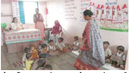
પ્રોત્સાહિત કરવામાં આવ્યા. તેમજ આંગણવાડી કેન્દ્રની ચકાસણી કરવામાં આવી. જેમાં આવેલ (એચ.સી.એમ સ્ટોક, THR સ્ટોક) ની ચકાસણી કરવામાં આવી. બાળકો દ્વારા કરવામાં આવેલ પૂર્વ પ્રાથમિક શિક્ષણની ચકાસણી કરવામાં આવી.

। (પ્રતિનિધી) ઝાલોદ, તા.પ.। આ આકસ્મિક મુલાકાતમાં આંગણવાડી કાર્યકર/તેડાગર હાજર હતા. કાળીમહુડી આંગણવાડી કેન્દ્રની મુલાકાત લીધી જેમાં પોષણ ટ્રેકર મુજબ લાભાર્થી છે કે નથી તે ચેક કરવામાં આવ્યું બાળકોને થીમ પ્રમાણે કાર્યકર દ્વારા પ્રવૃત્તિ કરવામાં આવી. મેનુ મુજબ બાળકોને સવારનો નાસ્તો દૂધ સંજોગની યોજના અંતર્ગત આપવામાં આવ્યું. બપોરનો નાસ્તો બાળકો માટે અને પોષણ સુધાનું જમવાનું આપવામાં આવ્યું. અને નાના નાના ભૂલકાઓને પ્રોગ્રામ ઓફિસર દ્વારા બાળકોને પગરખાં વિતરણ કરી બાળકોને