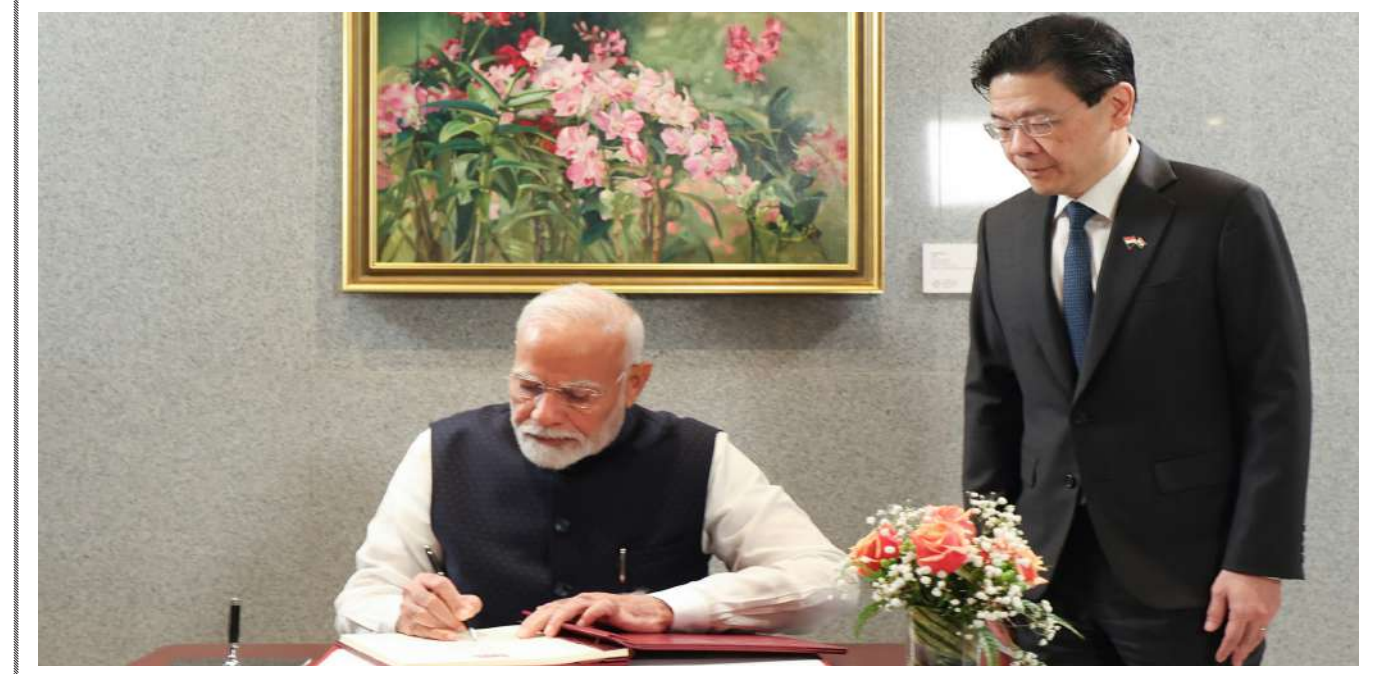
સિંગાપોરમાં ઔપચારિક સ્વાગત દરમિયાન મુલાકાતીઓની પુસ્તક પર હસ્તાક્ષર કરતા વડાપ્રધાન નરેન્દ્ર મોદી. આ સાથે સિંગાપોરના વડાપ્રધાન લોરેન્સ વોંગ ઉપસ્થિત રહ્યા હતાં.

હતું. આ દરમિયાન ક્રિમે એવા અહેવાલોને નકારી કાઢ્યા હતા જેમાં કહેવામાં આવ્યું હતું કે પૂરના કારણે દેશભરમાં હજારો લોકોના મોત થયા છે. આ પહેલીવાર નથી જ્યારે ક્રિમે કથિત નિષ્ફળતા માટે ફાંસીની સજાનો આદેશ આપ્યો હોય. અહેવાલો અનુસાર, ૨૦૧૮ માં, ઉત્તર કોરિયાના પરમાણુ રાજદૂત ક્રિમ હ્યોક ચોલને ક્રિમ અને રાષ્ટ્રપતિ ડોનાલ્ડ ટ્રમ્પ વચ્ચે યુએસ સાથે શિખર સંમેલન ન કરવા બદલ ફાંસી આપવામાં આવી હતી. ઉત્તર કોરિયામાં જાહેરમાં ફાંસીની લાંબી પરંપરા છે. કોરિયા ટાઇમ્સ અનુસાર, રોગચાળા પહેલા, દર વર્ષે સરેરાશ ૧૦ ફાંસીની સજા કરવામાં આવતી હતી, પરંતુ ગયા વર્ષે આ સંખ્યા વધીને ઓછામાં ઓછી ૧૦૦ થઈ ગઈ હતી.