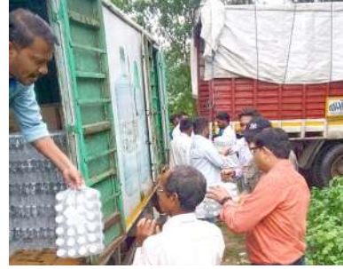
ફૂડ પેકેટ તથા ૩૦૦૦૦ પાણીની બોટલો મોકલવામાં આવી હતી. આમ સતત બે દિવસ દરમિયાન અમદાવાદ જિલ્લા વહીવટીતંત્ર દ્વારા આશરે ૫૬૦૦૦ જેટલા ફૂડ પેકેટ અને ૫૬૦૦૦ જેટલી પાણીની બોટલો મોકલવામાં આવી હતી.

વડોદરા શહેરમાં ભારે વરસાદ બાદ તારાજી સર્જતા જનજીવન અસ્તવ્યસ્ત બન્યું છે. શહેરમાં અનેક જગ્યાએ વિશ્વામિત્રી નદીના પાણી ફરી વળતા લોકોની હાલત કફોડી બની છે ત્યારે તંત્ર દ્વારા રાત દિન રાહત બચાવની કામગીરી કરાઈ રહી છે. આવામાં અન્ય જિલ્લાઓના વહીવટીતંત્ર દ્વારા અનેક પ્રકારની મદદ કરાઈ રહી છે. પૂરગ્રસ્ત વડોદરાની આ વિકટ પરિસ્થિતિમાં અમદાવાદ જિલ્લા વહીવટીતંત્ર દ્વારા સરાહનીય કામગીરી કરવામાં આવી છે. અમદાવાદ કલેક્ટર સુશ્રી પ્રવીણા ડી.કે. ના માર્ગદર્શનમાં જિલ્લા વહીવટીતંત્ર દ્વારા સતત બે દિવસથી મોટા પ્રમાણમાં ફૂડ પેકેટ તૈયાર કરી અને પાણીની બોટલોનો જથ્થો વડોદરા મોકલવામાં આવ્યો હતો. પૂર અસરગ્રસ્ત વિસ્તારોમાં