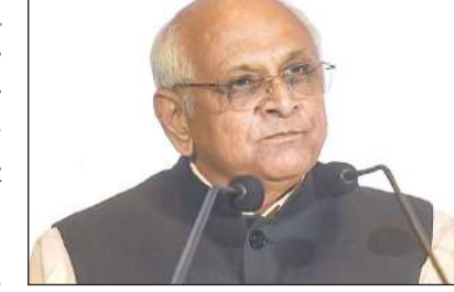
સરળતાથી અને મોટી સંખ્યામાં ધિરાણ મદદ આપે એ દિશામાં વિચારે. આ તબક્કે મુખ્યમંત્રીએ જણાવ્યું હતું કે, ગુજરાત દેશનું ગ્રોથ એન્જિન બન્યું છે. હવે અમુતકાળમાં વિકસિત ભારત માટે વિકસિત ગુજરાતથી પણ ગુજરાત અગ્રેસર રહેવાનું છે. આ હેતુસર રાજ્ય સરકારે અર્નિંગ વેલ અને લિવિંગ વેલના બે મુખ્ય પિલર પર ૨૦૪૭ સુધીનો આગવો રોડ મેપ તૈયાર કર્યો છે. જે મુજબ દરેક વ્યક્તિ અર્થતંત્ર સાથે જોડાઈને આગળ વધે ત્યારે જ ૨૦૪૭માં વિકસિત ભારતના વડાપ્રધાનના સંકલ્પને સાકાર

ગાંધીનગરમાં મુખ્યમંત્રી ભૂપેન્દ્ર પટેલના અધ્યક્ષ સ્થાને ૧૮૨મી સ્ટેટ લેવલ બેન્કર્સ કમિટી (SLBC)ની બેઠક યોજાઈ હતી. જેમાં મુખ્યમંત્રીએ એવા કેટલાક સૂચનો કર્યા હતા કે, (૧) નાના વેપારીઓ કિસાનો સહિતના જે લાભાર્થીઓને મળવાપાત્ર ધિરાણ સહાય યોજનામાં સરકાર ગેરંટર છે, તેવા લાભાર્થીઓને ધિરાણ આપવામાં ગતિ લાવવા બેંકોને સહયોગ આપે (૨) પીએમ સ્વનિધિ જેવી નાના વેપારીઓ-ફેરિયાઓને આત્મનિર્ભર બનાવતી ધિરાણ સહાયમાં અને નાના બેંકૂનોની કિસાન ક્રેડિટ જેવી યોજનાઓમાં પણ સરકાર ગેરંટર હોય છે ત્યારે બેંકોને ધિરાણ સામે સિક્યુરિટીની કોઈ સમસ્યા હોવી ન જોઈએ (૩) પશુધન અને માછીમારોના ક્રેડિટ કાર્ડની યોજનામાં બેન્કર્સ ગતિ લાવે (૪) જન કલ્યાણ યોજનાઓમાં બેન્કર્સ ઉત્તમ યોગદાન આપે (૫) યુવા ઉદ્યોગ સાહસિકોના સ્ટાર્ટઅપને પણ બેંક