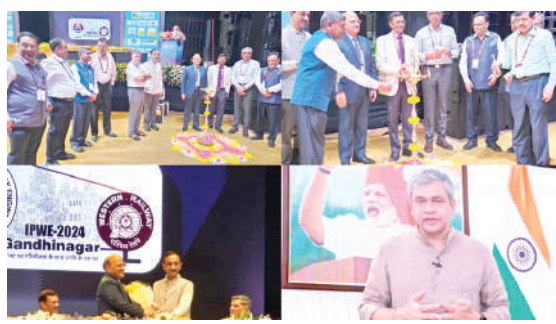
ગાંધીનગર, તા.૩૦ |