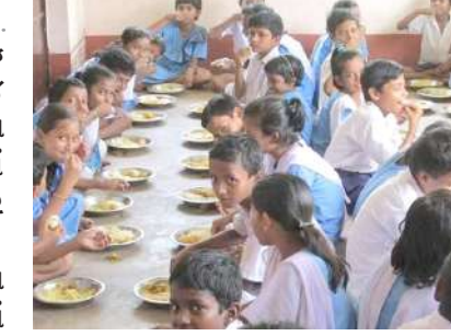
હેઠળ રાજ્યની સરકારી અને ગ્રાન્ટેડ પ્રાથમિક શાળાના વિદ્યાર્થીઓને બપોરનું ગરમ ભોજન આપવામાં આવે છે.

રાજ્યની સરકારી અને ગ્રાન્ટેડ પ્રાથમિક શાળાના બાળકોને હવે મધ્યાહન ભોજનમાં રોજ શાકભાજી ખાવા મળશે. પી.એમ. પોષણ યોજના અંતર્ગત બાળકોના મેનુમાં ફેરફાર કરવામાં આવ્યો છે. જેમાં શાકભાજીના વધુ ઉપયોગ પર ભાર મુકાયો હોવાનું જાણવા મળે છે.