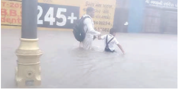
! (એજન્સી) દેવભૂમિ દ્વારકા, તા.૩૦ !

ગોમતી નદી અને દરિયો એક થવાથી ગોમતી ઘાટ ડૂબ્યો