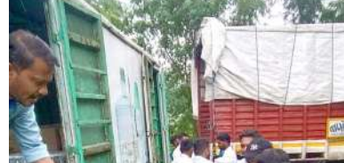
આ મુલાકાત દરમિયાન કલેક્ટર યોગેશ નિરગુડેએ ઝાલોદ તાલુકામાં આવેલ પંચ કિષ્ના, માંડવી ખુટાના માંડલેશ્વર તેમજ ઝાલોદ પોલીસ સ્ટેશનની વિઝીટ કરી ઝાલોદ પ્રાંત કચેરી ખાતે સંકલનના અધિકારીઓ સાથે સમીક્ષા બેઠક કરી હતી. ઉપરાંત ગરાડુ મુખ્ય પ્રાથમિક શાળા, ગરાડુ ગ્રામ પંચાયત તેમજ ગરાડુ પ્રાથમિક આરોગ્ય કેન્દ્રની પણ મુલાકાત લીધી હતી. એ સાથે તેઓએ જે ઘરોમાં વરસાદના કારણે નુકસાન થયું હોય તેમની પણ મુલાકાત લઈ થયેલ નુકસાનનો તાગ મેળવ્યો હતો.

સમગ્ર રાજ્યભરમાં અત્યારે વરસાદી માહોલ સર્જાઈ રહ્યો છે ત્યારે ઝાલોદ જિલ્લામાં વરસાદે વિરામ લેતાં જિલ્લા કલેક્ટર યોગેશ નિરગુડેએ વરસાદ થકી થયેલા નુકસાનની સમીક્ષા કરવા ઝાલોદ તાલુકાના અસર ગ્રસ્ત સ્થળોની મુલાકાત કરી હતી.