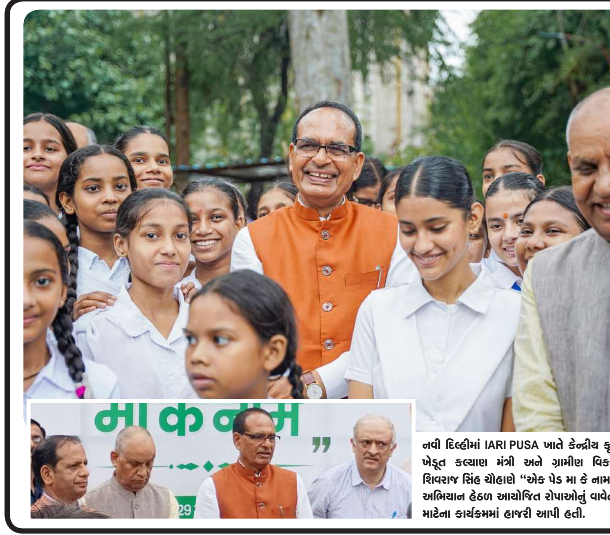
નવી દિલ્હીમાં IARI PUSA ખાતે કેન્દ્રીય કૃષિ મંત્રી, ખેડૂત કલ્યાણ મંત્રી અને ગ્રામીણ વિકાસ મંત્રી શિવરાજ સિંહ ચૌહાણે "એક પેડ મા કે નામ" વિશેષ અભિયાન હેઠળ આયોજિત સોપાઓનું વાવેતર કરવા માટેના કાર્યક્રમમાં હાજરી આપી હતી.

છે પરંતુ એવું નથી. કેન્દ્રીય મંત્રી નીતિન ગડકરીએ કહ્યું કે ભારતમાં દર વર્ષે પાંચ લાખ જેટલા માર્ગ અકસ્માત થાય છે. તેમાંથી ૧.૫ લાખ લોકો મૃત્યુ પામે છે અને ત્રણ લાખ લોકો ઈજાગ્રસ્ત થયા છે. FICCNના રોડ સેફ્ટી એવોર્ડ્સ અને કોન્કલેવ ૨૦૨૪ને સંબોધતા, કેન્દ્રીય માર્ગ પરિવહન મંત્રી નીતિન ગડકરીએ કહ્યું કે, ભારતમાં યુદ્ધ, આતંકવાદ અને નક્સલવાદ કરતાં વધુ લોકો માર્ગ અકસ્માતમાં મૃત્યુ પામે છે.