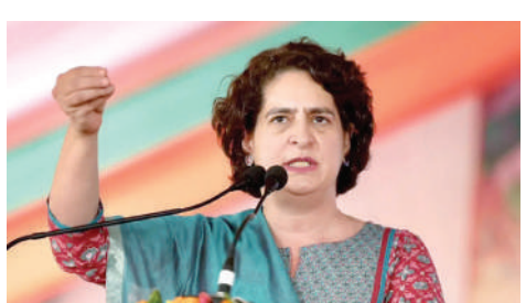
હવાલાત'. આ પોલિસી સત્યને દબાવવાનો વધુ એક પ્રયોગ છે. શું ભાજપ લોકતંત્ર અને બંધારણને કચડવાથી વધારે વિચારી જ ન શકે? ઉત્તર પ્રદેશની કેબિનેટ દ્વારા ડિજિટલ મીડિયા પોલિસી ૨૦૨૪ રજૂ કરવામાં આવી છે. આ પોલિસીમાં કોને કેટલી સજા મળશે અને કોણ સોશિયલ મીડિયા દ્વારા કમાણી કરી શકશે એ તમામ માહિતી આવરી લેવામાં આવી છે. એન્ટી-નેશનલ પોસ્ટ કરનારને હવે ઉંમર કેદ સુધીની સજા પણ મળી શકે છે. દેશ વિરુદ્ધ પોસ્ટ કરનારને હવે સજા આપવામાં આવશે. અત્યાર સુધી ફિડમ

। (એજન્સી) નવી દિલ્હી, તા.૨૯ । ઉત્તર પ્રદેશ સરકારે નવી સોશિયલ મીડિયા પોલિસીને મંજૂરી આપી દીધી છે. ડિપાર્ટમેન્ટ લાંબા સમયથી આ અંગે નીતિ લાવવાનો પ્રયાસ કરી રહ્યો હતો. સરકારે કહ્યું કે, સોશિયલ મીડિયા પર પોસ્ટ કરવામાં આવતી સામગ્રી અભદ્ર, અશ્લીલ અને રાષ્ટ્ર વિરોધી ન હોવી જોઈએ. હવે કોંગ્રેસ નેતા પ્રિયંકા ગાંધીએ યુપીની આ પોલિસી પર પ્રતિક્રિયા આપી છે. સોશિયલ મીડિયા પ્લેટફોર્મ ઠ પર તેમણે એક પોસ્ટમાં લખ્યું કે, 'જે તમને પસંદ હોય એ જ વાત કહીશું, તમે દિવસને રાત કહો તો રાત કહીશું'. પ્રિયંકા ગાંધીએ લખ્યું કે, યુપી સરકારની સોશિયલ મીડિયા પોલિસીમાં ન્યાય માગી રહેલી મહિલાઓનો અવાજ કઈ શ્રેણીમાં આવશે? ૬૮૦૦૦ શિક્ષકોની ભરતીમાં અનામત કોઠામાં ઠેકાટા સવાલ કઈ શ્રેણીમાં આવશે? ભાજપ નેતાઓ અને ધારાસભ્યો દ્વારા ભાજપ સરકારની પોલ પોલવીએ કઈ શ્રેણીમાં આવશે? તમે દિવસને રાત કહો તો રાત નહીંતર