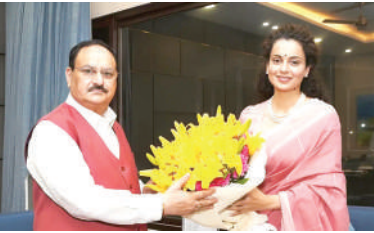
ક્યાંક સરકાર સાથે જોડાયેલી પાર્ટીના ટોચના નેતૃત્વમાં નિર્ણય લેવામાં આવે છે, આવા મુદ્દા પર તમે નિવેદન ન આપો. તમે સાંસદ જરૂર છો, પરંતુ તમે નીતિગત બાબતો પર અધિકૃત નથી અને ન તો તમને તેના પર બોલવાની મંજૂરી છે.' ભાજપ કંપનાના નિવેદનને લઈને પોતાનો નફો-નુકસાન જોઈ

। (એજન્સી) નવી દિલ્હી, તા.૨૯ । બોલિવૂડ અભિનેત્રી અને ભાજપના સાંસદ કંગના રણૌત ખેડૂતો પરના પોતાના નિવેદનને લઈને વિપક્ષ દ્વારા પ્રહારો કરી રહ્યાં છે, ત્યારે કંગના જાતિગત વસ્તી ગણતરી પરના પોતાના નિવેદનને લઈને વિવાદમાં આવી છે. આ દરમિયાન, આજે (૨૯ ઓગસ્ટ) ભારે વિવાદ વચ્ચે કંગનાએ દિલ્હીમાં ભાજપના રાષ્ટ્રીય અધ્યક્ષ જેપી નડડા સાથે મુલાકાત કરી હતી. જેપી નડડાએ કંગનાને કહ્યું કે, 'જો તમારે વાત કરવી હોય તો તમારા સાંસદ ક્ષેત્ર વિશે વાત કરવી જોઈએ, ત્યાંની સમસ્યા વિશે વાત કરવી જોઈએ. પરંતુ નીતિગત મુદ્દે અને જે ક્યાંકને