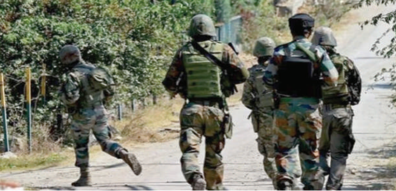
આતંકીઓનો ખાત્મો કરીને સેનાની સ્થિતિ મજબૂત કરવા માટે વધુ સૈનિકો મોકલવામાં આવ્યા છે.

ગયા હતા. આ પછી અથડામણ શરૂ થયું હતું. મળતી માહિતી મુજબ, આ વિસ્તારમાં બેથી ત્રણ આતંકવાદીઓ છુપાયેલા છે. આતંકીઓનો ખાત્મો કરીને સેનાની સ્થિતિ મજબૂત કરવા માટે વધુ સૈનિકો મોકલવામાં આવ્યા છે.