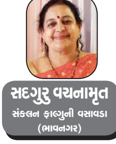
સંદગુરુ વયનામૃત સંકલન ફાલ્ગુની વસાવડા (ભાવનગર)

હિંદુ ધર્મ અનુસાર નાગેશ્વરનો અર્થ નાગોના ઈશ્વર થાય છે, ભગવાન નાગેશ્વરનાં પૂજન અર્ચનથી વિષ આદિથી બચાવનો સાંકેતિક અર્થ પણ છે, રુદ્ર સંહિતામાં આ ભગવાનને દારુકાવને નાગેશ કહેવામાં આવ્યાં છે, ભગવાન શિવનું આ પ્રસિદ્ધ જ્યોતિર્લિંગ ગુજરાત પ્રાંતમાં દારુકા પુરીથી લગભગ ૧૭ માર્ચલની દૂરી પર સ્થિત છે, આ પવિત્ર જ્યોતિર્લિંગનાં દર્શનનો શાસ્ત્રોમાં મોટો મહિમા બતાવવામાં આવ્યો છે.