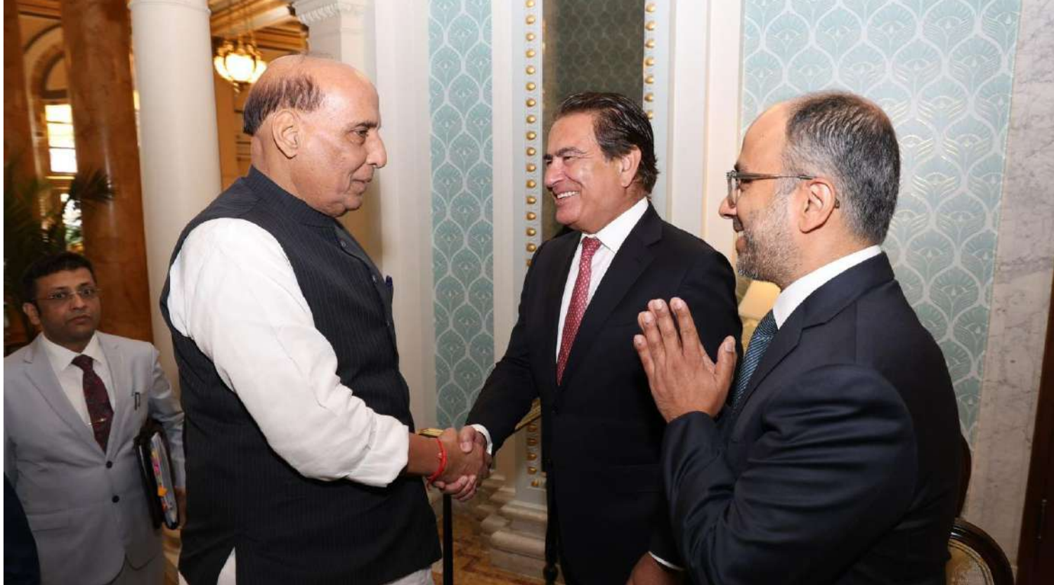
યુએસએમાં વોશિંગ્ટન ડીસી ખાતે કેન્દ્રીય સંરક્ષણ પ્રધાન રાજનાથ સિંહએ તેમની રાઉન્ડ-ટેબલ બેઠક પછી યુએસ સંરક્ષણ ઉદ્યોગના વરિષ્ઠ નેતાઓ સાથે મુલાકાત કરી.

। (એજન્સી) નોઈડા, તા.૨૪ । નોઈડામાં પોલીસે એક નક્લી IAS અધિકારીની ધરપકડ કરી છે, જેણે પોતાની સાથે બે બંદૂકધારીઓ પણ રાખ્યા હતા. પોલીસે તેના બંદૂકધારીઓ સહિત ચાર લોકોની ધરપકડ કરી છે. પોલીસનું કહેવું છે કે આ આરોપી પોલીસ હોવાનો રોક બતાવીને લોકો પાસેથી પૈસા પડાવતો હતો. તેની પાસેથી એક રિવોલ્વર અને પિસ્તોલ પણ મળી આવી છે. મળતી માહિતી મુજબ, નક્લી IAS અધિકારીની સાથે બે બંદૂકધારીઓ અને એક ડ્રાઈવર પણ રાખતો હતો. તે કાર પર લાલ બત્તી લગાવીને ફરતો હતો. તે અલગ-અલગ વિભાગના અધિકારીઓ પાસે જતો હતો અને IAS હોવાનું કહી રોક જમાવતો હતો અને લોકો પાસેથી છેતરપિંડી કરીને પૈસા પડાવતો હતો. પોલીસના જણાવ્યા અનુસાર, IAS અધિકારી હોવાનો દાવો કરનાર આરોપીનું નામ કૃષ્ણ પ્રતાપ સિંહ છે. તે લોકો પર રોક જમાવતો હતો અને લોકોને કહેતો હતો કે તેનું પોસ્ટિંગ ગુલ મંત્રાલયમાં છે અને તે ત્યાં જોઈન્ટ ડાયરેક્ટરની પોસ્ટ પર કામ કરે છે. તેની સાથે બે બંદૂકધારીઓને જોઈને લોકો તેની વાત માનતા હતા. આ સમગ્ર મામલા અંગે ADCP મનીષ કુમાર મિશ્રાએ જણાવ્યું હતું કે એક વાહન પકડાયું હતું જેમાં ચાર લોકો મુસાફરી કરી રહ્યા હતા.