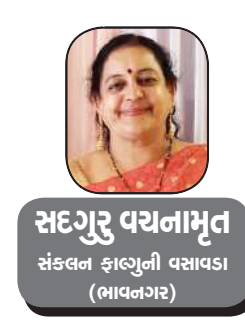
સદગુરુ વચનામૃત સંકલન ફાઉન્ડેશન વસાવકા (ભાવનગર)

શિવ વિશે વાત કરીએ તો શિવએ સમસ્ત વિદ્યાઓના જ્ઞાતા છે. જ્યોતિષ શાસ્ત્ર, યોગ શાસ્ત્ર, નૃત્યવિદ્યા, વ્યાકરણ વગેરેના પ્રવર્તક ભગવાન શિવ છે, વેદિક, પૌરાણીક, સાંસારીક કે શાસ્ત્રને લગતી તમામ બાબતોમાં શિવ તત્ત્વ જ વિદ્યમાન છે, અને શ્રેષ્ઠ ફળ આપનાર છે, આપણે સૌ જાણીએ છીએ કે પંચમહાભૂત માંથી બનેલા આ શરીરને બાહ્ય પ્રકૃતિમાં જે સ્થિત છે.