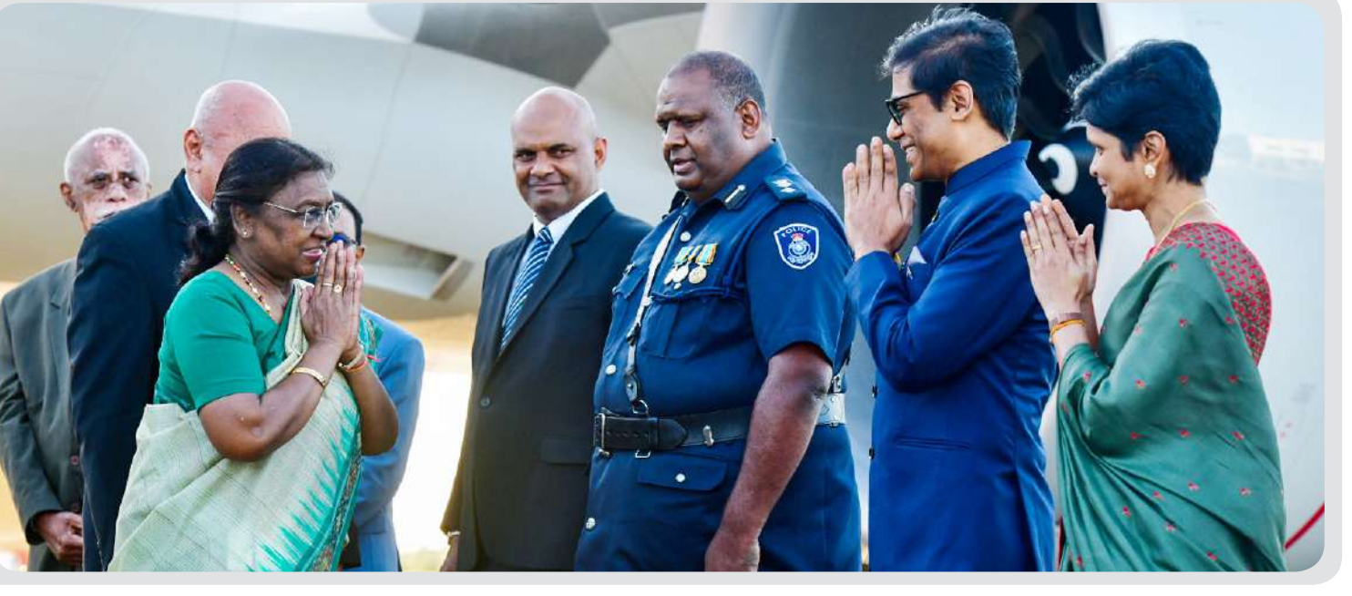
નાડીમાં ભારતના રાષ્ટ્રપતિ દ્રૌપદી મુર્મુનું ફિજીના નાયબ વડા પ્રધાન વિલિયમ ગાવોકા, ભારતના હાઈ કમિશનર પી એસ કાર્તિકેયન અને ફિજીયન સરકારના અન્ય અધિકારીઓ દ્વારા સ્વાગત કરવામાં આવ્યું.

ન થાય. પરંતુ કમનસીબી એ છે કે, આજના ભારતમાં રાજ્યપાલો એવાં કામ કરી રહ્યા છે જે તેમણે ન કરવા જોઈએ. પરંતુ તેઓ તે બાબતોમાં નિષ્ક્રિય દેખાય છે, જેની તેમની પાસેથી અપેક્ષા રાખવામાં આવી હોય." જસ્ટિસ નાગરત્નાએ કહ્યું કે, આપણે સંઘીય માળખાનું ધ્યાન રાખવું જોઈએ. આ સિવાય મૂળભૂત અધિકારો અને સિદ્ધાંતો પર પણ વાત થવી જોઈએ. મહત્વની વાત એ છે કે, રાજ્યો અને કેન્દ્ર બંને સમજે છે કે તેમની પાસે રાષ્ટ્રીય અને પ્રાદેશિક અપેક્ષાઓ પૂરી કરવાનો જવાબદારી છે. ન્યાયાધીશ ભારતપૂર્વક જણાવ્યું રાજકીય બાબતોથી દૂર રહેવું જોઈએ હતું કે, રાજ્યોના વિચારોને મહત્વ આપવું જોઈએ.