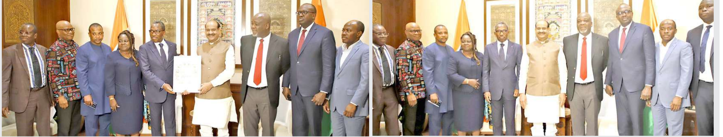
ટોગોના મંત્રીઓ, સંસદસભ્યો, બંધારણીય અદાલતના ન્યાયાધીશો અને સલાહકારોના એક પ્રતિનિધિમંડળે નવી દિલ્હીમાં સંસદભવન ખાતે લોકસભાના અધ્યક્ષ ઓમ બિરલા સાથે મુલાકાત કરી.