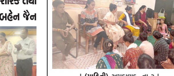
। (માહિતી) અમદાવાદ, તા.૨ । રાજ્યભરમાં નારી વંદન સપ્તાહની ઉજવણી તા. ૧થી ૮ ઓગસ્ટ દરમિયાન કરવામાં આવી રહી છે. ૨જી ઓગસ્ટ, બેટી બચાવો, બેટી પઢાવો દિવસ નિમિત્તે ગુજરાત સરકારના મહિલા અને બાળ વિકાસ વિભાગ દ્વારા મહિલા સશક્તિકરણ, સુરક્ષા અને સ્વાસ્થ્યના સૂત્રને સાર્થક કરવા અમદાવાદ જિલ્લાની વિવિધ જગ્યાએ કાર્યક્રમનું આયોજન કરવામાં આવ્યું હતું. અમદાવાદના એલિસબ્રિજ, સંન્યાસ આશ્રમ ખાતે આવેલ સરકારી કન્યા છાત્રાલયમાં મહિલા સુરક્ષાના વિવિધ પ્રકલ્પો તથા મહિલા કલ્યાણની વિવિધ યોજના અંગે માહિતી આપતા જાગૃતિ સેમિનારનું આયોજન કરાવવા આવ્યું હતું.