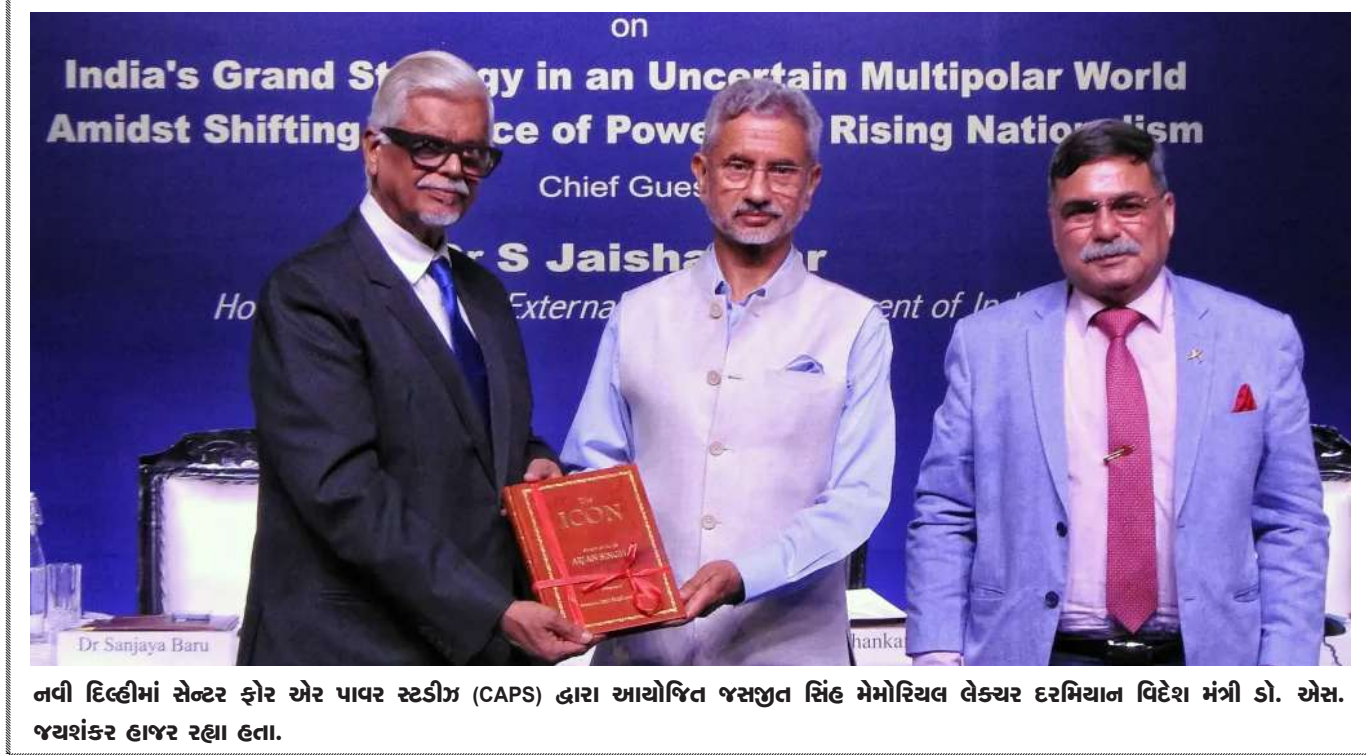
નવી દિલ્હીમાં સેન્ટર ફોર એર પાયર સ્ટડીઝ (CAPS) દ્વારા આયોજિત જસજીત સિંઘ મેમોરિયલ લેક્ચર દરમિયાન વિદેશ મંત્રી ડો. એસ. જયશંકર હાજર રહ્યા હતા.

હુમલા કેસની સુનાવણી કરી હતી. સુપ્રીમ કોર્ટે આ સંબંધમાં દિલ્હી પોલીસને નોટિસ જારી કરી છે, જેમાં વૈભવકુમારે જામીન નકારવાના દિલ્હી હાઈકોર્ટના આદેશને પડકાર્યો છે. જીએ સુનાવણી દરમિયાન કહ્યું હતું કે, તેણીની શારીરિક સ્થિતિથી અવગત હોવા છતાં સાથે ગેરવર્તનના મામલામાં વૈભવકુમારને તેની સાથે અસભ્ય વર્તન કર્યું. મહત્વપૂર્ણ છે કે, સ્વાતિ માલીવાલે આરોપ લગાવ્યો હતો કે જ્યારે તે ૧૩ મેના રોજ સીએમ આવ્યા પર ગઈ હતી ત્યારે વૈભવકુમારે તેની સાથે ગેરવર્તન કર્યું હતું અને મારપીટ કરી હતી.