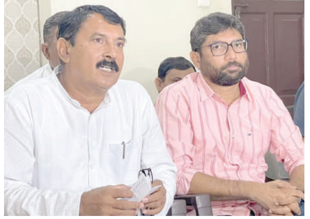
કોંગ્રેસ દ્વારા ભાજપના પાપનો ઘડો નામ અપાશે. આ ઘડામાં લોકો ભાજપ સરકાર પ્રત્યેની ફરિયાદો ચિઠ્ઠીમાં લખી નાખી શકશે અને તેને ચોક્કસ જગ્યાએ ફોડી નાખવામાં આવશે. આ ન્યાય યાત્રામાં ૧૦૦ જેટલા પદયાત્રીઓ સતત સાથે રહેશે. આ ઉપરાંત અલગ અલગ પદયાત્રીઓ પણ જોડાશે. કુલ ૩૦૦ કિલો મીટરની આ ન્યાય યાત્રા હશે જેમાં દરરોજ ૨૫ થી ૩૦ કિલોમીટરનું અંતર કાપવામાં આવશે. કોંગ્રેસના નેતાઓએ કહ્યું હતું કે, એક પણ જગ્યાએ ઢોલ નગારાથી આ ન્યાય યાત્રાનું સ્વાગત નહીં કરવામાં આવે. માત્ર સુતરની આટીઓ થી જ સ્વાગત કરવામાં આવશે.

। (એજન્સી) રાજકોટ, તા.૨ । કોંગ્રેસ ગુજરાતમાં ન્યાય યાત્રા કરવા જઈ રહ્યું છે. મોરબી થી શરૂ થનારી આ ન્યાય યાત્રા રાજકોટ સુરેન્દ્રનગર થઈને ગાંધીનગર સુધી પહોંચશે. કુલ ૩૦૦ કિલોમીટરની આ ન્યાયયાત્રા ફરશે. આ ન્યાય યાત્રા અંગે માહિતી આપવા આજે ખાસ પત્રકાર પરિષદ યોજાઈ હતી. આગામી ૯ ઓગસ્ટથી કોંગ્રેસની ન્યાય યાત્રાનો પ્રારંભ થશે. આ ન્યાય યાત્રા મોરબી ખાતે બનેલી ઝુલતાપુલ દુર્ઘટનાના સ્થળેથી શરૂ થશે. દુર્ઘટના સ્થળ પરથી ધ્વજ ફરકાવી સવારમાં ૮:૦૦ વાગે આ યાત્રાનો પ્રારંભ કરાશે. મોરબીથી શરૂ થનારી આ ન્યાય યાત્રા ટંકારા જશે ત્યાંથી ગૌરીદળ જશે અને રતનપર થઈ ૧૧ તારીખે રાજકોટ પહોંચશે. રાજકોટમાં TRP ગેમ્સ ઝોન ખાતે સંવેદના સભા યોજવામાં આવશે. આ ન્યાય યાત્રા રાજકોટમાં રાત્રી રોકાણ કરશે ત્યારબાદ બીજા દિવસે શહેરના અલગ અલગ સ્થળ પર ફરશે. ૧૩ તારીખે આ યાત્રા આગળ વધશે. ૧૫ મી ઓગસ્ટના દિવસે સુરેન્દ્રનગર ખાતે ધ્વજ વંદન કાર્યક્રમ યોજાશે. સુરેન્દ્રનગરથી આગળ વધી અમદાવાદ ખાતે પહોંચશે. અમદાવાદ શહેર અને તેના આસપાસના વિસ્તારમાં આ ન્યાય યાત્રા ફરશે. ત્યારબાદ વિધાનસભા સત્ર શરૂ થશે એ દરમિયાન આ ન્યાય યાત્રા ગાંધીનગર ખાતે પહોંચશે. કોંગ્રેસની આ ન્યાયયાત્રામાં રાહુલ ગાંધી, પ્રિયંકા ગાંધી, વેણુ ગોપાલ, મલ્લિકાઅજુન ખડગે સહિતના નેતાઓને આમંત્રણ આપવામાં આવશે. આ તમામ નેતાઓ પોતાની અનુકૂળતા પ્રમાણે આ ન્યાય યાત્રામાં જોડાશે. મોરબી થી શરૂ થતી ન્યાય યાત્રામાં એક ઘડો હશે જેને