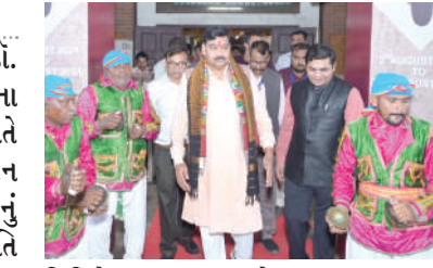
લિમિટેડ (TRIFED) એ ભારત સરકારના આદિજાતિ બાબતોના મંત્રાલય હેઠળની એક અગ્રણી સંસ્થા છે, જે આદિવાસી સમુદાયોને સશક્તિકરણ કરવા અને તેમની અનન્ય પ્રવૃત્તિઓને પ્રોત્સાહન આપવા માટે સમર્પિત છે. આદિજાતિ બાબતોના મંત્રાલય હેઠળ નોડલ એજન્સી તરીકે, TRIFED તેમની વર્ષો જૂની પરંપરાઓને જાળવી રાખીને આદિવાસી લોકો માટે જીવનની ગુણવત્તા સુધારવા માટે પ્રતિબદ્ધ છે.

। (માહિતી) અમદાવાદ, તા.૨ । આદિજાતિ વિકાસ મંત્રી શ્રી ડો. કુબેરભાઈ ડિંડોરના હસ્તે અમદાવાદના બોપલ વિસ્તારમાં આવેલા બોપલ હાટ ખાતે 'આદિ બજાર' એકિઝિબિશનનું ઉદ્ઘાટન કરવામાં આવ્યું છે. આ 'આદિ બજાર'નું આયોજન ભારત સરકારના આદિજાતિ મંત્રાલય અને ટ્રાયફેડ (ટ્રાઈબલ કોઓપરેટિવ માર્કેટિંગ ડેવલપમેન્ટ ફંડેશન ઓફ ઈન્ડિયા લિમિટેડ)ના સહયોગથી કરવામાં આવ્યું છે. આ આદિ બજાર એકિઝિબિશનમાં ૩૪થી વધુ સ્ટોલ્સ ભારતની આદિજાતિ સંસ્કૃતિ, કલા-કારીગરી જોવા મળશે. આ આદિ બજાર એકિઝિબિશનમાં ૧૧ ઓગસ્ટ સુધી બોપલ હાટમાં સવારના ૧૧ વાગ્યાથી રાત્રિના ૮ વાગ્યા સુધી ખુલ્લું રહેશે. અત્રે ઉલ્લેખનીય છે કે, ટ્રાઈબલ કોઓપરેટિવ માર્કેટિંગ ડેવલપમેન્ટ ફંડેશન ઓફ ઈન્ડિયા