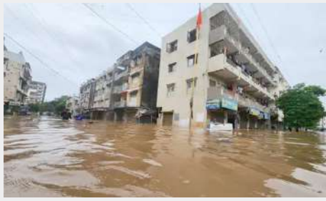
વિસ્તારોમાં કેડથી લઈને ગળાસમા પાણી ભરાયા છે. જેથી હજારો લોકોનું સ્થળાંતર કરવામાં આવ્યું છે.

સહિત અન્ય કેટલાક રસ્તાઓ બંધ કરવાની નોબત આવી છે. સુરત, વડોદરા બાદ હવે નવસારીમાં જળબંબાકાર થયો છે. નવસારી જિલ્લામાં હાલ ધોધમાર વરસાદ તો નથી, પરંતુ ડાંગ સહિતના ઉપરવાસમાં ભારે વરસાદના પગલે નવસારી જિલ્લામાં આફત આવી પહોંચી છે. શહેરમાં આવેલા ભેંસદ ખાડા વિસ્તારમાં પૂર્ણા નદીના પાણી ફળી વળ્યા છે. શહેરના ગધેવાન, મોરલો, જૂની મચ્છી માર્કેટ, કમેલા દરવાજા, રંગુન નગર, મિથિલા નગરી, શાંતાદેવી રોડ સહિતના