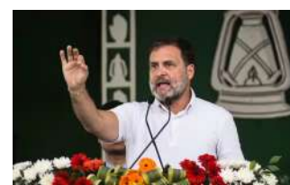
સંભાઈ રહી નથી. રાહુલ ગાંધીએ વધુમાં જણાવ્યું કે છેલ્લા ત્રણ દિવસમાં રિયાસી, કટુઆ અને ડોડામાં ૩ અલગ-અલગ આતંકી ઘટનાઓ બની છે. જોકે આમ છતાં નરેન્દ્ર મોદીને જમ્મુ-કાશ્મીરમાં આતંકવાદી હુમલામાં મૃત્યુ પામેલા અંતે ભાજપની સરકારમાં આતંકી

1 (એજન્સી) જમ્મુ, તા.૧૨ | જમ્મુ-કાશ્મીરમાં સતત થઈ રહેલા આતંકવાદી હુમલાને લઈને કોંગ્રેસ પાર્ટી અને રાહુલ ગાંધીએ વડાપ્રધાન નરેન્દ્ર મોદી પર નિશાન સાંધ્યું છે. રાહુલ ગાંધીએ હુમલાને લઈને સોશિયલ મીડિયા પ્લેટફોર્મ એક્સ પર પોતાનો રોષ વ્યક્ત કર્યો છે. રાહુલ ગાંધીએ એક્સ પર એક પોસ્ટમાં લખ્યું છે કે અભિનંદનના મેસેજોનો જવાબ આપવામાં વ્યસ્ત મોદીને જમ્મુ-કાશ્મીરમાં આતંકવાદી હુમલામાં મૃત્યુ પામેલા શ્રદ્ધાળુઓના પરિવારની ચીસો