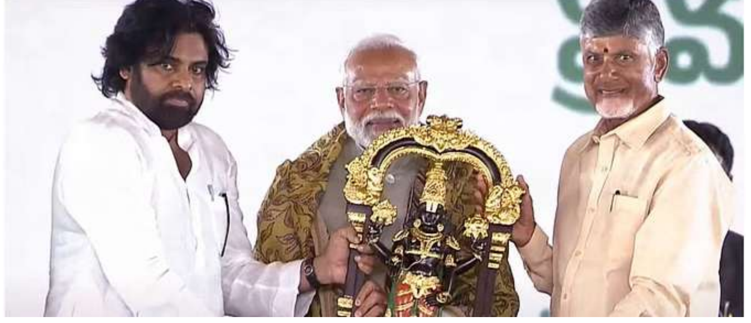
આંધ્ર પ્રદેશના મુખ્યપ્રધાન ચંદ્રબાબુ નાયડુ અને જનસેના પાર્ટીના પ્રધાન પવન કલ્યાણે અમરાવતીમાં શપથ ગ્રહણ સમારોહ દરમિયાન વડાપ્રધાન નરેન્દ્ર મોદીને ભગવાન વેંકટેશ્વરની મૂર્તિ અર્પણ કરી.

અમલમાં આવી ત્યારથી અને ત્યારબાદ GST કાઉન્સિલની રચના થઈ ત્યારથી આ માટેના પ્રયાસો થઈ રહ્યા છે. જીએસટી કાઉન્સિલની લગભગ દરેક બેઠકમાં આ બાબતને આગળ કરવામાં આવી છે. પરંતુ આ અંગે રાજ્યો વચ્ચે હજુ સુધી સહમતિ બની શકી નથી. પેટ્રોલ અને ડીઝલ પરનો વેટ રાજ્ય સરકાર માટે આવકનો મુખ્ય સ્ત્રોત છે. આવી સ્થિતિમાં, રાજ્ય સરકારો પેટ્રોલ અને ડીઝલને જીએસટી હેઠળ આવવાને કારણે તેમની આવકમાં નુકસાનનો સામનો કરવા માંગતી નથી.