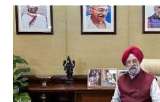
કેન્દ્ર સરકાર પેટ્રોલ, ડીઝલ અને કુદરતી ગેસ જેવી ચીજવસ્તુઓને ગુડ્સ એન્ડ સર્વિસ ટેક્સ (GST)ના દાયરામાં લાવવાનો પ્રયાસ કરશે. તેનાથી સામાન્ય લોકોને મોટી રાહત મળશે. પેટ્રોલ અને ડીઝલ જેવા ઈંધણને GSTના દાયરામાં લાવવાનો આ પ્રયાસ નવો નથી. GST સિસ્ટમ

1 (એજન્સી) નવી દિલ્હી, તા.૧૨ | દેશમાં લોકસભાની ચૂંટણી બાદ વડાપ્રધાન નરેન્દ્ર મોદીના નેતૃત્વમાં નવી એનડીએની સરકાર 'મોદી ૩.૦'ની રચના કરવામાં આવી છે. આ ઉપરાંત ૭ મંત્રીઓમાં મંત્રાલયો પણ વહેંચવામાં આવ્યા છે. હરદીપ સિંઘ પુરીને ફરી એક વખત પેટ્રોલિયમ અને કુદરતી ગેસ મંત્રાલયની જવાબદારી સોંપવામાં આવી છે અને તેમણે કાર્યભાર સંભાળતાની સાથે જ એક મોટી ઘોંસાટ કરી છે. કેન્દ્રીય મંત્રી હરદીપ સિંઘ પુરીનું કહેવું છે કે, આ વખતે