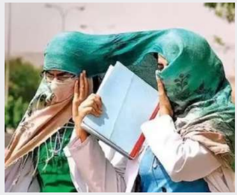
પૂર્વોત્તર ભારતના અન્ય રાજ્યોમાં પણ વરસાદની શક્યતા છે. ગુજરાતમાં સામાન્ય રીતે દર વર્ષે

વાત કરીએ તો ગુજરાતમાં ૪ દિવસ વહેલું ચોમાસું બેસી ગયું છે. આગામી ૩ દિવસ ક્યાં વરસાદ પડશે તે ખાસ જાણો. પૂર્વા પશ્ચિમ બંગાળ, સિક્કિમ, અસમ અને મેઘાલય, પશ્ચિમમાં મહારાષ્ટ્ર, ગોવાના કેટલાક ભાગો, દક્ષિણમાં કર્ણાટક, કેરળ અને તમિલનાડુ તથા પૂર્વ મધ્ય પ્રદેશના અલગ અલગ વિસ્તારોમાં ભારે વરસાદ નોંધાયો છે. દક્ષિણ પશ્ચિમ ચોમાસાના ક્ષેત્રમાં આગળ વધવા અને પૂર્વોત્તર અસર પર ચક્રવાતી હવાઓ ક્ષેત્ર બનવાના કારણે ઝારખંડ, ઓડિશા, બિહાર, છત્તીસગઢ સહિત અન્ય રાજ્યોમાં વરસાદની શક્યતા છે. આગામી સાત દિવસોમાં નાગાલેન્ડ, મણિપુર, મિઝોરમ, ત્રિપુરા સહિત