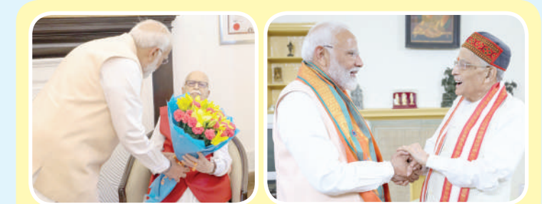
દેશનો NDAમાં અતૂટ વિશ્વાસ છે : નરેન્દ્ર મોદી

દેશને આગળ લઈ જવામાં કોઈ કસર નહીં છોડું. ૧૦ વર્ષ બાદ પણ કોંગ્રેસ ૧૦૦ના આંકડા સુધી નથી પહોંચી. છેલ્લી ત્રણ લોકસભા ચૂંટણીની બધી સીટો ભેગી કરશે તો પણ કોંગ્રેસ અમારી આ વખતની જીત કરતા ઘણી પાછળ રહી જશે. વડાપ્રધાન મોદીએ જણાવ્યુંકે, સરકાર ચલાવવા માટે બહુમત જરૂરી છે. પણ દેશ ચલાવવા માટે સર્વમત હોવો જોઈએ. હું દેશવાસીઓને વિશ્વાસ અપાવું છુંકે, અમે સર્વમતનું ધ્યાન રાખીશું અને દેશને આગળ લઈ જવામાં કોઈ કસર