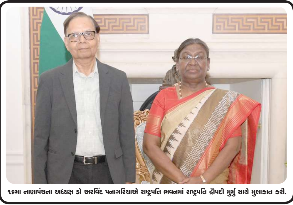
૧૭મા નાણાપંચના અધ્યક્ષ ડો અરવિંદ પનાગરિયાએ રાષ્ટ્રપતિ ભવનમાં રાષ્ટ્રપતિ દ્રોપદી મુરુ સાથે મુલાકાત કરી.