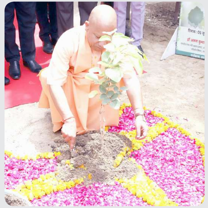
ઉત્તરપ્રદેશના લખનોમાં મુખ્યમંત્રી યોગી આદિત્યનાથ દ્વારા પર્યાવરણ દિવસ નિમિત્તે એક વૃક્ષ વાવીને વૃક્ષારોપણ કરવામાં આવ્યું હતું.