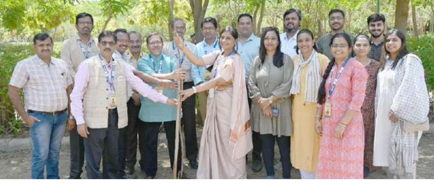
અમદાવાદ, તા.૫ |

સમગ્ર વિશ્વમાં દર વર્ષે ૫ જૂને પર્યાવરણ દિવસની ઉજવણી કરવામાં આવે છે. ત્યારે ગુજરાત સાયન્સ સિટી ખાતે ગુજરાત એન્વાયર્નમેન્ટ મેનેજમેન્ટ ઈન્સ્ટિટ્યૂટ (GEMI) અને અમદાવાદ મ્યુનિસિપલ કોર્પોરેશનના સહયોગથી વિશ્વ પર્યાવરણ દિવસની ભવ્ય ઉજવણી કરવામાં આવી. જેમાં ૭૦થી વધુ વિદ્યાર્થીઓ સહિત ઘણા પર્યાવરણ પ્રેમીઓએ ભાગ લીધો હતો.