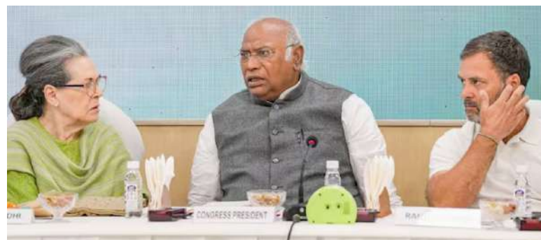
પ્રયત્નોમાં ઘણું બધું ગુમાવ્યું. દિગ્ગજ નેતાઓ ગુસ્સે થઈને ચાલ્યા ગયા. પરંતુ પાર્ટીએ તેના મિશનમાં કોઈ ફેરફાર કર્યો નથી. દરમિયાન ભારત જોડો યાત્રા અને ભારત જોડો ન્યાય યાત્રા પણ કાઢવામાં આવી હતી. આનાથી એ સંદેશ પણ મળ્યો કે પાર્ટી ગ્રાઉન્ડ કનેક્ટમાં માને છે.

ઉભરી આવી છે અને તેણે જે ચમત્કાર બતાવ્યો છે તે સાબિત કરે છે કે કોંગ્રેસ માત્ર પરિણામો બદલવા માટે સક્ષમ નથી, પરંતુ વિપક્ષો, ખાસ કરીને પ્રાદેશિક પક્ષોમાં પણ તે સર્વવ્યાપી રીતે સ્વીકૃત છે. આ વખતે કોંગ્રેસે ચૂંટણીમાં અલગ રણનીતિ અપનાવી અને સૌથી પહેલા ભાજપનો મુકાબલો કરવા માટે વિપક્ષી દળોને એકત્ર કર્યાં. આ કામ પણ અનેક રીતે મહત્વનું હતું. રાજ્યોમાં મજબૂત પ્રાદેશિક પક્ષોએ તેમના અલગ મુદ્દાઓ અને વિચારધારાઓથી આગળ હાથ મિલાવ્યા. તેમની સાથે સીટ વહેંચણીની સમસ્યાને ઉકેલવા માટે ઘણી જહેમત ઉઠાવી હતી. પોતે મયાદિત છે અને પ્રાદેશિક પક્ષોને વધુ બેઠકો પર ચૂંટણી લડવાની તક આપી છે. આ બધા