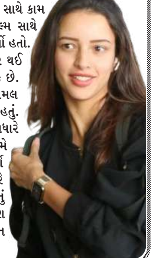
તૃપ્તિ ડીમરીની સાથે રાજકુમાર રાવનો આયોજન છે.

લીડ રોલ છે. તેઓ પહેલી વાર સાથે કામ કરી રહ્યા છે. બંને સ્ટાર્સ ફિલ્મ સાથે સંકળાયેલો એક વીડિયો શેર કર્યો હતો. ફિલ્મની રિલીઝ 3૯ હજુ જાહેર થઈ નથી, પરંતુ તે કોમેડી હોઈ શકે છે. 'એનિમલ'ના એન્ડમાં 'એનિમલ પાર્ક'નું એલાન થઈ ગયું હતું. સીકવલમાં તૃપ્તિ ડીમરીનો રોલ વધારે લાંબો થઈ શકે છે. પહેલી ફિલ્મ ૩.૮૦૦ કરોડનો બિઝનેસ કર્યો હતો, જ્યારે તેની સીકવલ વધારે મોટ બજેટ સાથે બનાવવાનું આયોજન છે. કેજબેક સ્ટાર યશ સાથે તૃપ્તિએ એક ફિલ્મ સાઈન કરી છે.