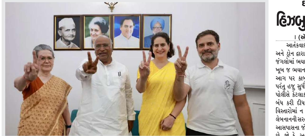
નવી દિલ્લીમાં પાર્ટીના મુખ્યાલય ખાતે કોંગ્રેસ અધ્યક્ષ મલ્લિકાર્જુન ખડગે પાર્ટીના નેતાઓ સોનિયા ગાંધી, પ્રિયંકા ગાંધી અને રાહુલ ગાંધી સાથે લોકસભા ચૂંટણીની મતગણતરી વચ્ચે વિજયના સંકેતો દર્શાવે છે.