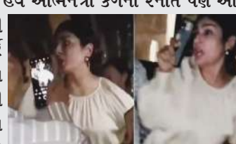
રવિના પંડે અને તેના ડ્રાઈવર પર મારપીટનો આરોપ લગાવ્યો હતો.

બોલિવૂડ એક્ટ્રેસ રવિના ટંડન પર મારપીટનો મામલો ઘણી ચર્ચામાં છે. દરેક વ્યક્તિ પોતપોતાનો અભિપ્રાય બનાવે છે. જોકે, સીસીટીવી ફૂટેજમાં પુલાસો થયો છે કે આમાં રવિનાની ભૂલ નથી. આમ છતાં અનેક પ્રકારની વાતો કરવામાં આવી રહી છે. હવે અભિનેત્રી કંગના રનોત પણ આ મામલે આગળ આવી છે અને રવિનાને સપોર્ટ કર્યો છે. કંગનાએ આ ઘટનાને લિંચિંગ ગણાવી છે અને તેની સખત નિંદા કરી છે. એક્ટ્રેસે કાર્યવાહી કરવાની પણ માંગ કરી છે. કંગનાએ તેની ઈન્સ્ટાગ્રામ સ્ટોરી અપડેટ કરી અને રવિના સાથેના હુમલાના કેસ પર પોતાનો અભિપ્રાય શેર કર્યો. કંગનાએ લખ્યું- રવિના ટંડન સાથે જે પણ થયું તે ચિંતાજનક છે. જો વિરોધી જૂથમાં ૫-૬ વધુ લોકો હોત તો તે લિંચિંગનો શિકાર બની હોત. અમે રોડ રેજ જેવી ઘટનાઓની નિંદા કરીએ છીએ. તે લોકોને સજા થવી જોઈએ અને આવા હિંસક અને ઝેરી વર્તનથી દૂર જવા દેવા જોઈએ નહીં. વાસ્તવમાં કેટલાક લોકોએ રવિના અને તેના ડ્રાઈવર પર મારપીટનો આરોપ લગાવ્યો હતો. એવું કહેવાય છે કે ડ્રાઈવર બેદરકારીથી વાહન ચલાવી રહ્યો હતો, જેના કારણે તેણે કાર્ટર રોડ પર ત્રણ લોકોને ટક્કર મારી હતી. આ પછી, જ્યારે રવિના સાથે વાત કરવાનો પ્રયાસ કરવામાં આવ્યો, ત્યારે તે નશામાં જોવા મળી હતી, અને અભિનેત્રીએ તેમની સાથે ખરાબ વર્તન કર્યું હતું. જ્યારે પોલીસ અને સીસીટીવી ફૂટેજ મુજબ સત્ય કંઈક બીજું જ બહાર આવ્યું છે. રિપોર્ટમાં કહેવામાં આવ્યું છે કે રવિનાની કાર કોઈને સ્પર્શી નથી. હકીકતમાં, કથિત પીડિતોમાં હાજર એક મહિલાએ બળજબરીથી બિલ્ડિંગમાં ઘૂસવાનો પ્રયાસ કર્યો હતો.