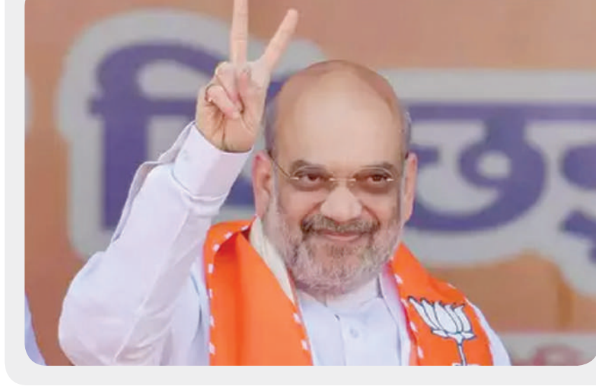
। (એજન્સી) ગાંધીનગર, તા.૪ । ગુજરાતની ગાંધીનગર બેઠક ૩૫ વર્ષથી ભાજપ પાસે છે. અમિત શાહ પહેલા આ સીટ ભાજપના વરિષ્ઠ નેતા લાલકૃષ્ણ અડવાણીની હતી. આ બેઠક ભાજપની ખૂબ જ સુરક્ષિત બેઠક માનવામાં આવે છે. અડવાણી આ સીટ પરથી ૬ વખત ચૂંટણી જીત્યા છે. આ પછી ૨૦૧૯માં ભાજપે આ સીટ પરથી અમિત શાહને મેદાનમાં ઉતાર્યા હતા. અમિત શાહ બીજી વખત અહીંથી ચૂંટણી લડી હતી. આ વખતે લોકસભા ચૂંટણીમાં કેન્દ્રીય ગૃહમંત્રી અમિત શાહનું મુકાબલો કોંગ્રેસની સોનલ પટેલ સાથે થયો હતો. અંતે અમિત શાહે મોટી જીત મેળવી છે. કેન્દ્રીય ગૃહ અને સહકાર પ્રધાન અમિત શાહ જાહેર જીવનમાં ૪૦ વર્ષથી સક્રીય છે.

અમિત શાહે પોલીંગ બુથ એજન્ટથી લઈ ભારતીય જનતા પાર્ટીના રાષ્ટ્રીય અધ્યક્ષ સુધીની જવાબદારી નિભાવી છે. જુલાઈ ૨૦૧૪ માં ભાજપના રાષ્ટ્રીય અધ્યક્ષ પદની જવાબદારી અમિત શાહને સોંપાઈ હતી. ૨૦૨૦ સુધી તેઓએ રાષ્ટ્રીય અધ્યક્ષ રહ્યા હતા. ૧૯૮૨માં એબીવીપી ગુજરાતના સહમંત્રી બન્યા હતા. ૧૯૮૪માં અમદાવાદના નારાણપુરામાં પોલીંગ બુથની જવાબદારી નિભાવવાથી રાજકારણમાં આગળ વધવાની શરૂઆત કરી હતી. ૧૯૮૦માં તેઓ આરએસએસમાં જોડાયા હતા. વર્ષ ૧૯૯૭માં સરખેજ બેઠક પરથી વિધાનસભાની ચૂંટણી લડી ધારાસભ્ય બન્યા હતા. ૨૦૧૯માં ગાંધીનગર બેઠક પરથી લોકસભાની ચૂંટણી લડીને સાંસદ તરીકે ચૂંટાયા હતા. વર્ષ ૨૦૦૨ થી ૨૦૧૦ સુધી ગુજરાતના ગૃહ રાજ્યપ્રધાન રહ્યા હતા. ગુજરાત ક્રિકેટ એસોસિએશનના પ્રમુખ પદે પણ અમિત શાહ રહી ચુક્યા છે. તમને જણાવી દઈએ કે, લોકસભા ચૂંટણીના પરિણામો આજે જાહેર થઈ રહ્યા છે. સવારે ૮ વાગ્યાથી મતગણતરી શરૂ થઈ ચુકી છે. દેશમાં સાત તબક્કામાં ચૂંટણી યોજાઈ હતી. પ્રથમ તબક્કા માટે ૧૯ એપ્રિલે મતદાન થયું હતું. ૧ જૂનના રોજ છેલ્લા તબક્કાનું મતદાન થયું હતું. આ વખતે ચૂંટણીમાં મુકાબલો ભાજપની આગેવાની હેઠળના ગઠબંધન એનડીએ અને ૨૫થી વધુ પક્ષોના ગઠબંધન ભારત વચ્ચે છે.