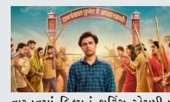
આ ગામનું ચોક્કસ સ્થાન હજુ સુધી મળ્યું નહીં કારણ કે વાસ્તવમાં ફિલ્મનું શૂટિંગ એમપીના સિહોર જિલ્લાના મહોડિયા ગામ પંચાયતમાં થયું હોવાનું બહાર આવ્યું હતું. પંચાયત 3 વેબ સિરીઝની તમામ સિઝન આ ગામમાં જ શૂટ કરવામાં આવી છે. ઘણી તપાસ પછી જાણવા યુપીના બલિયા જિલ્લામાં છે. યુપીના આ ગામનું લોકેશન સર્ચ કરીને યુઝર્સ સાથે નહીં પરંતુ મધ્યપ્રદેશ સાથે સિહોર સાથે કનેક્શન છે, યુઝર્સ

તેના લોકેશનને લઈને સર્ચ કરી રહ્યા છે. મહત્વનું છે કે પંચાયતની નવી સીઝન લોકોને ખુબ પસંદ આવી રહી છે. એમપીના સિહોર જિલ્લાની મહોડિયા ગામ પંચાયત કે જ્યાં આ સિરીઝનું શૂટિંગ થયું હતું તે રાતોરાત ટોક ઓફ ધ ટાઉન બની ગયું છે. લોકો આ ગામ વિશે ઘણી ચર્ચા કરી રહ્યા છે. આસપાસના લોકો તેને ફૂલેરાના નામથી બોલાવવા લાગ્યા છે. ફિલ્મ યુનિટને આ લોકેશન ખૂબ જ પસંદ છે. કહેવાય છે કે આ ગામના લોકો ખૂબ માયાળુ છે. શૂટિંગ દરમિયાન ટીમને કોઈ સમસ્યાનો સામનો કરવો પડ્યો નથી.