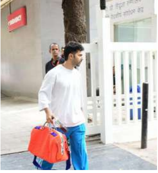
આ દરમિયાન, અભિનેતાએ તેના હાથમાં લાલ રંગની બેગ પકડી હતી અને તે ખૂબ જ થાકેલા દેખાતા હતા. વરુણ હિન્દુજા હોસ્પિટલની બહાર આવ્યા અને ત્યાંથી સીધા જ કારમાં

વરુણ ધવન અને નતાશા દલાલ હિન્દી ફિલ્મ ઈન્ડસ્ટ્રીના લોકપ્રિય કપલમાંથી એક છે. બંનેએ વર્ષ 2021માં પોતાની લવ સ્ટોરી લગ્નના બંધનમાં બંધાઈ હતી. લગ્નના ત્રણ વર્ષ બાદ આ કપલના ઘરે ટૂંક સમયમાં એક નાનકડા મહેમાનનું આગમન થવાનું છે, જેને લઈને માત્ર ધવન પરિવાર જ નહીં પરંતુ ફેન્સ પણ ખૂબ જ ઉત્સાહિત છે. દરમિયાન, અભિનેતાના એક વીડિયોએ ચાહકોની ઉત્તેજના વધુ વધારી દીધી છે. ખરેખર, વરુણ તાજેતરમાં જ હિન્દુજા હોસ્પિટલની બહાર જોવા મળ્યો હતો.