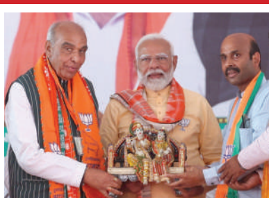
વિરુદ્ધ છે. સપા સરકારના શાસનમાં યુપીમાં

! (એજન્સી) બસ્તી, તા.૨૨ | લોકસભા ચૂંટણીને લઈ વડાપ્રધાન મોદીએ ઉત્તર પ્રદેશના બસ્તીમાં જાહેરસભા સંબોધી હતી. આજે બસ્તીમાં જનસભાને સંબોધિત કરતા વડાપ્રધાન નરેન્દ્ર મોદીએ ફરી એકવાર વિપક્ષી પાર્ટીઓના ગઠબંધન પર આકરા પ્રહારો કર્યા હતા. વડાપ્રધાન મોદીએ કહ્યું કે, આજે જ કોંગ્રેસી નેતાઓ બંધારણ બચાવવાના નારા લગાવી રહ્યા છે તેઓને ખબર નથી કે કોંગ્રેસે જ ઈમરજન્સી લાદીને બંધારણનો નાશ કર્યો હતો. વડાપ્રધાન મોદીએ કહ્યું કે, તેમની વચ્ચે ઘણા એવા નેતાઓ છે જેમણે કોંગ્રેસના બંધારણને પણ સ્વીકાર્યું નથી. ઉત્તર પ્રદેશના બસ્તીમાં જાહેરસભા સંબોધતાં વડાપ્રધાન મોદીએ સમાજવાદી પાર્ટીને દલિત વિરોધી ગણાવીને તેના પર નિશાન સાધ્યું અને કહ્યું કે, સપાના લોકો દલિતો માટે અનામતની