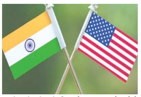
આ ટીપ્પણી કરી હતી. મિલરને સવાલ કરાયો હતો કે "શું તમે આ મુદ્દાઓમાં ભારતીય અધિકારીઓ સાથે વિચારવિમર્શ કરી છો?" ન્યૂ યોર્ક ટાઈમ્સના આ અહેવાલમાં આક્ષેપ કરાયો હતો કે ભારતમાં વિશ્વનો

! (એજન્સી) નવી દિલ્હી, તા.૨૨ | મોદીના ભારતમાં મુસ્લિમો ભય અને અનિશ્ચિતતા વચ્ચે જીવી રહ્યો હોવાનો આક્ષેપ કરતાં ન્યૂ યોર્ક ટાઈમ્સના એક રીપોર્ટ અંગેના સવાલના જવાબમાં અમેરિકાએ જણાવ્યું હતું તે ભારત સહિત વિશ્વના ઘણા દેશો સાથે તમામ ધર્મના લોકો માટે સમાન વ્યવહારના મહત્વ અંગે વિચારવિમર્શ કરી રહ્યું છે. બાઈડન સરકાર ધાર્મિક સ્વતંત્રતાના અધિકાર માટે સાંવત્રિક સન્માનને પ્રોત્સાહન આપવા અને તેનું રક્ષણ કરવા માટે પ્રતિબદ્ધ છે. 'રટેન્જર્સ ઈન ધેર ઓન લેન્ડઃ બીઈંગ મુસ્લિમ ઈન મોદીના ઈન્ડિયા' શીર્ષક હેઠળના આ રીપોર્ટ અંગેના સવાલના જવાબમાં અમેરિકાના વિદેશ વિભાગના પ્રવક્તા મેથ્યૂ મિલરે સોમવારે ડેઈલી ન્યૂઝ કોન્ફરન્સમાં