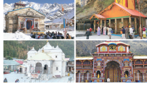
અપલોડ કરવાનો રહેશે. રતુરીએ આરોગ્ય અને પર્યટન

છે. ઉત્તરાખંડના મુખ્ય સચિવ રાધા રતુરીએ દેહરાદૂનમાં જણાવ્યું હતું કે આરોગ્ય વિભાગ વિવિધ સ્થળોએ ચારધામ યાત્રા પર આવતા શ્રદ્ધાળુઓની આરોગ્ય તપાસ કરશે. તેમણે કહ્યું કે ખાસ કરીને ૫૦ વર્ષથી વધુ ઉંમરના મુસાફરો માટે આરોગ્યની તપાસ ફરજિયાત પણે કરવામાં આવશે, રતુરીએ કહ્યું કે શ્રદ્ધાળુઓને શ્રેષ્ઠ સ્વાસ્થ્ય સુવિધાઓ પૂરી પાડવા માટે, આરોગ્ય વિભાગ, 'વિશ ફાઉન્ડેશન' અને હંસ ફાઉન્ડેશને 'ઈ-સ્વસ્થ્ય ધામ' એપ લોન્ચ કરી છે જેના પર તેઓએ તેમનો સ્વાસ્થ્ય ડેટા