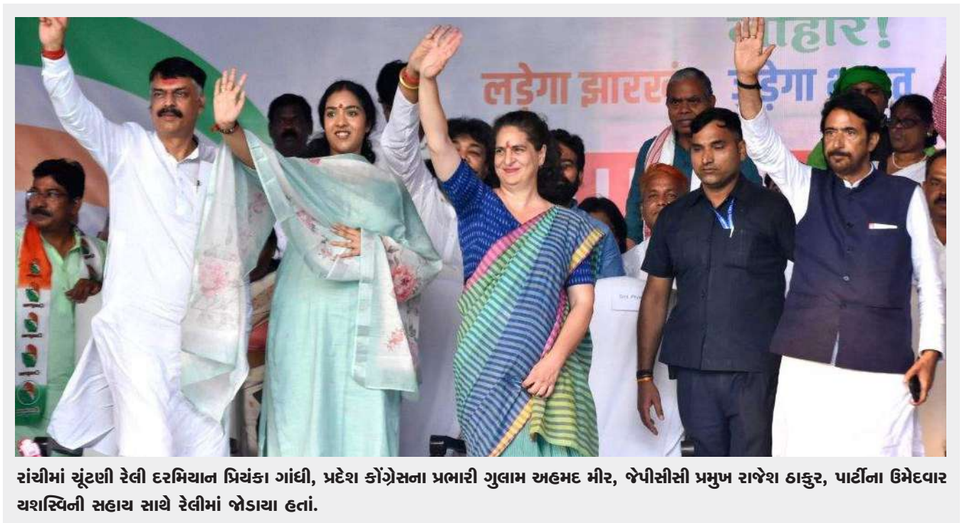
રાંચીમાં ચૂંટણી રેલી દરમિયાન પ્રિયંકા ગાંધી, પ્રદેશ કોંગ્રેસના પ્રભારી ગુલામ અહમદ મીર, જેપીસીસી પ્રમુખ રાજેશ ઠાકુર, પાર્ટીના ઉમેદવાર યશસ્વિની સહાય સાથે રેલીમાં જોડાયા હતાં.

સોશિયલ મીડિયાને જવાબદાર ઠેરવતા સત્યરાજે કહ્યું, ‘અગાઉના અખબારોમાં આવી વાર્તાઓ લાવતા - ‘યુવતીની હત્યા... શું આની પાછળ કોઈ ગેરકાયદેસર સંબંધ છે?’ તેવી જ રીતે, સોશિયલ મીડિયા હવે પાયાવિહોણી અફવાઓનું સ્થાન બની ગયું છે. સત્યરાજ એક ખુલ્લા પેરિયારીસ્ટ છે, અને તેણે ઘણી વખત ઘવો કહ્યો છે કે તે પેરિયાર વિરોધી વિચારધારા ધરાવતી કોઈપણ ફિલ્મમાં કામ કરશે નહીં. રાજકીય રીતે, પેરિયારિઝમની વિચારધારા અને પીએમ મોદીની પાર્ટી ભાજપ સંપૂર્ણપણે વિરોધી ધ્રુવ પર હોય તેવું લાગે છે. તેથી જ જનતાને એટલો આઘાત લાગ્યો કે સત્યરાજ વડાપ્રધાન નરેન્દ્ર મોદીની ભૂમિકા ભજવવા કેવી રીતે સંમત થયા !!! સત્યરાજની વાત કરીએ તો તે તેની આગામી ફિલ્મ ‘વેપન’ની રાહ જોઈ રહ્યો છે. આ ફિલ્મમાં તે એક સુપરહીરોના રોલ કરી રહ્યો છે. રાજીવ મેનન અને વસંત રવિ સાથે સત્યરાજ અભિનિત આ ફિલ્મના ટ્રેલરે લોકોને ખૂબ જ ઉત્સાહિત કરી દીધા હતા. વેપન ૨૩ મેના રોજ સિનેમાઘરોમાં રિલીઝ થશે.