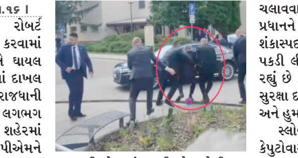
પણ કરી લેવામાં આવી છે. ગોળીબાર બાદ સ્થળ પર હોબાળો મચી ગયો હતો, સામે આવેલા વીડિયોમાં સુરક્ષા દળો આરોપીને કસ્ટડીમાં લેતા અને વડાપ્રધાન ફિકોને કારમાં લઈ જતા જોઈ શકાય છે.

। (એજન્સી) ટ્રાન્સિસ્લાવા, તા. ૧૬ । સ્લોવાકિયાના વડાપ્રધાન રોબર્ટ ફિકો પર ગોળી મારીને હુમલો કરવામાં આવ્યો છે, તેઓ ગંભીર રીતે ઘાયલ થયા છે અને તેમને હોસ્પિટલમાં દાખલ કરવામાં આવ્યા છે. આ ઘટના રાજધાની ટ્રાન્સિસ્લાવાના ઉત્તર-પૂર્વમાં લગભગ ૧૫૦ કિલોમીટર દૂર હેન્ડલોવા શહેરમાં બની હતી. અકસ્માત બાદ પીએમને સ્થાનિક હોસ્પિટલમાં લઈ જવામાં આવ્યા હતા, જ્યાંથી હવે તેમને રાજધાની ટ્રાન્સિસ્લાવાની હોસ્પિટલમાં લઈ જવામાં આવ્યા છે. તેમની હાલત ગંભીર હોવાનું કહેવાય છે.