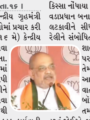
કિસ્સા નોંધાયા હતા. તમે મોદીજીને ત્રીજી વખત વડાપ્રધાન બનાવો, ગૌહત્યા કરનારાઓને ઊંધા લટકાવીને સીધા કરવાનું કામ અમે કરીશું. રેલીને સંબોધિત કરતી વખતે ગૃહમંત્રી અમિત શાહે વિપક્ષી ઈન્ડિયા ગઠબંધન પર પણ આકાર પ્રહારો કર્યા હતા. તેમણે કહ્યું, "ઈન્ડિયા ગઠબંધનના આ લોકો આજે કહે છે કે પીઓકેની વાત ના કરો, પાકિસ્તાન પાસે એટમ બોમ્બ છે. હું તેમને કહેવા માંગુ છું કે તમારે પાકિસ્તાનના એટમ બોમ્બથી

। (એજન્સી) મધુબની, તા. ૧૬ । લોકસભા ચૂંટણી વચ્ચે કેન્દ્રીય ગૃહમંત્રી અમિત શાહ દેશના વિવિધ ભાગોમાં પ્રચાર કરી રહ્યા છે. દરમિયાન ગુરુવારે (૧૬ મે) કેન્દ્રીય ગૃહમંત્રી એક રેલીને સંબોધવા બિહારના મધુબની પહોંચ્યા હતા. આ દરમિયાન તેમણે ગૌહત્યામાં સામેલ લોકોને કડક ચેતવણી આપી હતી. તેમણે જનતાને નરેન્દ્ર મોદીને ત્રીજી વખત વડાપ્રધાન બનાવવા માટે પણ અપીલ કરી હતી જેથી ગૌહત્યામાં સામેલ લોકો સામે કડક કાર્યવાહી કરવામાં આવે. બિહારના મધુબનીમાં જનતાને સંબોધતા કેન્દ્રીય ગૃહમંત્રી અમિત શાહે કહ્યું, "પહેલાં આ વિસ્તારમાં મોટા પાયે ગૌહત્યાના