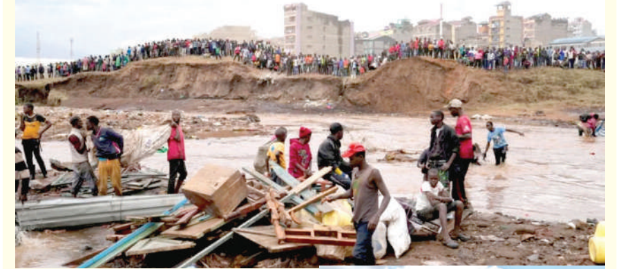
। (એનસી) નવી દિલ્હી, તા.૧૫ ।

ભારત દ્વારા જારી કરાયેલા નિવેદનમાં કહેવામાં આવ્યું છે કે કેન્યાને આપવામાં આવતી સહાય એ દક્ષિણ સહયોગની ભાવના અને આફ્રિકાને અમારી પ્રાથમિકતાઓમાં ટોચ પર રાખવાની અમારી પ્રતિબદ્ધતા સાથે દેશ સાથેના મજબૂત અને મૈત્રીપૂર્ણ સંબંધોનું પુનરોચ્ચાર છે. ભારતે પૂરને કારણે થયેલા નુકસાન અને વિનાશ માટે કેન્યાની સરકાર અને લોકો પ્રત્યે ઊંડી સંવેદના વ્યક્ત કરી છે. કેન્યામાં પૂરના કારણે તબાહી સર્જાઈ છે. આફ્રિકન દેશના ૪૭ ક્રાઉન્ટીઓમાંથી ૩૮ પ્રભાવિત થયા છે.