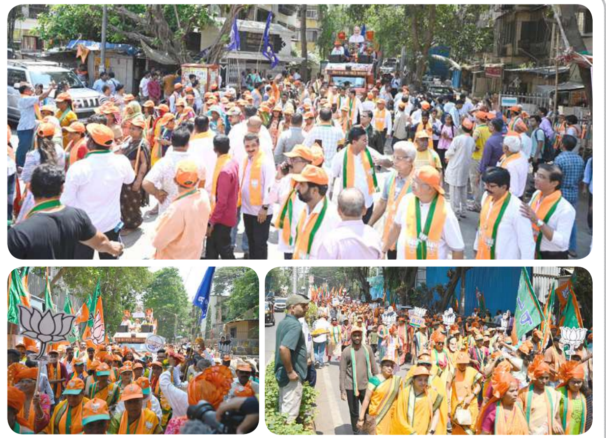
કેન્દ્રીય મંત્રી અને ઉત્તર મુંબઈ બેઠક પરથી ભાજપના ઉમેદવાર પીયુષ ગોયલ મુંબઈમાં લોકસભા ચૂંટણી માટે રોડ શો કર્યો હતો. રોડ શો દરમિયાન મોટી સંખ્યામાં લોકો ઉપસ્થિત રહ્યા હતાં.