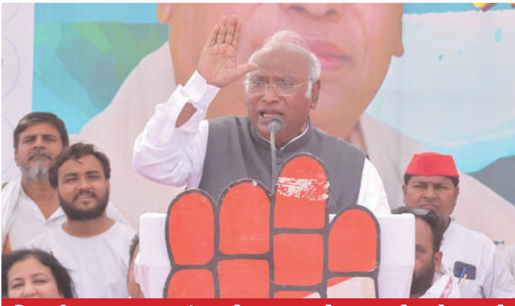
વિપક્ષી INDIA ગઠબંધનને આ વખતે ૩૫૦ બેઠકો મળશે

। (એનસી) નવી દિલ્હી, તા.૧૫ । લોકસભા ચૂંટણી પાંચમાં તબક્કાના મતદાનની તૈયારીઓ વચ્ચે કોંગ્રેસ પ્રમુખ મલ્લિકાર્જુન ખડગેનું મોટું નિવેદન સામે આવ્યું છે. વાત જાણે એમ છે કે, કોંગ્રેસના પ્રમુખ મલ્લિકાર્જુન ખડગેએ બુધવારે લખનૌમાં જણાવ્યું હતું કે, ચાર તબક્કાની લોકસભા ચૂંટણી પછી INDIA ગઠબંધન મજબૂત સ્થિતિમાં છે. જનતાએ વડાપ્રધાન નરેન્દ્ર મોદીને વિદાય આપવાનો નિર્ણય કર્યો છે. તેમણે કહ્યું કે, INDIA ગઠબંધન ૪ જૂને નવી સરકાર બનાવી રહી છે. યુપીની રાજધાનીમાં સમાજવાદી પાર્ટીના વડા અખિલેશ યાદવ સાથે સંયુક્ત પ્રેસ કોન્ફરન્સ કરતી વખતે કોંગ્રેસ અધ્યક્ષે આ ટિપ્પણી કરી હતી. INDIA ગઠબંધન સરકાર બનાવવાનો દાવો કરતા મલ્લિકાર્જુન ખડગેએ કહ્યું, ચૂંટણીના ચાર તબક્કા પૂર્ણ થઈ ગયા છે. INDIA ગઠબંધન મજબૂત સ્થિતિમાં છે. જનતાએ PM મોદીને વિદાય આપવાનો નિર્ણય કર્યો છે. સમગ્ર દેશના વાતાવરણને જોઈને અમે કહી શકીએ છીએ કે, INDIA ગઠબંધન ૪ જૂને નવી સરકાર બનાવી રહ્યું છે. તેમણે કહ્યું, ૨૦૨૪ની ચૂંટણી સૌથી મહત્વપૂર્ણ ચૂંટણી છે. આ લોકશાહી અને બંધારણને બચાવવાની ચૂંટણી છે. આ વિચારધારાની ચૂંટણી છે. એક તરફ ગરીબોના પક્ષમાં લડી રહેલા પક્ષો એક થઈને લડી રહ્યા છે. બીજા તરફ હાથ જેઓ અમીરો સાથે રહીને અંધશ્રદ્ધા માટે લડી રહ્યા છે તેઓ સાથે મળીને લડી રહ્યા છે. કોંગ્રેસ અધ્યક્ષે કહ્યું, અમારી લડાઈ ગરીબો વતી છે. જેમને