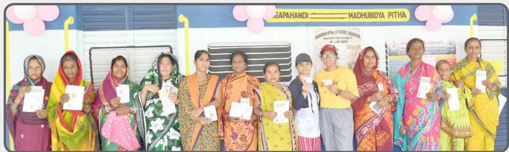
ઓડિશાના બેરહામપુરમાં એડમેલએન મોડલ સ્કૂલ મધુ વિદ્યાપીઠા પ્રાથમિક શાળા દિગપહાંડી ગંજમ જિલ્લામાં લોકસભાની ચૂંટણી દરમિયાન મતદાન મથક પર મતદાન કરવા માટે લાઈનમાં પોતાના ઓળખ કાર્ડ લઈને ઊભા રહેલા મતદારો.