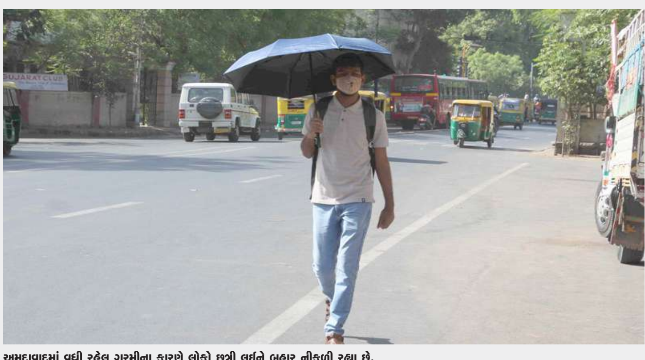
અમદાવાદમાં વધી રહેલ ગરમીના કારણે લોકો છત્રી લઈને બહાર નીકળી રહ્યા છે.

। (એજન્સી) વડોદરા, તા.૧૩ । ઓનલાઈન ગેમ રમવાના ટ્રેન્ડમાં લોકોને તેની એટલી બધી આદત પડી જાય છે કે તેની ખોટી અસર તેમના જીવન પર થવા લાગે છે. નાના બાળકો, યુવાનો થી લઈને તમામ ઉંમરના લોકોને પણ ઓનલાઈન ગેમનું ભારે વળગણ હાલ જોવા મળે છે પરંતુ ઓનલાઈન ગેમ રમવાનો આ યસકો ક્યારેક જીવલેણ સાબિત થઈ શકે છે તેવો જ એક બનાવ વડોદરામાં બન્યો છે જેમાં એક ૨૮ વર્ષીય યુવાને ઓનલાઈન ગેમના રવાડે ચડીને રૂપિયા હારી જતા આપઘાત કર્યો છે. આ મામલે પોલીસે મૃતકનો ફોન અનલોક કરવાની કામગીરી હાથ ધરીને આગળની તપાસ હાથ ધરી છે. આ એક આઘાતજનક ઘટના છે યુવાનના પરિવાર માટે, વડોદરાના એલેમ્પિક રોડ એક. સી.આઈ.ગોડાઉનની બાજુમાં એક કોમ્પલેક્સમાં ૨૮ વર્ષનો યુવાન રહેતો હતો અને મજૂરી કામ કરતો હતો. તે પોતાની માતા સાથે રહેતો હતો જ્યારે તેના પિતાનું અવસાન થયું છે. આ યુવાને ઓનલાઈન ગેમ રમવાનો ખૂબ યસકો લાગ્યો હતો, તેની પાસે નવો ફોન ખરીદવાના પૈસા ન હોવાથી જૂનો મોબાઈલ ફોન રિપેર કરાવ્યો હતો.