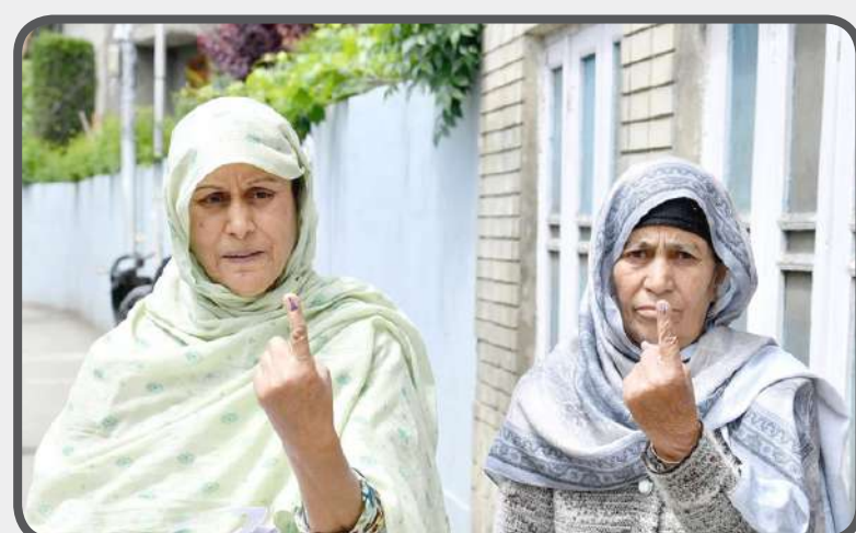
શ્રીનગર, જમ્મુ અને કાશ્મીરમાં વોલ્ડન સ્કૂલ, નાટીપોરા ખાતે લોકસભાની ચૂંટણી દરમિયાન પોતાના મતદાન કર્યા પછી અવિશ્વસનીય શાહીનું ચિહ્ન દર્શાવતી સ્ત્રી મતદારો.