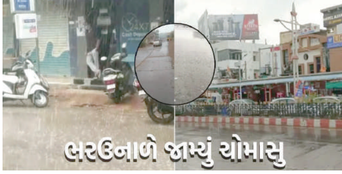
હરઉનાળે જામ્યું ચોમાસુ

સહિતના વિસ્તારોમાં વરસાદ પડ્યો છે. તો ગાંધીનગરમાં પણ વરસાદી માહોલ છવાયો છે. અમદાવાદમાં સાંજે ૪ વાગ્યા પછી વાતાવરણમાં અચાનક પવનો આવ્યો હતો. વાતાવરણમાં ઠંડક પ્રસરતા દિવસભર કાળઝાળ ગરમીથી ત્રસ્ત શહેરીજનોએ રાહત અનુભવી હતી. શહેરના રાણીપ, ઘાટલોડિયા, નારણપુરા, ગોતા, એસજી હાઈવે, સાયન્સ સિટી, શાહીબાગ, ગોતા, ચાંદખેડા, ઝુંડાલ સહિતના વિસ્તારોમાં વિસ્તારોમાં તેજ પવન ફૂંકાતા આંધી જેવો માહોલ સર્જાયો હતો. ભારે