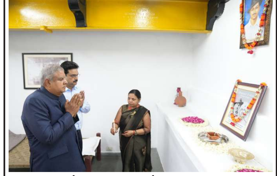
દિલ્હીમાં દિલ્હી યુનિવર્સિટીની સ્કૂલ ઓફ ઓપન લર્નિંગ (SOL)ના ૬૨મા સ્થાપના દિવસ સમારોહ દરમિયાન વાઈસ પ્રેસિડેન્ટ શ્રી જગદીપ ઘનખરે વિદ્યાર્થીઓ અને ફેકલ્ટી સભ્યોને સંગોઠિત કરીને દીપ પ્રગટાવ્યો.