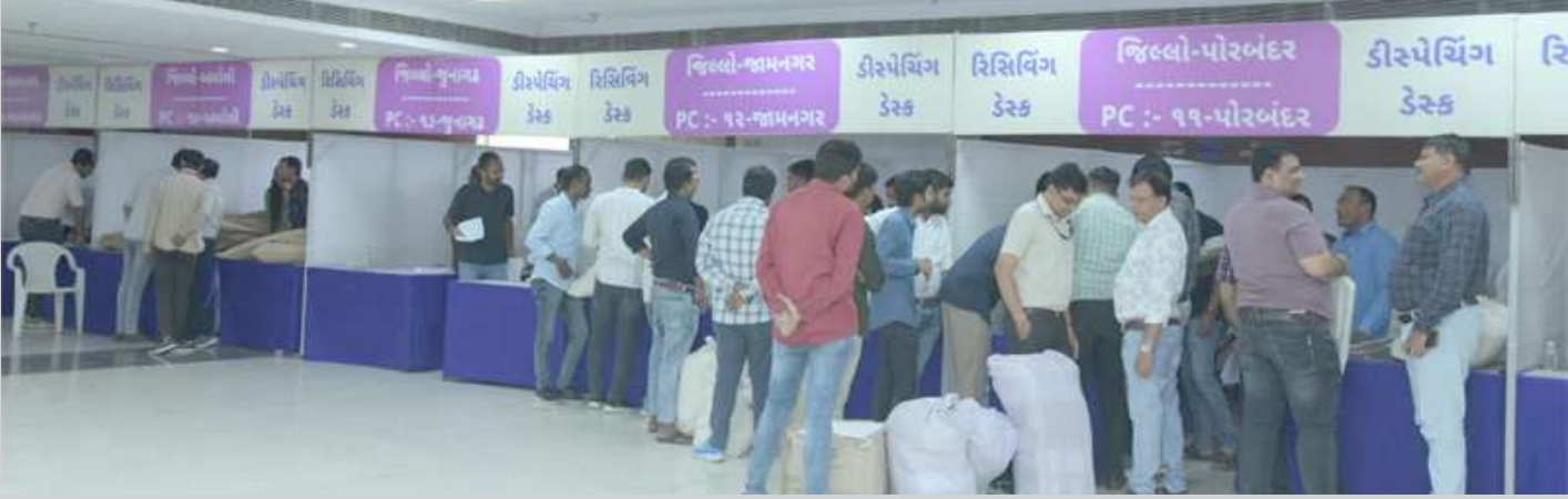
આ એક્સચેન્જ મેળામાં રાજ્યના સંયુક્ત મુખ્ય નિર્વાચન અધિકારી શ્રી એ. બી. પટેલે ઉપસ્થિત રહી કામગીરીનું નિરીક્ષણ કર્યું હતું અને જરૂરી માર્ગદર્શન પુરું પાડ્યું હતું. આ પ્રસંગે તેમણે જણાવ્યું હતું કે, ભારતના ચૂંટણી પંચની નવી ગાઈડલાઈન અનુસાર લોકસભા સામાન્ય ચૂંટણી-૨૦૨૪ની પ્રક્રિયામાં ફરજ પર નિયુક્ત કરવામાં આવેલા અધિકારીઓ અને કર્મચારીશ્રીઓ પોસ્ટલ બેલેટ પેપર મારફત પોતાના ફરજના સ્થળ પરથી મતદાન કરી શકે તે માટેની સુચારુ વ્યવસ્થા કરવામાં આવી છે. તેમણે ઉમેર્યું કે, લોકસભા સામાન્ય ચૂંટણી-૨૦૨૪ અન્વયે યોજાયેલા રાજ્યકક્ષાના દ્વિતીય એક્સચેન્જ મેળાની કામગીરીમાં દરેક જિલ્લાના અધિકારીઓ તેમજ કર્મચારીઓએ સારો સહયોગ આપ્યો છે અને આ પ્રકારની વ્યવસ્થાથી ચૂંટણી ફરજમાં રોકાયેલા અધિકારીઓ અને કર્મચારીઓ સરળતાથી મતદાન કરી શકશે, જેનાથી મતદાનમાં પણ વધારો થશે. તેમણે જણાવ્યું કે, ગત તા.૧૮ એપ્રિલના રોજ યોજાયેલ

1 અમદાવાદ | ચૂંટણી ફરજમાં રોકાયેલા કર્મચારીઓ પોસ્ટલ બેલેટની મતદાન કરી શકે તે માટે પોસ્ટલ બેલેટનું આદાન-પ્રદાન કરવા માટે આજે રાજ્ય કક્ષાના દ્વિતીય એક્સચેન્જ મેળાનું અમદાવાદના પંડિત દિનદયાળ ઉપાધ્યાય ઓડિટોરીયમ ખાતે આયોજન કરવામાં આવ્યું હતું. અમદાવાદ પશ્ચિમ લોકસભા બેઠકના જનરલ ઓબર્વર્વરશ્રી પુનિત યાદવે પોસ્ટલ બેલેટના આ દ્વિતીય એક્સચેન્જ મેળાની મુલાકાત લઈ ચૂંટણી તંત્ર દ્વારા કરવામાં આવેલ વ્યવસ્થાઓને નિહાળી હતી. પોતાના અધિક પ્રયત્નો, પ્રતિબદ્ધતા, સમર્પણ અને સખત મહેનત થકી મુક્ત, ન્યાયી, નિષ્પક્ષ અને પારદર્શી ચૂંટણીઓ સંપન્ન કરવામાં જેમનું પાયાનું મહત્વનું યોગદાન છે એવા ચૂંટણી ફરજ પર રોકાયેલા કર્મચારીઓ મતદાનથી વંચિત ન રહી જાય તે માટે ભારતના ચૂંટણી પંચ દ્વારા તેમને પોસ્ટલ બેલેટથી મતદાનની સુવિધા આપવામાં આવે છે. આવા કર્મચારીઓ દ્વારા અગાઉ ભરવામાં આવેલા ફોર્મ-૧૨ આધારે આજે તેમના માટે પોસ્ટલ બેલેટનું રાઉન્ડ પ્રમાણે આદાન-પ્રદાન કરવામાં આવ્યું હતું.