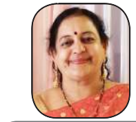
સદગુરુ વર્યાનામૃત સંકલન ફાલ્ગુની વસાવડા (ભાવનગર)

સૌથી પહેલો ફાયદો આપણે જોયું તેમ તે મિત્ર બની રહે છે, અન્ય મિત્રો સારા ખોટા ખરાબ કે પછી મતલબી પુરવાર થઈ શકે, જ્યારે પુસ્તકમાં આવી કોઈ દુર્ગુણ હોય નહીં, એટલે ગુમાવવાની કે છેતરાવાની કોઈ જ બીક રહેતી નથી.