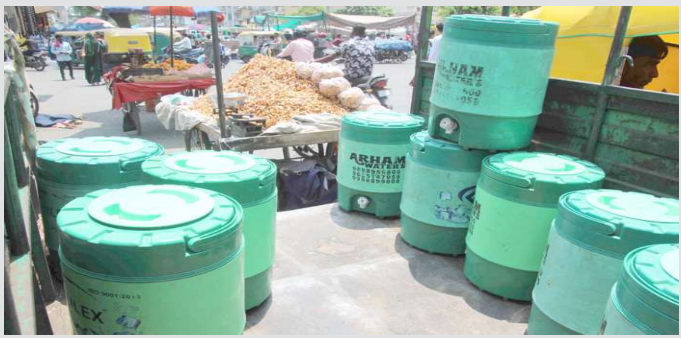
અમદાવાદમાં વધી રહેલ ગરમીને કારણે ભદ્ર અને માણેકચોકમાં ઠંડા પાણીના કેન મુકવામાં આવ્યા છે.