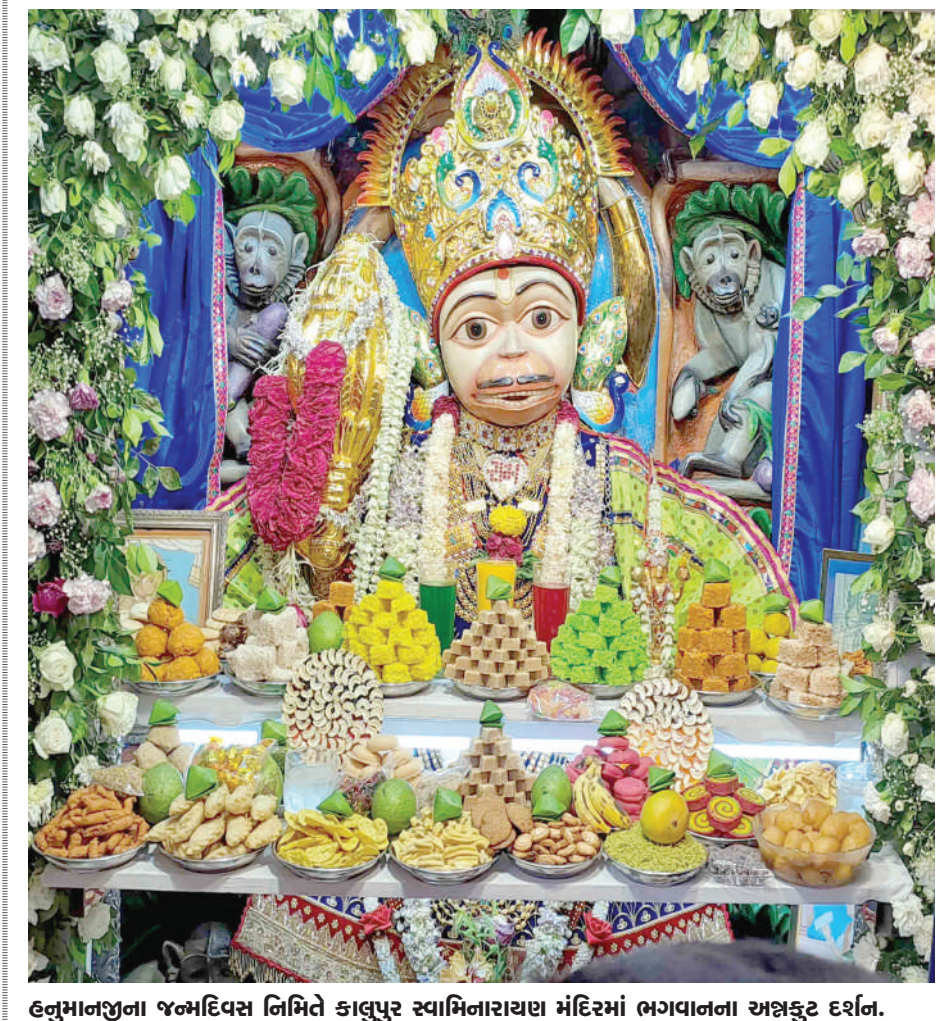
હનુમાનજીના જન્મદિવસ નિમિત્તે કાલુપુર સ્વામિનારાયણ મંદિરમાં ભગવાનના અન્નકુટ દર્શન.

। (એજન્સી) બોટાદ, તા.૨૩ । આજે હનુમાન જયંતી પાવન પર્વ નિમિત્તે સાળંગપુર ધામ ખાતે હનુમાન જયંતી ની ઉજવની ધામધૂમ પૂર્વક કરવામાં આવે છે. ઉજવણીના આ ઉત્સવમાં ગુજરાતના મુખ્યમંત્રી ભુપેન્દ્રભાઈ પટેલ પણ હાજર રહ્યા અને દાદા ના આશીર્વાદ મેળવ્યા.દર વર્ષની જેમ આ વર્ષે પણ હનુમાનજીના પાવન અવસરે સાળંગપુર ગામ ખાતે અનેક ધાર્મિક કાર્યક્રમનું આયોજન કરવામાં આવ્યું હતું. જેમાં સમૂહ મારુતિ યજ્ઞ અને સાથે જ હનુમાનજી દાદાને ધરાવેલા મહાઅન્નકૂટની આરતી નું પણ આયોજન કરવામાં આવ્યું હતું. મુખ્યમંત્રી ભુપેન્દ્ર પટેલ આરતી થયા હતા તેમણે પૂજા શ્રદ્ધાથી હનુમાનજી દાદાની આરતી કરી અને સૌ લોકોના સુખ, શાંતિ અને સમૃદ્ધિ માટે પ્રાર્થના પણ કરી હતી. મુખ્યમંત્રી ભુપેન્દ્ર પટેલ દાદાના દર્શન કરી આશીર્વાદ મેળવ્યા બાદ બીએપીએસ મંદિર ખાતે પણ દર્શન કર્યા હતા. દ્વારા સીએમ નું ભવ્ય સ્વાગત કરવામાં આવ્યું હતું. બંને જગ્યાએ દર્શન કરી મુખ્યમંત્રી હેલિકોપ્ટર મારફતે ગાંધીનગર જવા રવાના થયા હતા. સાળંગપુર ખાતે હનુમાન જયંતી ની ભવ્ય અને ઉમંગભરે ઉજવણી કરવામાં આવી હતી. જેમાં મોટી સંખ્યામાં સંતો, અગ્રણીઓને અને શ્રદ્ધાળુઓ જોડાયા હતા