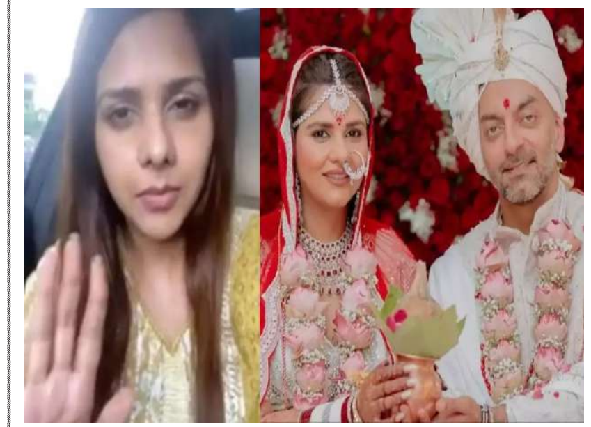
દિલજીત કૌરની ટીમે આ રિપોર્ટની પુષ્ટી કરી કે અભિનેત્રી તેના પતિથી અલગ થઈ શકે છે

તેલુગુ સુપર સ્ટાર જુનિયર એનટીઆર અને જાનહવી કપૂરની આગામી ફિલ્મ માટે ભારે ઉત્સુકતા છવાયેલી છે. જાનહવી માટે આ પહેલી તેલુગુ ફિલ્મ છે અને તે પાન ઈન્ડિયા રિલીઝ થવાની છે. ફિલ્મને બે પાર્ટમાં બનાવવાનો નિર્ણય લેવાયો છે, જેમાંથી પહેલો પાર્ટ ૧૦ ઓક્ટોબરે રિલીઝ થવાનો છે. આ ફિલ્મની પ્રોડક્શન કોસ્ટ ૩.૩૦૦ કરોડ હોવાનો અંદાજ છે, જ્યારે રિલીઝ પહેલા જ તેની આવક ૪.૪૦૦ કરોડ પહોંચી છે. બોલિવૂડના બે મોટા સ્ટાર્સ એટલે કે અક્ષય કુમાર અને અજય દેવગનની ફિલ્મો બોક્સઓફિસ પર હાંકી ગઈ છે ત્યારે સાઉથની 'દેવરા'ના પ્રી-રિલીઝ બિઝનેસ અંગે રસપ્રદ માહિતી બહાર આવી છે. જે મુજબ, આ ફિલ્મે ઘણી મોટી ડીલ પાર પાડી છે. જેના કારણે 'દેવરા પાર્ટ ૧'ને ૩.૪૦૦ કરોડની આવક થઈ ચૂકી છે. રિપોર્ટ્સ મુજબ, ફિલ્મને મળેલી આવકમાં તેના સેટેલાઈટ, ડિજિટલ, મ્યુઝિક અને ડબ્બિંગ રાઈટ્સનો સમાવેશ થાય છે. ફિલ્મના પ્રી-રિલીઝ બિઝનેસ અંગે ઓફિશિયલ માહિતી જાહેર થઈ નથી. એક અંદાજ મુજબ, ફિલ્મના પ્રોડક્શનમાં ૩.૩૦૦ કરોડનો ખર્ચ કરવામાં આવ્યો છે. આ ફિલ્મ પિરિયડ એક્શન થ્રિલર છે અને તેમાં સૈફ અલી ખાને વિલનનો રોલ કર્યો છે. સૈફ અલી ખાન માટે પણ આ પહેલી તેલુગુ ફિલ્મ છે. આ ફિલ્મની સ્ટોરી દરિયા કિનારાના વિસ્તારો સાથે સંકળાયેલી છે. જાનહવી અને એનટીઆર પહેલી વખત સાથે કામ કરી રહ્યા છે. 'દેવરા'ને પાન ઈન્ડિયા રિલીઝ કરવા માટે કાર્ટિંગમાં સાઉથ અને બોલિવૂડનું કોમ્બિનેશન કરવામાં આવ્યું છે.