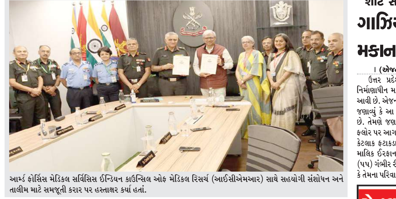
આર્મ્ડ ફોર્સિસ મેડિકલ સર્વિસિસ ઈન્ડિયન કાઉન્સિલ ઓફ મેડિકલ રિસર્ચ (આઈસીએમઆર) સાથે સહયોગી સંશોધન અને તાલીમ માટે સમજૂતી કરાર પર હસ્તાક્ષર કર્યા હતાં.

। (એજન્સી) નવી દિલ્હી, તા.૨૩ । વિદેશમાંથી સોનું ચાંદી છુપાવીને લાવવાની વાત નવી નથી. પરંતુ બેંગલુરુ એરપોર્ટ પર એક એવો કિસ્સો સામે આવ્યો છે જેમાં કસ્ટમ વિભાગને એટેચીમાંથી ૧૦ એનાકોન્ડા સાપ મળી આવ્યા હતા. બેંગલુરુના કેમ્પેગોડે ઈન્ટરનેશનલ એરપોર્ટ પર કસ્ટમની ટીમને એક પ્રવાસીની બેગમાંથી ૧૦ એનાકોન્ડા સાપ મળી આવ્યા હતા. બેંગલુરુ કસ્ટમ્સ ટિવટર પર ટિવટ કરીને આ માહિતી આપી હતી. જોમાં અધિકારીઓએ એક દાણચોરની ધકપકડ કરી છે. કસ્ટમ વિભાગે ટિવટ કરતા જણાવ્યું હતું કે બેંગલોરની આવનાર એક મુસાફરના ચેક ઈન દરમિયાન તેની એટેચીમાંથી પીળા રંગના ૧૦ એનાકોન્ડા મળી આવ્યા હતા. કસ્ટમ વિભાગે વન્યજીવ તસ્કરીનો પ્રયાસ નાકામ કરીને આરોપીને ઝડપી લીધો હતો. તેમને કહ્યું હતું કે આ પ્રકારની તસ્કરી સહન કરાશે નહીં. સીઆઈટીઈએસ અંતર્ગત સુરિબંધ પ્રજ્ઞાતિઓ સંમેલનની જોગવાઈઓને આધીન છે. બેંગલોરમાંથી વન્યજીવોની તસ્કરીનો આ પહેલો પ્રયાસ નથી.