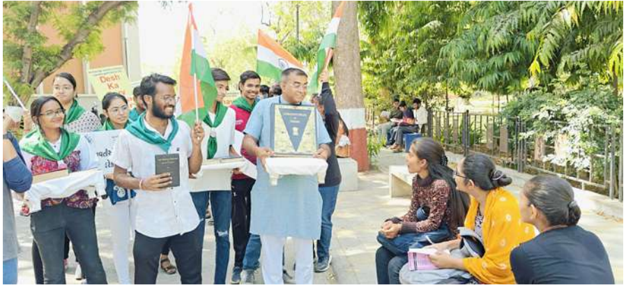
અમદાવાદ, તા.૨૩ |

ગુજરાત યુનિવર્સિટીના પ્રથમ વખતના યુવા મતદારો દ્વારા હાથમાં ચૂંટણીને લગતા ગ્રંથો, બેનર અને પોસ્ટર્સ લઈ ‘મતદાન જાગૃતિ’ રેલી યોજાઈ