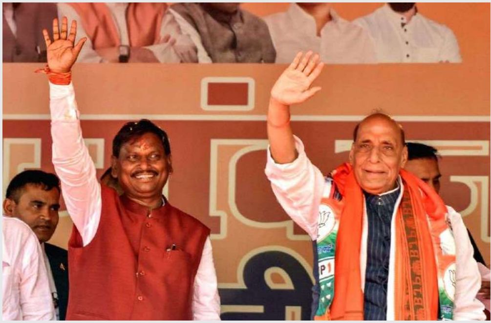
ચૂંટણી પ્રચાર રેલીમાં રક્ષામંત્રી રાજનાથ સિંહ ભાજપ ગારબંડના પ્રમુખ બાહુબલી મરાઠી અને ભાજપના લોકસભા ઉમેદવાર અર્જુન મુંડાસ દ્વારા ખુંટીમાં ચૂંટણી પ્રચાર રેલી કરવામાં આવી હતી.

1 (એજન્સી) નવી દિલ્હી, તા. ૨૩ | દિલ્હીના મુખ્યમંત્રી અરવિંદ કેજરીવાલની બીમારી અને ઈન્સ્યુલિનને લઈને વિવાદ શમવાનો નામ નથી લઈ રહ્યો. ઈન્સ્યુલિનને લઈને આમ આદમી પાર્ટી અને ભાજપ વચ્ચે ઉગ્ર શબ્દોની આપ-લે થઈ રહી છે. દરમિયાન, સમાચાર છે કે તિહારમાં કેજરીવાલને પ્રથમ વખત ઈન્સ્યુલિન આપવામાં આવ્યું છે. સૂત્રોના જણાવ્યા અનુસાર જેલમાં કેજરીવાલનું શુગર લેવલ સતત વધી રહ્યું હતું. તેમનું શુગર લેવલ ૩૨૦ પર પહોંચી ગયું હતું. આ પછી તેને ઈન્સ્યુલિન આપવામાં આવ્યું. તમને જણાવી દઈએ કે દારૂ કોબાંડ કેસમાં કેજરીવાલની ધરપકડ બાદ તેમને પહેલીવાર ઈન્સ્યુલિન આપવામાં આવ્યું છે. તમને જણાવી દઈએ કે આ પહેલા કેજરીવાલને ઈન્સ્યુલિન ન આપવાના મુદ્દે આમ આદમી પાર્ટીના સેંકડો કાર્યકરો અને નેતાઓએ તિહાર જેલમાં પ્રદર્શન કર્યું હતું. પાર્ટીના કાર્યકરો તિહારની બહાર ઈન્સ્યુલિનના ડોઝ લેવા અને જેલ પ્રશાસન સામે પ્રતિકાત્મક વિરોધ કરવા એકઠા થયા હતા. આપ નેતાઓએ તિહાર જેલના અધિકારીઓને કેજરીવાલને ઈન્સ્યુલિન આપવાનું કહ્યું હતું. આમ આદમી પાર્ટીએ આરોપ લગાવ્યો હતો કે દિલ્હીના મુખ્યમંત્રી અરવિંદ કેજરીવાલને તિહાર જેલની અંદર 'ધીમી મૃત્યુ' તરફ ધકેલવામાં આવી રહ્યા છે.