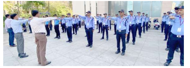
આ પ્રસંગે મદદનીશ નોડલ ઓફિસર આપીને અચૂક મતદાનના શપથ દ્વારા સૌને મતદાન જાગૃતિની સમજ લેવાવવામાં આવ્યા હતા.