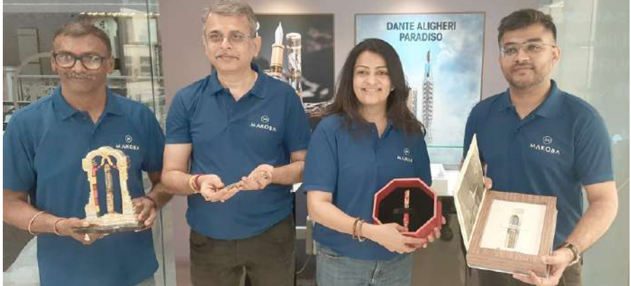
અમદાવાદ, તા.૨૩ |

ફાઉન્ટેન પેન્સ : તમારા ભૂતકાળના સંસ્મરણોથી ઓથપ્રોત અને સુનહરી ભવિષ્યને લખવા માટે સજ્ય