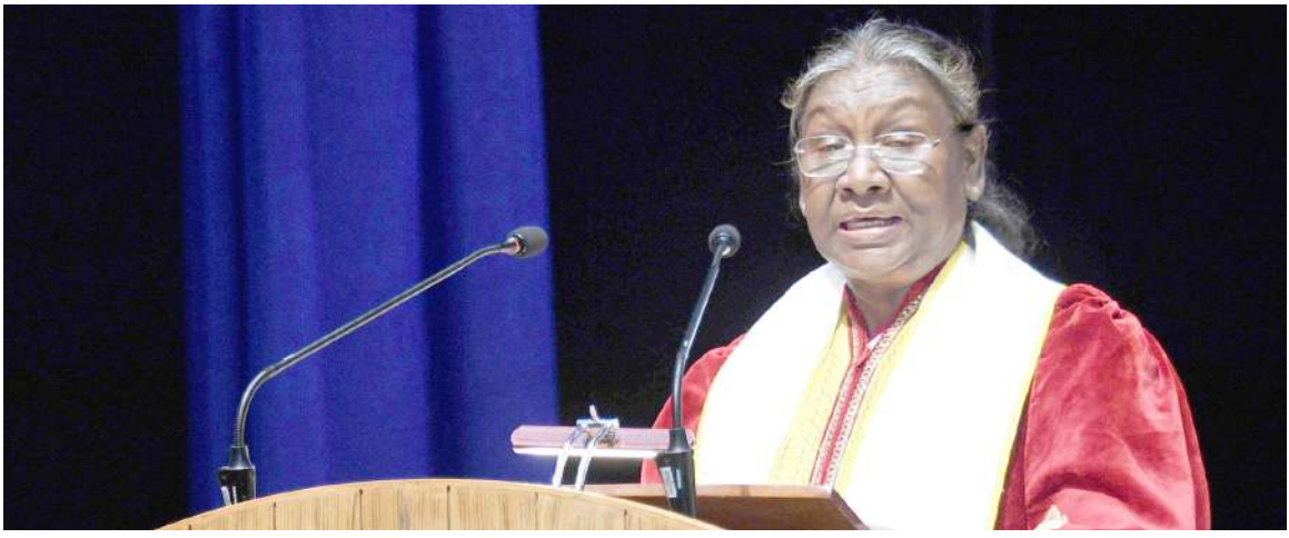
ભારતના રાષ્ટ્રપતિ શ્રીમતી દ્રૌપદી મુર્મુએ ઉત્તરાખંડમાં એઆઈઆઈએમએસ ઋષિકેશના ચોથી દીક્ષાત સમારોહમાં હાજરી આપી હતી.