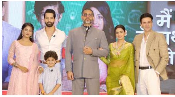
મુંબઈ, તા.૨૩ |

મેં હું સાથ તેરેમાં તેની સિંગલ માતાના જુવનમાં ખુશાલી લાવવાના કિચાનના હૃદયસ્પર્શી પ્રયત્નને જૂઓ, શોનું પ્રિમિયર થશે ૨૯મી એપ્રિલ સાંજે ૭.૩૦ વાગે ફક્ત ૩૦ ટીવી પર