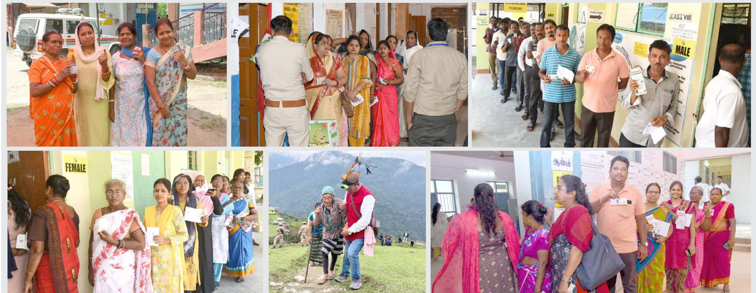
પ્રથમ તબક્કામાં તમામ ૨૧ રાજ્યો/કેન્દ્રશાસિત પ્રદેશોમાં મતદાન સરળતાપૂર્વક અને શાંતિપૂર્ણ રીતે મતદાન થયું. સવારે ૭ વાગ્યે ૧૦૨ પીસીમાં એક સાથે મતદાન શરૂ થતાં મતદાન મથકો પર મતદાન કરવાની તકની રાહ જોતા લાંબી ક્વાટરોમાં ઉભેલા મતદારોના દેશ્યો જોવા મળ્યા હતા.