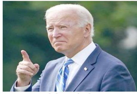
ઘણી વખત કહ્યું છે તેમ, અમે પ્રદેશમાં વ્યાપક યુદ્ધ ઈચ્છતા નથી. અમે ઈરાન સાથે યુદ્ધ નથી ઈચ્છતા.

બિડેને કહ્યું કે તેમણે નેતન્યાહુને કહ્યું કે ઈઝરાયેલે અભૂતપૂર્વ હુમલા સામે રક્ષણ અને હરાવવાની ઉત્તમ ક્ષમતા દર્શાવી છે. ઓઈટ હાઉસના ટોચના રાષ્ટ્રીય સુરક્ષા પ્રવક્તા જોન કિબીએ જણાવ્યું હતું કે અમેરિકા ઈઝરાયેલને પોતાનો બચાવ કરવામાં મદદ કરવાનું ચાહુ રાખશે, પરંતુ ઈરાન સાથે યુદ્ધ ઈચ્છતું નથી. જ્યારે તેમને પૂછવામાં આવ્યું કે શું અમેરિકા ઈરાનમાં ઈઝરાયેલની જવાબી કાર્યવાહીનું સમર્થન કરશે. તેના પર કિબીએ કહ્યું કે ઈઝરાયેલની સુરક્ષા માટે અમારી પ્રતિબદ્ધતા મક્કમ છે. રાષ્ટ્રપતિ બિડેને