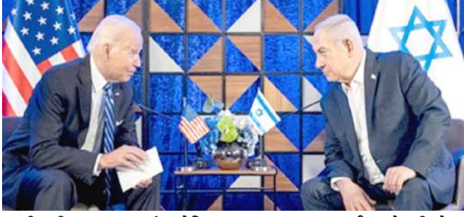
આવી હતી. જી-૭ જૂથમાં અમેરિકા, ઈટાલી, જાપાન, જર્મની, યાન્સ, બ્રિટન અને કેનેડાનો સમાવેશ થાય છે. જી-૭ નેતાઓએ ઈઝરાયેલ અને તેના લોકો માટે સંપૂર્ણ એકતા અને સમર્થન વ્યક્ત કર્યું છે.

। (એજન્સી) નવી દિલ્હી, તા.૧૫ । અમેરિકાના રાષ્ટ્રપતિ જો બિડેને ઈરાન દ્વારા ઈઝરાયેલ પર કરવામાં આવેલા ડ્રોન અને મિસાઈલ હુમલાને લઈને જી-૭ દેશોના નેતાઓ સાથે વાત કરી હતી. જી-૭ના નેતાઓએ ઈરાન દ્વારા ઈઝરાયેલ પરના સીધા હુમલાની સખત નિંદા કરતા કહ્યું કે તેનાથી તણાવ વધશે.