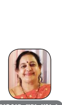
સંદગુરુ વયનામૃત સંકલન ફાઉન્ડેશનના વસાવડા (ભાવનગર)

માનવ કાયાની ધુરી એનાં ઉત્તર ધ્રુવ રૂપ સહસ્ત્રાર ચક્ર અને બ્રહ્મરંધ્ર બ્રહ્માંડની ચેતના સાથે સંપર્ક સાધી આદાન-પ્રદાનનો પથ નિર્મિત કરે છે પૃથ્વીના ઉત્તર અને દક્ષિણ ધ્રુવની જેમ માનવ કાયાના પથ બે ધ્રુવ છે