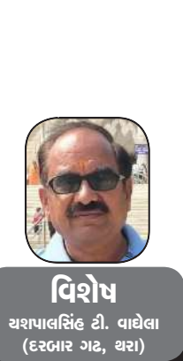
વિશેષ ચશપાલસિંહ દી. વાઘેલા (દરબાર ગઢ, ઘરા)

દેવી ભાગવત પુરાણ અનુસાર, નવ સ્વરૂપો અને દશ મહાવિદ્યા આદિશક્તિના તમામ ભાગો અને સ્વરૂપો છે, પરંતુ મહાગૌરી હંમેશા મહાદેવ સાથે અર્ધાગિનીના રૂપમાં રહે છે. તેમની શક્તિ અવિચ્છેદની અને હંમેશા ફળદાયી છે. મહાગૌરીની કૃપાથી તમામ પરેશાનીઓ દૂર થાય છે અને દરેક અશક્ય કાર્ય પૂર્ણ થાય છે. કેટલાક ઘરોમાં, મહાઅષ્ટમી તિથિ પર કન્યા પૂજા કરવામાં આવે છે, પરંતુ કેટલાક ઘરોમાં કન્યાની પૂજા મહાનવમી તિથિ પર કરવામાં આવે છે. ચૈત્ર સુદ આઠમને મંગળવાર એટલે કે આજે ચૈત્રી નવરાત્રીનો આઠમો દિવસ છે. ચૈત્રી નવરાત્રીના આઠમા દિવસે માતાના આઠમા સ્વરૂપ માં મહાગૌરીની પૂજા કરવામાં આવે છે. નવરાત્રી દરમિયાન માતાના નવ સ્વરૂપોની પૂજા કરવામાં આવે છે. નવરાત્રિનો આઠમો દિવસ ખૂબ જ મહત્વ ધરાવે છે. આ દિવસે કન્યા પૂજા કરવામાં આવે છે. માં મહાગૌરીનો રંગ ખૂબ જ ગોરો છે. તેણીને ચાર હાથ છે અને માતા બળદ પર