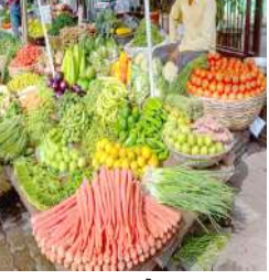
ઉદ્.૮૩ ટકા અને બટાકાના ભાવમાં ૨૫.૫૯ ટકાનો ઘટાડો થયો હતો. ફેબ્રુઆરી, ૨૦૨૪ની તુલનામાં માર્ચ, ૨૦૨૪ મહિના માટે WPI ઇન્ડેક્સમાં મહિના દર મહિને ફેરફાર ૦.૪૦ ટકા હતો.

। (એજન્સી) નવી દિલ્હી, તા.૧૫ । શાકભાજીના શિટેલ ભાવોમાં ઘટાડાથી વિપરિત માર્ચમાં જથ્થાબંધ ભાવો વધ્યા છે. પરિણામે જથ્થાબંધ મોંઘવારીમાં વધારો જોવા મળ્યો છે. માર્ચમાં જથ્થાબંધ ફુગાવો (WPI) નજીવો ૦.૫ ટકા વધ્યો છે. જે ગતવર્ષે ૦.૨ ટકા હતો.