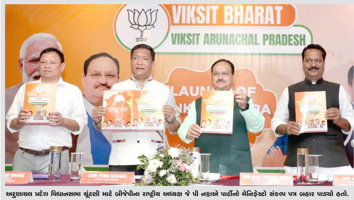
અરુણાચલ પ્રદેશ વિધાનસભા ચૂંટણી માટે બીજેપીના રાષ્ટ્રીય અધ્યક્ષ જે પી નંદાએ પાર્ટીનો મેનિફેસ્ટો સંકલ્પ પત્ર બહાર પાડ્યો હતો.

જાય તો કેવું રહે ? જો તમે પણ વારંવાર કેવાઈસી કરાવવામાંથી મુક્તિ મેળવવા માંગો છો તો આ સમાચાર તમારા માટે ઉપયોગી છે. કેમ કે વારંવાર કેવાઈસીના નિયમો બદલવાની તૈયારી ચાલી રહી છે. હવે સરકાર કેવાઈસી સાથે જોડાયેલા નિયમો બદલીને નવા નિયમો બનાવી રહી છે. તેમાં નિયમો બદલીને યુનિકોર્મ કેવાઈસી લાગુ કરવાનો વિચાર સરકાર કરી રહી છે. ચાલો જાણીએ કે, યુનિકોર્મ કેવાઈસી શું છે. આ કેવી રીતે કામ કરશે. તેમજ આ પ્રસ્તાવ કોણે આપ્યો છે. આ ક્યારે લાગુ થશે તેમજ તેના ફાયદા શું છે. કેવાઈસીનો ફૂલ ફોર્મ Know Your Customer થાય છે. આ બાબત કસ્ટમરની આઈડેન્ટિટી એટલે ઓળખ વેરિફાઈ કરવાની રીત છે. આ પછે પૈસા સાથે જોડેલા કામ માટે કેવાઈસી પ્રોસેસમાંથી પસાર થવું પડે છે.