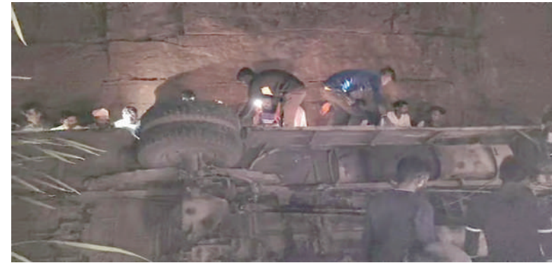
અને સ્થાનિક લોકો ઘટનાસ્થળે પહોંચી ગયા હતા. એક પછી એક બધાએ બસની અંદરથી તમામ ઘાયલ અને મૃતદેહોને બહાર કાઢવા આજ્ઞા આપી હતી. ઈજગ્રસ્તોને તાત્કાલિક નજીકની હોસ્પિટલમાં સારવાર માટે લઈ જવામાં આવ્યા હતા. પોલીસે જણાવ્યું કે, આ માર્ગ

કેડિયા ડિસ્ટ્રિક્ટની આ બસ હતી જે આ ઉઘોગના કામદારોને લઈ જતી હતી. આ બસમાં ઈન્ડસ્ટ્રીના ૩૦ કર્મચારીઓ હતા. આ બસ ખપરી ગામ નજીકથી પસાર થઈ રહી હતી ત્યારે બસ કાબૂ બહાર ગઈ હતી. થોડી જ વારમાં બસ ઠૂંટ પીણમાં પડી ગઈ છે. બસ ખીણમાં પડ્યા બાદ સ્થાનિક લોકો તાત્કાલિક મદદ માટે દોડી આવ્યા હતા. આ સમગ્ર મામલે સ્થાનિક લોકોએ તાત્કાલિક પોલીસને જાણ કરી હતી. પોલીસ તાત્કાલિક પહોંચી ગઈ હતી અને બચાવ કામગીરી શરૂ કરી હતી. ઠૂંટ નીચે પડી ગયેલી બસમાંથી લોકોને કોઈક રીતે બહાર કાઢવામાં આવ્યા હતા. ઘણી એમ્બ્યુલન્સ