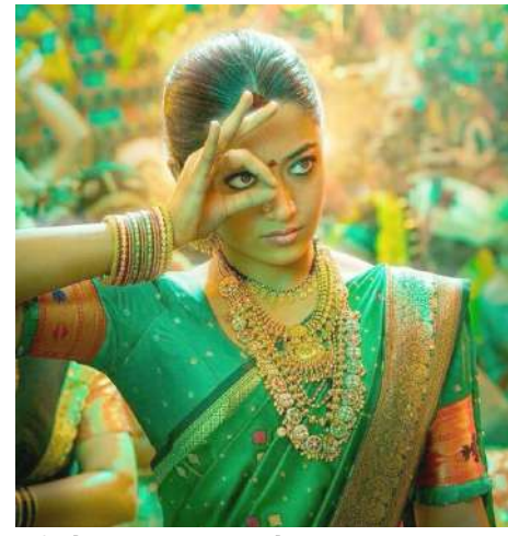
અભિનેત્રી રશ્મિકા મંદાના તેના ગળામાં હાર, નાકમાં વીટી અને મંગળસૂત્ર સાથેનો નેકલેસ પહેરીને ખૂબ જ જબરદસ્ત દેખાઈ રહી છે. અભિનેત્રીએ લાલ બિંદી,

૨૦૨૪ની સૌથી વધુ રાહ જોવાતી ફિલ્મોમાંથી એક 'પુષ્પા ૨: ધ રૂલ્સ'નું પહેલું પોસ્ટર સામે આવ્યું છે. અલ્લુ અર્જુન અને રશ્મિકા મંદાના ફરી એકવાર આ ફિલ્મથી બોક્સ ઓફિસ પર ધૂમ મચાવવા માટે તૈયાર છે. ઘણા સમયથી લોકો 'પુષ્પા ૨'ની રિલીઝની રાહ જોઈ રહ્યા છે. 'પુષ્પા ૨'ના નિર્માતાઓએ ૮મી એપ્રિલે અલ્લુ અર્જુનના જન્મદિવસે ફિલ્મનું પહેલું ટીઝર રિલીઝ કરવાની જાહેરાત કરી હતી, પરંતુ તે પહેલાં જ શ્રીવલ્લીના જન્મદિવસે તેમના ચાહકોને મેક્સ સરપ્રાઈઝ આપ્યું છે. 'પુષ્પા ૨'નો રશ્મિકા મંદાનાના ફર્સ્ટ લુકને સોશિયલ મીડિયા પર શેર કરવામાં આવ્યો છે. શ્રીવલ્લીનો આ લુક જોઈ ફેન્સ દંગ રહી ગયા છે. 'પુષ્પા ૨'ના આ પોસ્ટરમાં રશ્મિકા શ્રીવલ્લીના પાત્રમાં ખૂબ જ દમદાર લુકમાં દેખાઈ રહી છે. રશ્મિકા મંદાનાએ લીલા રંગની સાડી પહેરી છે, આ સાથે માંથામાં સિંદૂર અને હાથમાં લીલી-લાલ બંગડીઓ પહેરેલી જોવા મળે છે.