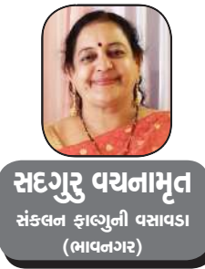
સંદેગુરુ વયનામૃત સંકલન ફાલ્ગુની વસાવડા (માવળગર)

ચૈત્ર મહિનાથી આપણું હિન્દુ સનાતન ધારાનું નવું વર્ષ શરૂ થાય છે, તેમજ મહારાષ્ટ્ર વગેરે રાજ્યોમાં ગુડી પડવો એટલે કે મહારાષ્ટ્રીયનનું નવું વર્ષ પણ ચૈત્ર મહિનાથી શરૂ થાય છે શિવ અને શક્તિ બંને અભિન્ન છે અને આપણે તેમના સંતાનો છીએ