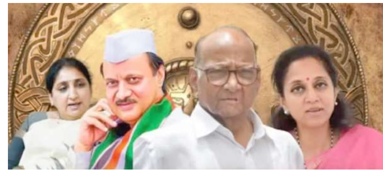
પાર્ટીને મળી છે. પરંતુ ભાજપ આ બેઠકને NDA તરફથી જીતવા પૂર્ણ તાકાત લગાવી રહ્યું છે. દેવેન્દ્ર ફડણવીસે તો ભારામતીમાં પવાર ફેક્ટરને નકારીને આ હાથે મોટી

ચૂંટણીમાં અજીત દાદાના નામ અને નારા વચ્ચે જ ભારામતીનું સમગ્ર રાજકારણ ચાલતું હતું. પરંતુ પપ વર્ષ બાદ હવે ભારામતીમાં એવો સમય આવ્યો છે કે, લોકોએ તાઈ અને દાદામાંથી કોઈ એકની પસંદગી કરવાની છે. એટલે જ રાજના ચૂંટણી જંગમાં બેટલ ઓફ ભારામતીની ચારે બાજુ ચર્ચા થઈ રહી છે. ભારામતીથી જીતની હેઠ્ઠીક લગાવી ચુકેલ સુપ્રિયા સુલે શરદ પવારની પાર્ટી તરફથી જીતનો ચોકકો મારવાની તૈયારી કરી રહી છે તો બીજી તરફ NDA તરફથી NCP પ્રમુખ અને અજીત પવારના પત્ની સુનેત્રા પવાર મેદાને છે.. NDA ગઠબંધન અંતર્ગત ભારામતી બેઠક અજીત પવારની NCP