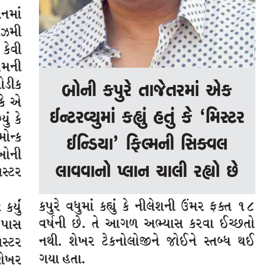
બોની કપુરે તાજેતરમાં એક ઇન્ટરવ્યુમાં કહ્યું હતું કે 'મિસ્ટર ઈન્ડિયા' ફિલ્મની સિકવલ લાવવાનો પ્લાન ચાલી રહ્યો છે

બોલિવુડ ટિગ્ડશંક અને ફિલ્મ પ્રોડ્યુસર બોની કપુરે તાજેતરમાં એક ઇન્ટરવ્યુમાં કહ્યું હતું કે 'મિસ્ટર ઈન્ડિયા' ફિલ્મની સિકવલ લાવવાનો પ્લાન ચાલી રહ્યો છે. હવે શેખર કપુરે આ ફિલ્મ સાથે જોડાયેલી કેટલીક રસપ્રદ વાતો જણાવી છે. શેખર કપુરે જણાવ્યું કે સિનેમેટોગ્રાફ બાબા આઝમીની સાથે મળીને તેમણે વંદા પાસે પણ અભિનય કરાવ્યો હતો. હકીકતમાં એક સીનમાં વંદા શ્રીદેવીની પાછળ ભાગે છે અને શ્રીદેવી તેનાથી ડરતી હોય છે. શેખર કપુરે જણાવ્યું કે એ વંદા અસલી હતો અને તેને ઓલ્ડ મોન્ક રમ પીવડાવ્યો હતો. શેખર કપુરે વધુમાં જણાવ્યું કે, એ સીનમાં કોકોચ પણ નશામાં હતો. હું અને બાબા આઝમી વિચારી રહ્યા હતા કે કોકોચ પાસે એકિંગ કેવી રીતે કરાવવામાં આવે. અમને ઓલ્ડ મોન્ક રમની બોટલ લાવવાનો વિચાર આવ્યો. અમે થોડીક રમ વંદા સામે ઢોળી દીધી. અમને લાગ્યું કે એ પીને એકિંગ કરશે. અમને હકીકતમાં લાગ્યું કે તેણે રમ પી લીધો છે. કદાચ તેને ઓલ્ડ મોન્ક રમ પસંદ આવી હતી. ઉલ્લેખનીય છે કે બોની કપુર અને ક ઇન્ટરવ્યુમાં કહી ચુક્યા છે કે મિસ્ટર ઈન્ડિયાની સિકવલ પર કામ ચાલી રહ્યું છે.