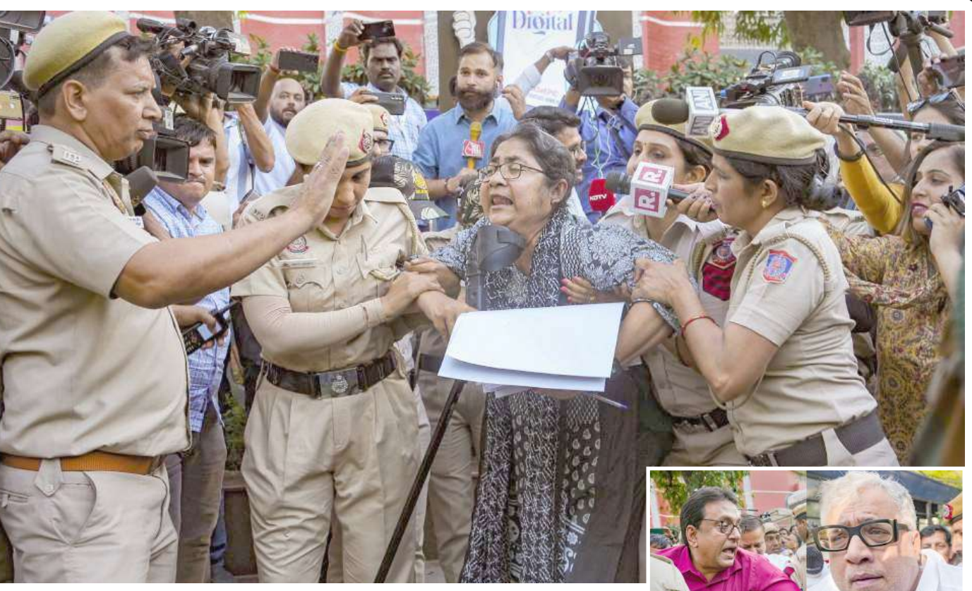
સીબીઆઈ, એનઆઈએ, ઈડી અને આવકવેરા વિભાગના વડાઓને બદલવાની માંગ સાથે ચૂંટણી પંચની ઓફિસની બહાર ધરણા કરી રહ્યા હતા ત્યારે દિલ્હી પોલીસે ટીએમસી નેતાઓની અટકાયત કરી હતી.

। (એજન્સી) નવી દિલ્હી, તા. ૬ । ભારત સરકારે દેશના ગરીબ ખેડૂતોને આર્થિક સુરક્ષા પૂરી પાડવા માટે પીએમ કિસાન સન્માન નિધિ યોજનાનું સંચાલન કરી રહી છે. આ મહત્વાકાંક્ષી યોજના હેઠળ સરકાર દર વર્ષે ખેડૂતોને ૬,૦૦૦ રૂપિયાની આર્થિક સહાય પૂરી પાડે છે. ૬ હજાર રૂપિયાની આ આર્થિક સહાય ખેડૂતોના ખાતામાં ત્રણ હપ્તાના રૂપમાં આપવામાં આવે છે. દરેક હપ્તો ૪ મહિનાના અંતરે ખેડૂતોના ખાતામાં મોકલવામાં આવે છે. અત્યાર સુધીમાં સરકારે ખેડૂતોના ખાતામાં કુલ ૧૬ હપ્તા મોકલી દીધા છે. આવી સ્થિતિમાં દેશભરના કરોડો ખેડૂતો હવે ૧૭મા હપ્તાની આતુરતાથી રાહ જોઈ રહ્યા છે. આ શ્રેણીમાં, ચાલો જાણીએ કે ભારત સરકાર પ્રધાનમંત્રી કિસાન સન્માન નિધિ યોજનાનો ૧૭મો હપ્તો ક્યારે બહાર પાડી શકે છે. જો મીડિયા રિપોર્ટ્સનું માનીએ તો, ભારત સરકાર જૂન અથવા જુલાઈ મહિનામાં પ્રધાનમંત્રી કિસાન સન્માન નિધિ યોજનાનો ૧૭મો હપ્તો મોકલવાનો આશંકા કરી રહ્યા છે. જો કે, સરકારે હજુ સુધી હપ્તાના નાણાં ટ્રાન્સફર કરવા અંગે કોઈ સત્તાવાર જાહેરાત કરી નથી. જો તમે પણ યોજનાનો લાભ લેવા માંગતા હોવ તો. આવી સ્થિતિમાં, તમારે શક્ય તેટલી વહેલી તકે યોજનામાં તમારા જમીનના રેકોર્ડની ચકાસણી કરાવવી જોઈએ. અન્યથા તમને યોજનાનો લાભ નહીં મળે. જે ખેડૂતોએ યોજના હેઠળ હજુ સુધી તેમનું ઈ-કેવાયસી કરાવ્યું નથી. ૧૭મા હપ્તાના ધેસા તેના ખાતામાં પણ આવશે નહીં. આવી સ્થિતિમાં, લાભ મેળવવા માટે, તમારે આ મહત્વપૂર્ણ કાર્ય શક્ય તેટલું જલ્દી કરવું જોઈએ.