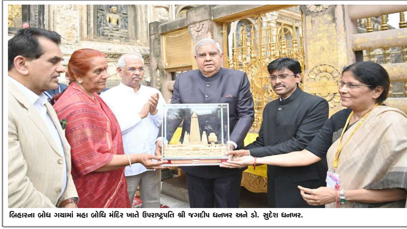
ગિહારના બોધ ગયામાં મહા બોધિ મંદિર ખાતે ઉપરાષ્ટ્રપતિ શ્રી જગદીપ ધનખંડે અને ડો. સુદેશ ધનખંડે.

। (એજન્સી) નવી દિલ્હી, તા.૭ । ભાજપના રાષ્ટ્રીય અધ્યક્ષ જે.પી. નકાએ શનિવારે રાજ્યસભાના નિર્વાચિત સદસ્ય તરીકે શપથ ગ્રહણ કર્યા છે. નકા ગુજરાતમાંથી રાજ્યસભા સાંસદ તરીકે ચૂંટાયા છે. તેમને ઉપરાષ્ટ્રપતિ અને રાજ્યસભાના સભાપતિ શ્રી જગદીપ ધનખંડે આજે સંસદ ભવનમાં આયોજીત શપથ ગ્રહણ કાર્યક્રમમાં નિર્વાચિત સભ્ય તરીકે શપથ લેવાડાવ્યા છે. આ દરમિયાન રાજ્યસભાના ઉપસભાપતિ હરિવંશ પણ હાજર રહ્યા હતા. જે.પી. નકાના શપથ ગ્રહણની તસ્વીર ઉપરાષ્ટ્રપતિના સત્તાવાર એક્સ અકાઉન્ટ પરથી પોસ્ટ કરવામાં આવી છે. તેમાં લખ્યું છે કે, ભારતના માનનીય ઉપરાષ્ટ્રપતિ અને રાજ્યસભાના સભાપતિ શ્રી જગદીપ ધનખંડે આજે સંસદ ભવનમાં શ્રી જગતપ્રકાશ નારાયણલાલ નકાજીને રાજ્યસભાના નિર્વાચિત સભ્ય તરીકે શપથ લેવાડાવ્યા. જે.પી. નકા ગત વખતે હિમાચલ પ્રદેશમાંથી રાજ્યસભા પહોંચ્યા હતા. તેમણે ગત મહિને હિમાચલ પ્રદેશની સીટથી રાજ્યસભા સભ્ય તરીકે પોતાનું રાજીનામું સોંપી દીધું હતું.