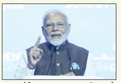
રાહુલ ગાંધીના ભાષણ પર સવાલ ઉઠાવ્યા છે. મોદીએ કહ્યું કે આપણે એ દેશના લોકો છીએ જે

કોંગ્રેસ દ્વારા જે પ્રકારનો ટંદેરા જારી કરવામાં આવ્યો છે તે સાબિત કરે છે કે આજની કોંગ્રેસ ભારતની આકાંક્ષાઓથી દૂર છે. તેમણે કહ્યું કે તમે મારું કામ જોયું છે. મારી દરેક ઘણા દેશના નામે છે. તમારું સ્વપ્ન મોદીનો સંકલ્પ છે. અમે ભણાયાર પર જે હુમલો કરી રહ્યા છીએ તે તમારા સારા ભવિષ્ય માટે છે. પીએમ મોદીએ કહ્યું કે ભણાયાર ગરીબોના સપના તોડે છે અને તમને લૂંટે છે. પીએમ મોદીએ કહ્યું, “તમારા પુત્ર-પુત્રીઓને બચાવવા માટે હું આટલા બધા અત્યાચારોનો સામનો કરી રહ્યો છું.” અહીં ફરી એકવાર વડાપ્રધાન નરેન્દ્ર મોદીએ શક્તિ વિરુદ્ધ