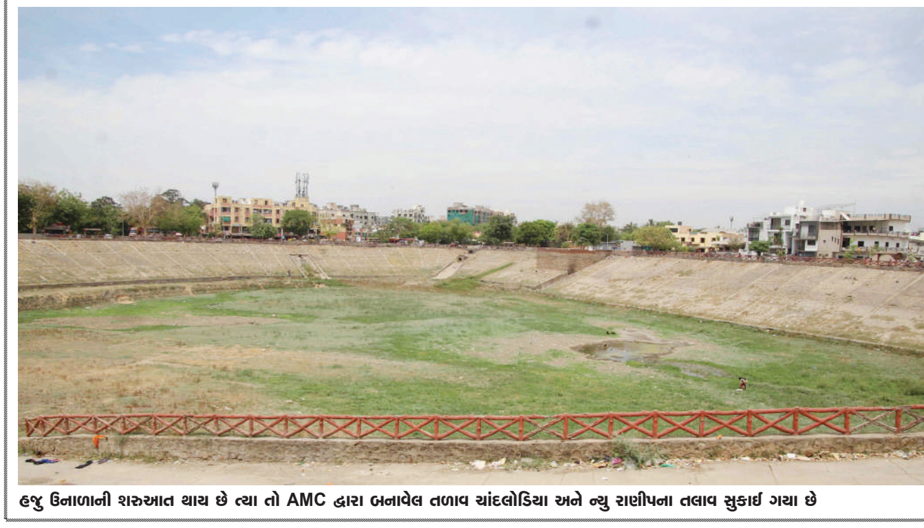
૯૫ ઉનાળાની શરુઆત થાય છે ત્યા તો AMC દ્વારા બનાવેલ તળાવ ચાંદલોડિયા અને ન્યુ રાણીપાના તલાવ સુકાઈ ગયા છે