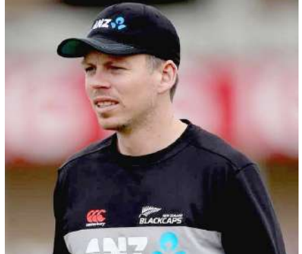
આગામી મહિનાઓમાં ન્યૂઝીલેન્ડની ક્રિકેટ ટીમના વ્યસ્ત કાર્યક્રમને ધ્યાનમાં રાખીને ટિમ સાઉથીને આરામ આપવામાં આવ્યો છે. સાઉથીએ છેલ્લે યોજાયેલા ટીર૦ વર્લ્ડ કપમાં ન્યૂઝીલેન્ડ માટે સૌથી વધુ વિકેટ ખેરવી હતી. ૩૩ વર્ષીય બ્રેસવેલ ગયા માર્ચ મહિનાથી ઈજાને કારણે ટીમની બહાર હતો

। (એજન્સી) ઓકલેન્ડ, તા.૪ । અમેરિકા અને વેસ્ટ ઈન્ડિઝમાં યોજાનારા ટીર૦ વર્લ્ડ કપ અગાઉ પ્રેક્ટિસના ભાગરૂપે પાકિસ્તાનનો પ્રવાસ કરનારી ન્યૂઝીલેન્ડની ક્રિકેટ ટીમના સુકાનીપદે બુધવારે ઓલરાઉન્ડર મિચેલ બ્રેસવેલની વરણી કરવામાં આવી હતી. આ સિરીઝમાં પાકિસ્તાન અને ન્યૂઝીલેન્ડ વચ્ચે પાંચ ટીર૦ મેચ રમાશે.