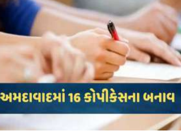
અમદાવાદમાં 16 કોપીકેસના બનાવ

। (એજન્સી) અમદાવાદ, તા.૪ । તાજેતરમાં પૂર્ણ થયેલી ધોરણ ૧૦-૧૨ બોર્ડની પરીક્ષામાં વર્ગખંડોના CCTV તપાસવાની કામગીરી શરૂ કરાઈ હતી. અમદાવાદ શહેરની શાળાઓના સીસીટીવી તપાસતા ૧૬ કોપીકેસના બનાવો સામે આવ્યા છે. વર્ગખંડ નિરીક્ષકનું ધ્યાન ના હોય ત્યારે વિદ્યાર્થીઓ પૂરવણી બદલતા, કાપલી કરતા કે એક બીજામાંથી જોતા હોવાનું સીસીટીવીમાં ધ્યાને આવ્યું છે. આ ઉપરાંત સેન્ટ્રલ જેલમાં પરીક્ષા આપતા ૪ કેદી પણ કોપી કરતા ઝડપાયા છે. તાજેતરમાં પૂર્ણ થયેલી ધોરણ ૧૦-૧૨ બોર્ડની પરીક્ષામાં વર્ગખંડોના CCTV તપાસવાની કામગીરી શરૂ કરાઈ હતી. અમદાવાદ શહેરની શાળાઓના સીસીટીવી તપાસતા ૧૬ કોપીકેસના બનાવો સામે આવ્યા છે. વર્ગખંડ નિરીક્ષકનું ધ્યાન ના હોય ત્યારે વિદ્યાર્થીઓ પૂરવણી બદલતા, કાપલી કરતા કે એક બીજામાંથી જોતા હોવાનું સીસીટીવીમાં ધ્યાને આવ્યું છે. આ ઉપરાંત સેન્ટ્રલ જેલમાં પરીક્ષા આપતા ૪ કેદી પણ કોપી કરતા ઝડપાયા છે. બોર્ડની પરીક્ષાઓ પૂર્ણ થયા બાદ DEO કક્ષાએથી