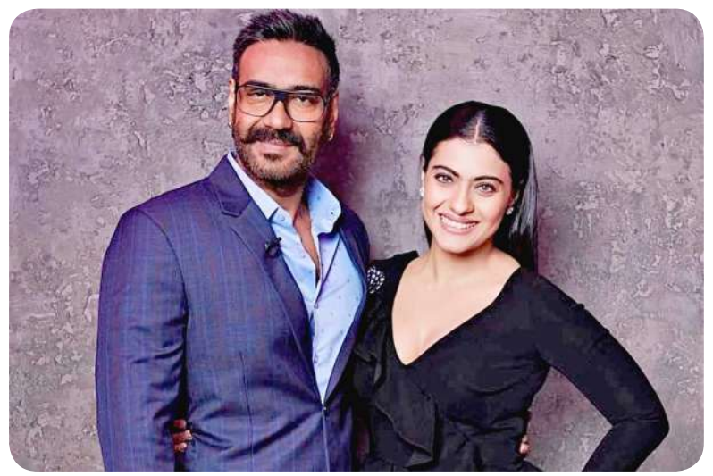
અજય અને કાજોલે ૧૯૯૯ માં લગ્ન કર્યા

રકમ તેમને ફિલ્મમાં માત્ર ચાર મિનિટ ગાવા માટે આપવામાં આવી હતી. રિપોર્ટ અનુસાર, અભિનેત્રીએ 'રાગિની એમએમએસ ૨'માં તેના ગીત 'બેબી ડોલ' માટે તેનાથી પણ વધુ ફી લીધી હતી. પરંતુ તે ફિલ્મમાં સનીની પણ મુખ્ય ભૂમિકા હતી. જોકે, એ સ્પષ્ટ નથી થયું કે તેણે ફિલ્મમાંથી કેટલી ફી વસૂલ કરી છે. રિપોર્ટ અનુસાર, સની તેના એક ગીત માટે ડાન્સિંગ ક્વીન નોરા ફતેહી કરતાં વધુ ફી લે છે. તે તેના દરેક ગીત માટે ૨ કરોડ રૂપિયા ચાર્જ કરે છે. કેટરિના કૈફ, કરીના કપૂર અને જેકલીન ફર્નાન્ડીઝ જેવી ટોપ અભિનેત્રીઓ પણ એક ગીત માટે ૧.૫-૨ કરોડ રૂપિયા ચાર્જ કરે છે. જોકે સની આખા ભારતમાં સૌથી વધુ કમાણી કરનારી આઈટમ ગર્લ નથી. તેલુગુ સ્ટાર સામંથા રૂથ પ્રભુએ 'પુષ્પા ધ રાઈઝ'ના ચાર્ટબસ્ટર ઉ અંતાવામાં તેના ડાન્સ નંબર માટે ૫ કરોડ રૂપિયા ચાર્જ કર્યા છે.