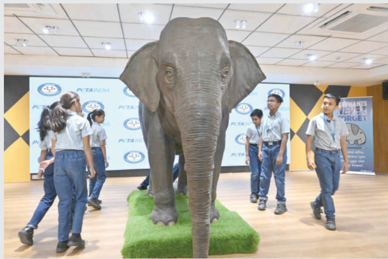
પેટા સંસ્થા દ્વારા થલતેજની એક સ્કુલમાં એલિફન્ટનો ડેમો બનાવીને વિદ્યાર્થીઓને સમજણ અપાઈ હતી.

કીટાણુઓ ઉત્પન્ન થાય છે જે ટીબી, કોરોના જેવા ખતરનાક રોગો ફેલાવે છે. એકવાર થૂંકવાથી એક ચોરસ ફૂટ જગ્યા અને તેના કીટાણુ ૨૭ ફૂટ સુધી ફેલાય છે અને તે જગ્યાને સાફ કરવામાં બે લીટરથી વધુ પાણીનો વ્યય થાય છે. આટલું જ નહીં તે પર્યાવરણને પણ પ્રદૂષિત કરે છે.