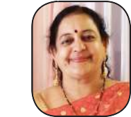
સંકલ્પ વયનામૂલ સંકલન ફાઉન્ડેશન વસાવડા (ભાવનગર)

આમ પણ સ્ત્રી હોય કે પુરુષ એ બંને જણા પોતાના સાસરામાં અમુક પ્રકારની મર્યાદાથી જ જીવતા હોય છે, બસ એ જ રીતે આપણે પણ આપણી મર્યાદા જાળવીને અહીં જીવવાનું છે, તો આપણી આ ચુંદડીમાં ઓછામાં ઓછા ડાઘ લાગશે.