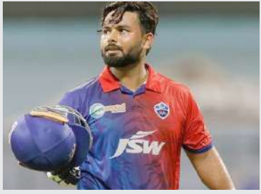
આવતાની સાથે આ ખેલાડીએ કર્યો ચોગ્ગા-છોગ્ગાનો વરસાદ. વિરોધી ટીમનો માલિક

ખેલાડી ઠીક થયો. અકસ્માત બાદ બે મિનિટ પોતાના પગ પર ઉભો રહી શકે તેવી પણ આ ખેલાડીની હાલત નહોતી. જોકે, તેમ છતાં તેણે ક્યારેય પોતાનું મનોબળ ગુમાવ્યું નહીં, માનસિક સંતોલન ગુમાવ્યું નહીં અને સખત મહેનત કરીને ફરી તે મેદાનમાં પાછો ફર્યો. આ દરમિયાન તે વર્લ્ડ કપ ચુકી ગયો. પણ તેમ છતાં જ્યારે તે ખેલાડી આઈપીએલમાંથી પરત આવ્યો તો ફરી પાછો માહોલ જમાવી દીધો. મેદાનમાં