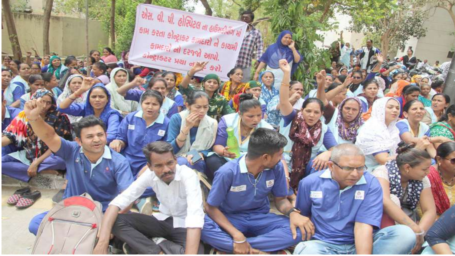
પાલડી એસવીપી હોસ્પિટલના હાઉસ કીપર હારા તેમની પડતર માંગણીઓને લઈને હડતાળ પર ઉતર્યા હતા અને દેખાવો કર્યા હતા.