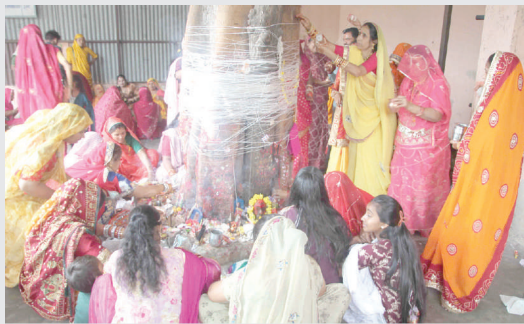
રાજસ્થાન સમાજની મહિલાઓ દ્વારા હોળી પછી દશમના દિવસે પીપળના વૃક્ષનું પૂજન કરી વ્રત કરવામાં આવ્યું હતું.