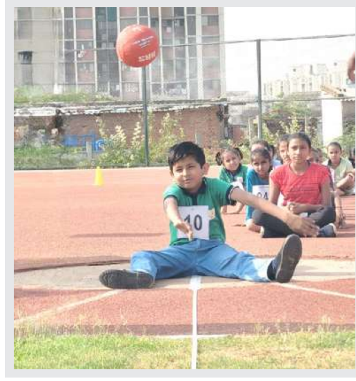
પસંદગી પામેલ ખેલાડીઓને ઉચ્ચતરનું શિક્ષણ, નિવાસ, ભોજન, અદ્યતન રમતની ધનિષ્ઠ તાલીમ તથા જે તે રમતના સાધનો જેવી જરૂરી સુવિધાઓ વિના મૂલ્યે પૂરી પાડવામાં આવશે.

જિલ્લાકક્ષા સ્પોર્ટ્સ સ્કૂલ યોજના અંતર્ગત આગામી શૈક્ષણિક વર્ષ: ૨૦૨૪-૨૫ ના સમયગાળા દરમિયાન યોજનામાં સમાવવા યોગ્યતા ધરાવતા ખેલાડીઓની પસંદગી કરવા માટે અમદાવાદ જિલ્લાકક્ષાની બેટરી ટેસ્ટનું આયોજન જિલ્લા રમત વિકાસ અધિકારી અમદાવાદની કચેરી દ્વારા તા. ૨૯/૦૩/૨૦૨૪ (અં-૯ બહેનો) અને તા. ૩૦/૦૩/૨૦૨૪ (અં-૯ ભાઈઓ) તેમજ તા. ૦૧/૦૪/૨૦૨૪ (અં-૧૧ ભાઈઓ) અને તા. ૦૨/૦૪/૨૦૨૪ (અં-૧૧ ભાઈઓ) દરમિયાન એથલેટિક્સ ટ્રેક નિકોલ રમત સંકુલ, નિકોલ, અમદાવાદ ખાતે કરવામાં આવેલ હતું.