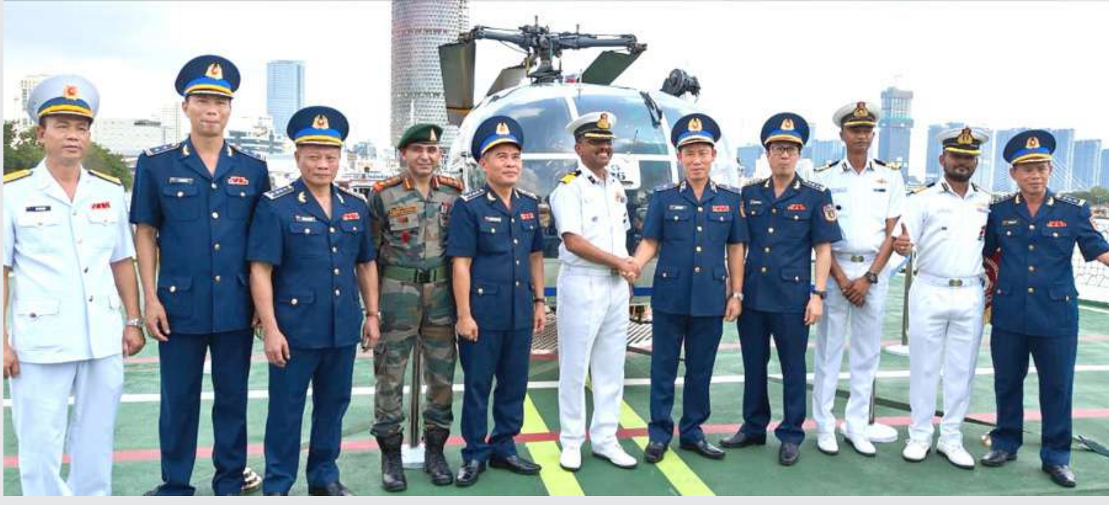
આઈસીજીના પ્રદૂષણ નિયંત્રણ વેસલ સમુદ્ર પહેરાદરે વિવેતનામમાં ASEAN દેશોમાં તેની વિદેશી જમાવટના ભાગરૂપે પોર્ટ કોલ કર્યો.