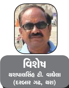
વિશેષ અશપાલકિંદ્ર ડી. વાલેલા (રૂબાઈ ગઢ, ઘરા)

ભગવાન કહે છે કે, હું કૃપા કરુંતો જ સંઘાઈ ભક્તનો પ્રેમ જ મને બાંધી શકે, બીજું કોઈ નહીં, લૌકિક દોરીથી હું બંધાતો નથી, કેવળ પ્રેમની દોરીથી જ બંધાઈ છું.