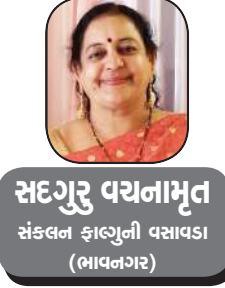
સંકલન કાલ્પનુ વસાવડા (ભાવનગર)

ત્રણ ચાર વરસની મૈત્રી બાદ તેઓ એ લગન કરી લીધાં, અને દુનિયાનું સ્વર્ગ જાણે ધરતી પર હોય, તેવો અનુભવ શરૂઆતના વર્ષમાં બંનેને થતો હતો.