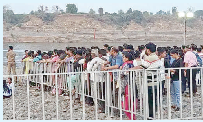
પાણી છોડવામાં આવી રહ્યું છે જેથી નદીના પાણીનું જળસ્તર વધી શકે છે

1 (એજન્સી) રાજકોટ, તા.૩૦ | નર્મદા ક્રોડમાં પંચકોશી પરિક્રમા ચૈત્ર સુદ એકમથી ચૈત્ર વદ અમાસ સુધીના સમયગાળામાં કરવામાં આવે છે. ત્યારે આ પંચકોશી પરિક્રમા હાલ અંતિમ ચરણમાં પહોંચી છે ત્યારે આ પરિક્રમા પર તંત્રએ થોડા દિવસ માટે રોક લગાવી છે. જણાવી દઈએ કે, કેમમાંથી ૩૦,૦૦૦ ક્યુસેક પાણી નર્મદા નદીમાં છોડવામાં આવ્યું છે. જેને લઈને નર્મદા નદીની સપાટી વધારો થતા આ નિર્ણય લેવામાં આવ્યો છે. જેને પગલે પરિક્રમાવાસીઓને નર્મદા પરિક્રમા કરવા ન આવવાની તંત્ર દ્વારા સૂચના આપવામાં આવી છે. પરંતુ ગઈ કાલે રાતે તિલકવાળા અને શહેરાવ વચ્ચે પરિક્રમાવાસીઓએ હંગામી પુલ બનાવ્યો હતો તેના પર પાણી ફરી વળતા હજારો ભક્તો અધવચ્ચે જ અટકાઈ ગયા હતા જેના કારણે ભારે હોબાળો થયો હતો. મળતી માહિતી મુજબ, નર્મદા કેમમાંથી નદીમાં પાણી છોડાતા નર્મદા પંચકોશી પરિક્રમા સ્થગિત કરવામાં આવી છે. અચાનક જ લેવાયેલા તંત્રના નિર્ણયથી પરિક્રમા કરવા આવનારા ભક્તોમાં ભારોભાર રોષ જોવા મળ્યો હતો. ગઈકાલ રાતથી જ પરિક્રમા સ્થગિત કરાતા હંગામી બનાવેલા પુલ પર પાણી ફરી વળતા બંધ કરાયો છે. જેના કારણે હજારો ભક્તો અધવચ્ચે જ અટકાયા છે. હંગામી પુલ પણ બંધ થઈ જતા હજારો પરિક્રમાવાસીઓ અધવચ્ચે ફસાઈ જતા ભારે અરાજકતા સર્જાઈ છે. આ મુદ્દાને લઈને પોલીસ અને ભક્તો વચ્ચે ભારે હોબાળો થયો હતો.