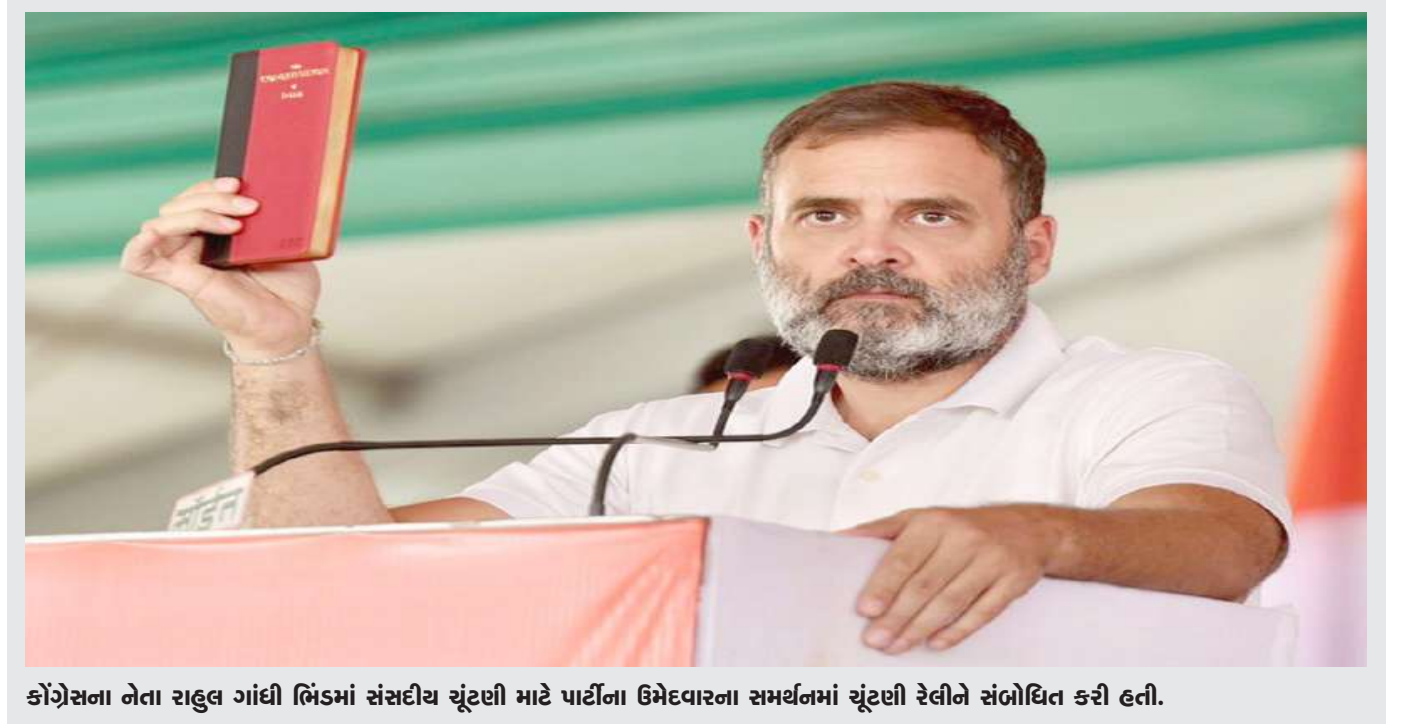
કોંગ્રેસના નેતા રાહુલ ગાંધી ભિંડમાં સંસદીય ચૂંટણી માટે પાર્ટીના ઉમેદવારના સમર્થનમાં ચૂંટણી રેલીને સંબોધિત કરી હતી.

સવાલો ઉઠાવ્યા કે આ મામલો ઘણા વર્ષોથી જાણીતો હોવા છતાં કેમ કોઈ કાર્યવાહી કરવામાં આવી નથી. લાઇસન્સિંગ ઓથોરિટીએ જણાવ્યું કે, પતંજલિ આયુર્વેદ, તેના મેનેજિંગ ડિરેક્ટર આચાર્ય બાલકૃષ્ણ, તેના સહ-સ્થાપક બાબા રામદેવ અને દિવ્યા ફાર્મસી વિરુદ્ધ ડ્રગ્સ એન્ડ મેજિક રેમેડીઝ (વાંધાજનક જાહેરાત) એક્ટ ૧૯૫૪ હેઠળ ચીફ જ્યુડિશિયલ મેજિસ્ટ્રેટ, હરિદ્વાર સમક્ષ ફોજદારી ફરિયાદ દાખલ કરવામાં આવી છે. કોર્ટ કરવામાં આવી છે. આ સિવાય ઓથોરિટીએ કહ્યું કે બાબા રામદેવના ઉત્પાદનોના જે લાઇસન્સ તેણે સસ્પેન્ડ કર્યાં છે. તેમાં સ્વસારી ગોલ્ડ, સ્વસારી વટી, પ્રોનકોમ, સ્વસારી પ્રવાહ, સ્વસારી અવલેહ, કેન્દ્ર સરકારે આેકસ્ટ્રા પાવર, લિપિ ડોમ, બીપી ષ્રિટ, મધુચિત, મધુનાશિની વટી એક્સ્ટ્રા પાવર, લિવામૃતમાં એડવાન્સ, લિવોચિટ, આઈચિટ ગોલ્ડ અને પતંજલિ ટ્રસ્ટિ આઈ ડ્રોપ્સનો સમાવેશ થાય છે