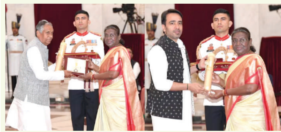
બિહારના મુખ્યમંત્રી નીતિશ કુમાર અને અન્ય ઘણા લોકો પછા આ સન્માન મેળવવા માટે ભાગ લીધો હતો જે મરણોત્તર આપવામાં આવી રહ્યું છે. આ દરમિયાન

। (એજન્સી) નવી દિલ્હી, તા.૩૦ । રાષ્ટ્રપતિ દ્રૌપદી મુર્મુએ દેશની ચાર મહાન હસ્તીઓને દેશના સર્વોચ્ચ સન્માન ભારત રત્નથી નવાજ્યા છે. આ ચાર વ્યક્તિઓને રાષ્ટ્રપતિ મુર્મુ દ્વારા ભારત રત્ન એનાયત કરવામાં આવ્યો છે. શનિવારે દિલ્હીના રાષ્ટ્રપતિ ભવનમાં આયોજિત એક સમારોહમાં રાષ્ટ્રપતિ મુર્મુએ બિહારના બે વખતના મુખ્યમંત્રી જનનાયક કપૂરી ઠાકુર, પૂર્વ વડાપ્રધાન પીવી નરસિંહા રાવ, પૂર્વ વડાપ્રધાન ચૌધરી ચરણ સિંહ અને દેશના પ્રખ્યાત કૃષિ વૈજ્ઞાનિક એમ.એસ.સ્વામીનાથનને ભારત રત્નથી સન્માનિત કર્યાં. તે તમામને મરણોત્તર પુરસ્કાર આપવામાં આવ્યો હતો. આ પ્રસંગે રાષ્ટ્રપતિ ભવન ખાતે વડાપ્રધાન નરેન્દ્ર મોદી, ગૃહમંત્રી અમિત શાહ, ભાજપના રાષ્ટ્રીય અધ્યક્ષ જેપી નડ્ડા સાથે કોંગ્રેસ અધ્યક્ષ મલ્લિકાર્જુન ખડગે, વિદેશ મંત્રી એસ.જયશંકર,