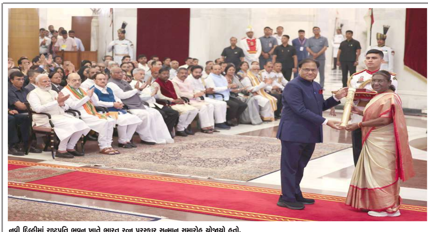
નવી દિલ્હીમાં રાષ્ટ્રપતિ ભવન ખાતે ભારત રત્ન પુરસ્કાર સન્માન સમારોહ યોજાયો હતો.