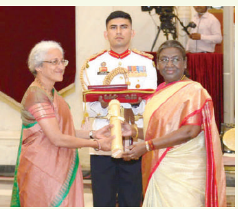
કાર્યક્રમમાં ઉપસ્થિત સૌનું તાળીઓના ગડગડાટથી સ્વાગત કરવામાં આવ્યું હતું. પૂર્વ વડાપ્રધાન નરસિંહા

રાવને આપવામાં આવેલ ભારત રત્ન પુરસ્કાર તેમના પુત્ર પીવી પ્રભાકર રાવે સ્વીકાર્યો હતો. ચૌધરી ચરણ સિંહ વતી તેમના પૌત્ર અને રાષ્ટ્રીય લોકદળના અધ્યક્ષ જયંત ચૌધરીએ આ એવોર્ડ સ્વીકાર્યો. આ સાથે તેમની પુત્રી નિત્યા રાવે સ્વામીનાથન વતી રાષ્ટ્રપતિ એવોર્ડ મેળવ્યો હતો. તમને જણાવી દઈએ કે આ વર્ષે કેન્દ્ર સરકારે પીવી નરસિંહા રાવ, પૂર્વ વડાપ્રધાન ચૌધરી ચરણ સિંહ અને કૃષિ વૈજ્ઞાનિક એમ.એસ.સ્વામીનાથન તેમજ પૂર્વ નાયબ વડાપ્રધાન અને ભાજપના વરિષ્ઠ નેતા લાલકૃષ્ણ અડવાણીને ભારત રત્ન પુરસ્કાર આપવાની જાહેરાત કરી હતી. પરંતુ સ્વાસ્થ્યના કારણોસર લાલકૃષ્ણ અડવાણી શનિવારે યોજાયા સન્માન સમારોહમાં હાજર રહ્યા ન હતા. કહેવામાં આવી રહ્યું છે કે અડવાણીને તેમના ઘરે જઈને આ સન્માનથી સન્માનિત કરવામાં આવશે.