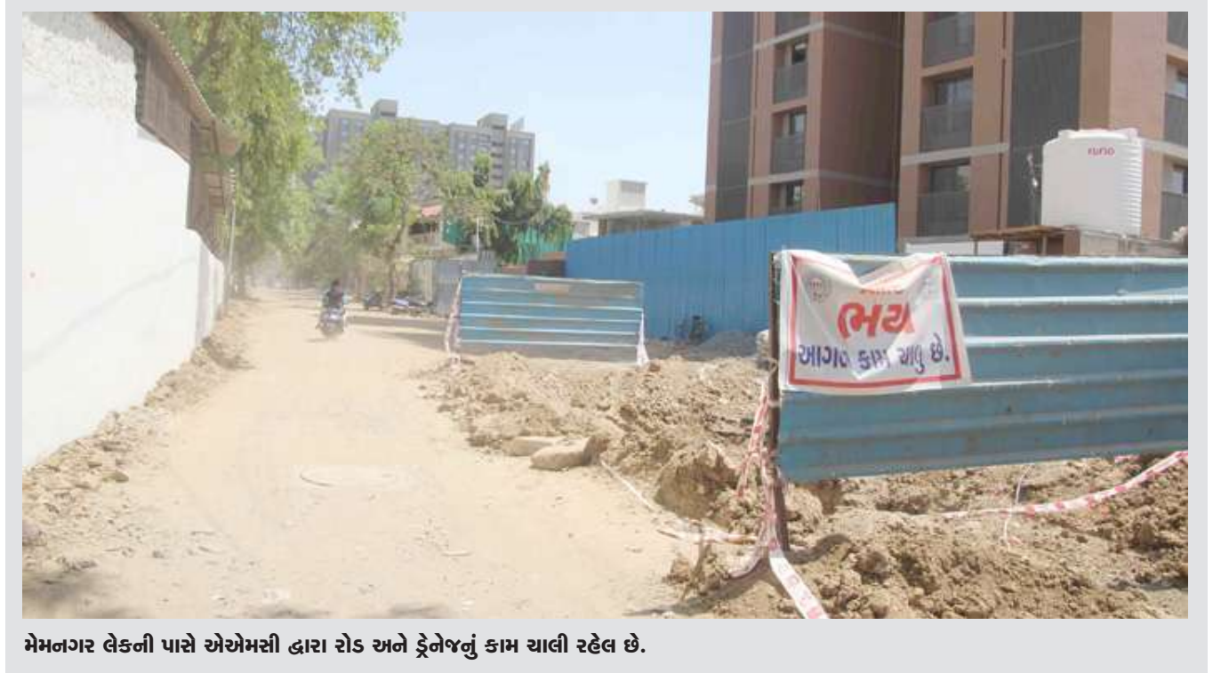
મેનનગર લેકની પાસે એએમસી દ્વારા રોડ અને ટ્રેનજનું કામ ચાલી રહેલ છે.

સંખ્યામાં પાટીદાર સમાજના લોકો ઉમટ્યા હતાં. આ કાર્યક્રમમાં વિશ્વ ઉમિયાધામનાં પ્રમુખ આર પી પટેલ, ભાજપ નેતા અને પૂર્વ નાયબ મુખ્યમંત્રી નીતિન પટેલ સહિત મોટી સંખ્યામાં ભાજપના નેતાઓ અને અગ્રણીઓ હાજર રહ્યા હતા. આ મંચ ઉપરથી નીતિન પટેલે ફરી એકવાર શબ્દોમાં ઊંડાણ હાક્યું. જાહેર મંચ ઉપરથી નીતિનભાઈ પટેલે નિવેદન આપ્યું હતું કે અમને સલાહ આપવાનું બંધ કરો જેના ઘરમાં પત્ની પાણીનો ગ્લાસ નથી પીવડાવતી તે અમને આવી સલાહ આપે છે. તો બીજી તરફ આર પી પટેલે પણ કહ્યું હતું કે લોકો અમને સલાહ આપે છે તે પહેલા પોતાનું ભલું કરે અમને સલાહ આપવાનું બંધ કરે. જોકે સલાહ એ થાય છે કે આ બંને પાટીદાર નેતા ને સલાહ કોણ આપે છે એબીપી અસ્મિતા જ્યારે તેમને પૂછ્યું ત્યારે બંને આ મુદ્દે ગોળ ગોળ જવાબ આપ્યો હતો.