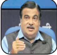
આધારે ચાર્જ વસૂલવામાં આવશે. કેન્દ્રીય મંત્રીએ વધુમાં દાવો કર્યો કે આ નવી સિસ્ટમ (સેટેલાઈટ આધારિત ટોલ કલેક્શન સિસ્ટમ) હેઠળ સમય અને નાણાંની બચત થશે. જો કે, પહેલા મહારાષ્ટ્રના સુંબઈથી પુણે સુધીની મુસાફરીને પૂર્ણ કરવા માટે નવ કલાકનો સમય લાગતો હતો, પરંતુ હવે તે માત્ર બે કલાકમાં પૂર્ણ કરી શકાય છે. કેન્દ્રીય મંત્રીએ અગાઉ ૧૮ માર્ચ, ૨૦૨૪ ના રોજ કહ્યું હતું કે મોદી સરકાર આગામી પાંચ વર્ષમાં તમામ ભારતીય શહેરોમાં અને દિલ્હી-શિમલા, દિલ્હી-ચંદીગઢ તેમજ સુંબઈ-પુણે જેવા કેટલાક લાંબા રૂટ પર ઈલેક્ટ્રિક બસો શરૂ કરવાની યોજના ધરાવે છે.

। (એજન્સી) નાગપુર, તા.૨૭ । કેન્દ્રીય માર્ગ અને પરિવહન મંત્રી નીતિન ગડકરીએ ટોલ ટેક્સને લઈને મોટું નિવેદન આપ્યું છે. તેમણે કહ્યું કે વડાપ્રધાન નરેન્દ્ર મોદીના નેતૃત્વમાં એનડીએ સરકાર ટોલ નાબૂદ કરવા જઈ રહી છે. બુધવારે (૨૭ માર્ચ, ૨૦૨૪) મહારાષ્ટ્રના નાગપુરમાં તેમણે કહ્યું - અમે ટોલ નાબૂદ કરવા જઈ રહ્યા છીએ. હવે આ કામ સેટેલાઈટના આધારે કરવામાં આવશે. અમે સેટેલાઈટ આધારિત ટોલ કલેક્શન સિસ્ટમ દ્વારા આ કરીશું. પૈસા તમારા ખાતામાંથી સીધા જ કપાઈ જશે અને વ્યક્તિ જેટલા કિલોમીટરની મુસાફરી કરશે તેના આધારે ચાર્જ વસૂલવામાં આવશે. કેન્દ્રીય મંત્રીએ વધુમાં દાવો કર્યો કે આ નવી સિસ્ટમ (સેટેલાઈટ આધારિત ટોલ કલેક્શન સિસ્ટમ) હેઠળ સમય અને નાણાંની બચત થશે. જો કે, પહેલા મહારાષ્ટ્રના સુંબઈથી પુણે સુધીની મુસાફરીને પૂર્ણ કરવા માટે નવ કલાકનો સમય લાગતો હતો, પરંતુ હવે તે માત્ર બે કલાકમાં પૂર્ણ કરી શકાય છે. કેન્દ્રીય મંત્રીએ અગાઉ ૧૮ માર્ચ, ૨૦૨૪ ના રોજ કહ્યું હતું કે મોદી સરકાર આગામી પાંચ વર્ષમાં તમામ ભારતીય શહેરોમાં અને દિલ્હી-શિમલા, દિલ્હી-ચંદીગઢ તેમજ સુંબઈ-પુણે જેવા કેટલાક લાંબા રૂટ પર ઈલેક્ટ્રિક બસો શરૂ કરવાની યોજના ધરાવે છે.