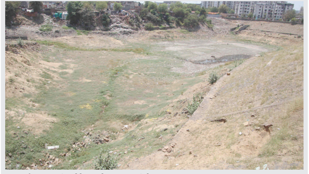
ઉનાળાની શરૂઆતમાં જ મેમેનગર લેક સુકાઈ ગયું છે.