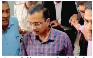
નીડર અને હિંમતવાન વ્યક્તિ છે. તેમને હું લાંબા આયુષ્ય, આરોગ્ય અને સફળતાની શુભેચ્છા પાઠવું છું. કેજરીવાલે કહ્યું છે કે મારું શરીર જેલમાં છે. પરંતુ, મારો આત્મા તમારા બધાની વચ્ચે છે. તમે તમારી આંખો બંધ કરશો, તો તમે મને તમારી આસપાસ અનુભવશો." સુનિતા કેજરીવાલે એમ પણ

। (એજન્સી) નવી દિલ્હી, તા.૨૭ । દિલ્હીના મુખ્યમંત્રી અરવિંદ કેજરીવાલ હાલમાં ઈડીની ફસ્ટીમાં છે જ્યાં તેમની તબિયત લથડી છે. સૂત્રોના કહેવા પ્રમાણે કેજરીવાલના લોહીમાં શુગરના લેવલમાં ઉતારચઢાવ આવી રહ્યો છે. છેલ્લે બ્લડ શુગરનું લેવલ ઘટીને ૪૬ પર આવી ગયું હતું જે ખતરનાક સ્થિતિ છે તેમ ડોક્ટરો જણાવે છે. કેજરીવાલના પત્ની સુનિતાએ એક વીડિયો જાહેર કરીને કહ્યું કે મંગળવારે સાંજે તેઓ જેલમાં પોતાના પતિને મળવા ગયા હતા. "અરવિંદ કેજરીવાલને ડાયાબિટીસ છે, સુગર લેવલ ઠીક નથી, પણ તેમનું મનોબળ મજબૂત છે. તેઓ સાચા દેશભક્ત,