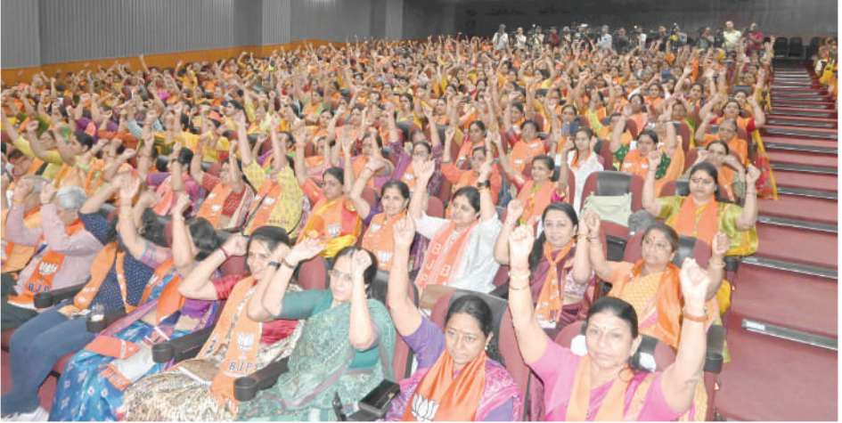
દિનેશ હોલમાં બીજેપી મહિલા મોરચાના પ્રોગ્રામમાં સીઆર પાટીલ ઉપસ્થિત રહ્યા હતા.