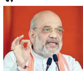
અહીંની કાયદો અને વ્યવસ્થા જમ્મુ-કાશ્મીર પોલીસને સોંપવામાં આવશે. કેન્દ્રીય ગૃહમંત્રીએ કહ્યું કે કેન્દ્ર સરકાર

। (એજન્સી) નવી દિલ્હી, તા.૨૭ । મોદી સરકાર જમ્મુ-કાશ્મીરમાંથી આર્મ્ડ ફોર્સ સ્પેશિયલ પાવર એક્ટ એટલે કે AFSPA હટાવવાની યોજના બનાવી રહી છે. કેન્દ્રીય ગૃહમંત્રી અમિત શાહે આ માહિતી આપી છે. એક મીડિયા ચુપને આપેલા એક ઈન્ટરવ્યુમાં શાહે કહ્યું કે જમ્મુ-કાશ્મીરમાંથી સેના પાછી ખેંચી લેવામાં આવશે અને