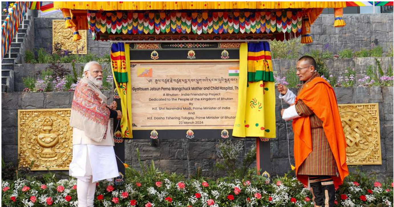
ભૂતાનમાં નરેન્દ્ર મોદી અને શ્રી શેરિંગ તોબગેએ થિમ્પુ ખાતે ગ્યાલ્સુએન જેત્સુન પેમા વાંગચુક મધર એન્ડ ચાઈલ્ડ હોસ્પિટલનું ઉદ્ઘાટન કર્યું.

। (એજન્સી) થિમ્પુ, તા. ૨૩ । વડાપ્રધાન નરેન્દ્ર મોદી ભૂતાનના પ્રવાસ પર છે. આજે સવારે પારો એરપોર્ટ પર વડાપ્રધાન મોદીનું ભૂતાનના વડાપ્રધાન શેરિંગ તોબગેએ સ્વાગત કર્યું. તાજેતરમાં જ દાશો શેરિંગ તોબગેએ પણ ૧૪-૧૮ માર્ચ સુધી ભારતનો પ્રવાસ કર્યો હતો. ભારતે પણ ભૂતાનના વડાપ્રધાનની ખાસ મેજબાની કરી હતી. હવે વડાપ્રધાન મોદી ભૂતાન પહોંચ્યા છે તો વડાપ્રધાન મોદીને જોવા માટે ત્યાંના લોકોનો ઉત્સાહ જોવા લાયક છે. વડાપ્રધાનના સ્વાગતમાં લોકો પારો એરપોર્ટથી રાજધાની થિમ્પુ સુધી ૪૫ કિલોમીટર રસ્તાની બંને તરફ લાઈનમાં જોવા મળ્યા. વડાપ્રધાનનું સ્વાગત કરવા માટે દરેક ઉમરના નાગરિક ભૂતાનના રસ્તાઓ પર નજરે આવ્યા. વડાપ્રધાન મોદીએ રાજધાની થિમ્પુ પહોંચ્યા બાદ રસ્તામાં ઉભા રહેલા લોકો સાથે મુલાકાત કરી અને ત્યાં હાજર બાળકો સાથે પણ વાતચીત કરી. વડાપ્રધાન મોદી આ પહેલા ૨૦૧૮માં ભૂતાન ગયા હતા. આ પ્રવાસમાં ભારત અને ભૂતાન વચ્ચે ઘણા કરાર થયા હતા. જેમાં આર્થિક સહયોગ અને કનેક્ટિવિટી જેવી મુખ્ય દ્વિપક્ષીય પરિયોજનાઓનો શુભારંભ કરવામાં આવ્યો હતો. હાલમાં જ ભૂતાનના વડાપ્રધાન શેરિંગ તોબગે ભારત પ્રવાસ કરીને ગયા છે, જેમાં તેમને ભારત સાથે આર્થિક સંબંધોની સાથે અલગ અલગ ક્ષેત્રોમાં દ્વિપક્ષીય સંબંધોને મજબૂત કરવા માટે બંને દેશની પ્રતિબદ્ધતાને જણાવી હતી. વડાપ્રધાન ભૂતાનમાં ૨૩ માર્ચ સુધી રહેશે.