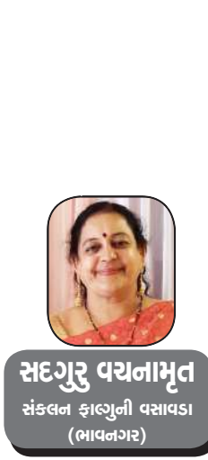
સદગુરુ વયનામૃત સંકલન ફાઉન્ડેશન વસાવડા (ભાવનગર)

શહેરીકરણની સૌથી મોટી ખોટ આપણને પડી હોય તો એ આ છે! કે દિવસે દિવસે ઓછી થતી જતી પક્ષીઓની પ્રજાતિ! આપણી આસપાસ કલબલતા પક્ષીઓ ઓછા થતા જાય છે, એની નોંધ બહુ ઓછાં લોકો લેતા હશે. એક ઘટાદાર વૃક્ષનું કપાવું એટલે ઓછામાં ઓછા ૧૦૦ માળાઓની જગ્યા ઓછી થવી, અંદાજે એ રીતે હિસાબ માંડીએ તો વિચારો વિકાસને નામે આપણાં કેટલા વૃક્ષો કપાયા, અને એ રીતે એ પક્ષીઓના રહેવાની જગ્યા ગઈ. પર્યાવરણમાં મુખ્ય ઘટક સમાન વૃક્ષો કપાવવાને કારણે ઓક્સિજન પણ દિવસે દિવસે ઘટતો જાય છે, એની લાલબત્તી તો કોરોના સમયથી થઈ ગઈ છે, પણ આપણે આપણા સુખ આડે એ બધું જોતા નથી. આજે ચકલી દિવસ નિમિત્તે ફલાણી જગ્યાએ ચકલીના માળાઓ નિ:શુલ્ક આપવામાં આવશે! કેટલાય વર્ષોથી ચકલીની પ્રજાતિ બચાવવા માટે સમાજની કેટલીય સેવાભાવી સંસ્થાઓ આ પ્રકારનું કાર્ય કરે છે, રસ્તા પર પણ ઘણા શ્રમજીવીઓ ચકલાના માળા વેચતા જોવા મળે છે. ચકલી દરેક પ્રાંતમાં અલગ અલગ નામથી ઓળખાય છે, હિન્દીમાં એને ચિડિયા કહી છે અને આપણા દેશનો પરિચય આપતાં ગીતમાં એનો ઉપયોગ છે. જહાં ડાલ ડાલ પર સોને કી ચીડિયા કરતી હેં ભસેરા વો ભારત દેશ હેં મેરા! ચકલીને લગતી બીજી કેટલીય બાબતો આપણે ગુગલ સર્ચ કરીને જાણી શકીશું અને ચકલી દિવસ નિમિત્તે સોશયલ મીડિયા પર એ પ્રકારના મેસેજ એ ધૂમ મચાવી હતી. પણ ચકલી એટલે એક પક્ષી એ રીતે જોઈએ તો, પ્રાણી અને પક્ષીમાં કોઈ બેઝિક તફાવત હોય તો એ છે, કે પક્ષી ઉડી શકે, અને પ્રાણી ઉડી ન શકે! પક્ષીને ઉડવા માટે પાંખ હોય જ્યારે પ્રાણીને ચાલવાનું હોય એટલે