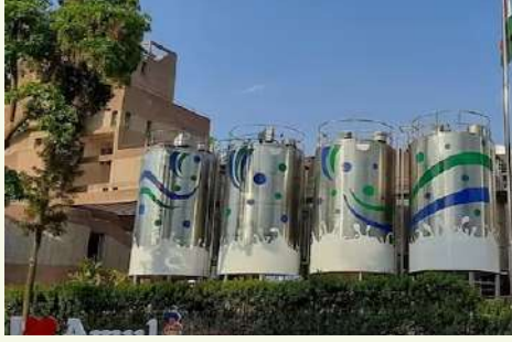
પ્રોડ્યુસર્સ અસોસિએશન (MMPA) વચ્ચે ભાગીદારી થઈ છે. ગુરુવારે MMPAની ૧૦૮મી વાર્ષિક મીટિંગ નોવી મિશિગન ખાતે યોજાઈ હતી. જેમાં આ જાહેરાત કરવામાં આવી હતી. આ જાહેરાત મિશિગન અને અમૂલ વચ્ચેના સંબંધોની જાળવી રાખવાની મહત્વની કડી બની છે. GCMMFના ફાઉન્ડર અને ચેરમેન ડૉ. વર્ગીસ કુરિયન મિશિગન સ્ટેટ યુનિવર્સિટીના ભૂતપૂર્વ

। (એજન્સી) વડોદરા, તા.૨૩ । દૂધનું નામ પડે એટલે ગુજરાત સહિત આખા ભારતમાં રહેતા લોકોના મગજમાં પહેલું નામ અમૂલનું આવી જાય. સહકારી દૂધ મંડળથી એક બ્રાન્ડ બનવાની અમૂલની સફર દરેક ભારતીયને ખબર હશે. અમૂલ ભારતની શ્રેષ્ઠતા છે અને તેને વૈશ્વિક ફલક પર લઈ જવાની દિશામાં કામ ચાલી રહ્યું છે. એક મહિના પહેલા જ વડાપ્રધાન નરેન્દ્ર મોદીએ અમૂલને વિશ્વની સૌથી મોટી ડેરી તરીકે વિકસિત થવાનું આહ્વાન કર્યું હતું. હવે એ દિશામાં આગળ વધતાં 'ધ ટેસ્ટ ઓફ ઇન્ડિયા'એ મોટી છલાંગ લગાવી છે. અમૂલે અમેરિકામાં તાજું દૂધ વેચવાનું શરૂ કર્યું છે. પહેલીવાર અમૂલનું તાજું દૂધ ભારતની બહાર લોન્ચ કરવામાં આવ્યું છે. ગુજરાત કો-ઓપરેટીવ મિલ્ક માર્કેટિંગ ફેડરેશન (GCMMF) અને યુએસની ૧૦મી સૌથી મોટી ડેરી કો-ઓપરેટિવ મિશિગન મિલ્ક