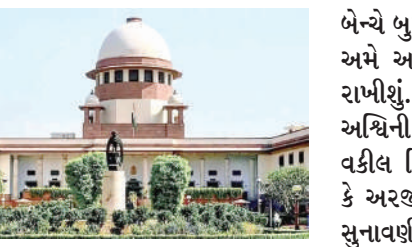
ભારતના મુખ્ય ન્યાયાધીશ (સીજેઆઈ) ડી.વાય. ચંદ્રચૂડ, જસ્ટિસ જે.બી. પારડીવાલા અને જસ્ટિસ મનોજ મિશ્રાની

। (એજન્સી) નવી દિલ્હી, તા.૨૦। સુપ્રીમ કોર્ટે ગુરુવારે સુનાવણી માટે એક પીઆઈએલ વિસ્ટેડ કરવા પર સહમતિ આપી દીધી છે. આ પીઆઈએલ રાજકીય પક્ષો દ્વારા ચૂંટણી દરમિયાન મફતની રેવડી એટલે કે મફત ભેટ કે યોજનાઓનો લાભ આપવાનો વાયદો કરવાની પ્રથા વિરુદ્ધ દાખલ થઈ હતી. ઉલ્લેખનીય છે કે ૧૮ એપ્રિલથી લોકસભા ચૂંટણી શરૂ થવાની છે.