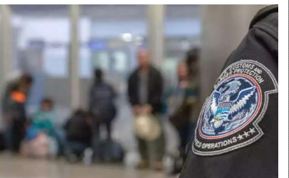
1 (એજન્સી) અમદાવાદ, તા.૨૦ |

ડોનાલ્ડ ટ્રમ્પ હાલ એવા દાવા કરી રહ્યા છે કે પોતે જો ફરી પ્રેસિડેન્ટ બનશે તો લાખો અન-ડોક્યુમેન્ટેડ ઈમિગ્રેન્ટ્સને ડિપોર્ટ કરી દેશે. જોકે, હોમલેન્ડ સિક્યોરિટીના આંકડાને ટાંકીને વોશિંગ્ટન પોસ્ટ નામના અમેરિકન અખબારે જે દાવો કર્યો છે તે દર્શાવે છે કે અમેરિકાએ મે ૨૦૨૩થી જ ડિપોર્ટશનની સંખ્યા ડબલ કરી દીધી છે, અને બોર્ડર કોસ કરીને ઈલીગલિ આવેલા લોકોના અસાયલમ એટલે કે શરણાગતિ માગવાના દાવા પણ મોટી સંખ્યામાં રિજેક્ટ કરવામાં આવી રહ્યા છે. વોશિંગ્ટન પોસ્ટનો દાવો છે કે એક વર્ષ પહેલા જેટલા લોકોના કેડિબલ ફિયર ઈન્ટરવ્યુ લેવામાં આવ્યા હતા તેની સંખ્યા પણ હવે બમણી થઈ ગઈ છે. અમેરિકાની સેનેટમાં ગયા મહિને એક બિલ લાવવામાં આવ્યું હતું, જેનો હેતુ ઈમિગ્રેશન ડિટેન્શન કેમ્પોલિટી વધારવા ઉપરાંત ડિપોર્ટશનની પ્રોસેસને ઝડપી બનાવવા માટે ૪૩૦૦ અસાયલમ ઓફિસર ડાયર કરવાનો હતો. જોકે, તેના માટે ૬ બિલિયન ડોલરની ફંડને મંજૂર કરવા લાવવામાં આવેલું આ બિલ પાસ નહોતું થઈ શક્યું. જો આ બિલ પાસ થઈ ગયું હોત તો અમેરિકામાં ઈલીગલિ એન્ટર થયેલા લોકોને લાંબો સમય જેલમાં રાખવા ઉપરાંત તેમને ડિપોર્ટ કરવાની કામગીરી ઝડપી બનાવી શકાઈ હોત. ડિપાર્ટમેન્ટ ઓફ