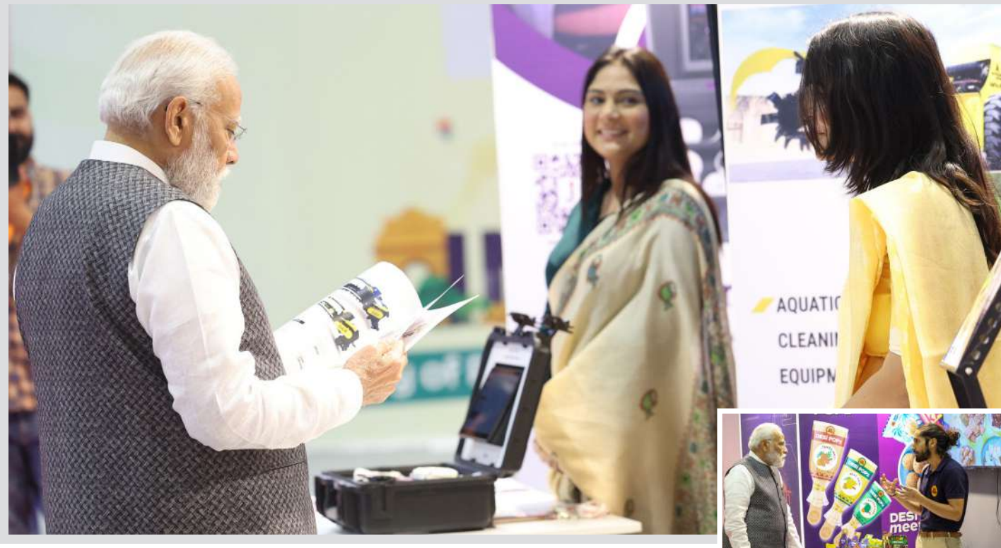
વડાપ્રધાન નરેન્દ્ર મોદીએ નવી દિલ્હીમાં ભારત મંડપમમાં સ્ટાર્ટ-અપ મહાકુંભ પ્રદર્શનની મુલાકાત કરી હતી.

! (એજન્સી) ઈસ્લામાબાદ, તા. ૨૦ | પૂર્વ પાકિસ્તાની ક્રિકેટર જાવેદ મિયાંદાદ અને અંડર વર્લ્ડ ડોન દાઉદ ઈબ્રાહીમના સંબંધો કોઈથી છૂપા નથી. બંને એકબીજાના વેવાઈ છે. હવે વરને કોણ વખાણે તો કહે વરની મા એ નાતે જાવેદ મિયાંદાદે ડોન દાઉદ ઈબ્રાહીમના ભરી ભરીને વખાણ કર્યા છે. મુંબઈમાં ૧૯૮૩માં થયેલા ભયાનક બોમ્બ બ્લાસ્ટનો મુખ્ય આરોપી દાઉદ ઈબ્રાહિમ ફરી એકવાર ચર્ચામાં છે. જેને ચર્ચામાં લાવનાર છે પાકિસ્તાનનો એક પૂર્વ ક્રિકેટર. તેણે તાજેતરમાં દાઉદ ઈબ્રાહિમના ખૂબ વખાણ કર્યા હતા. એક પાકિસ્તાની પત્રકારની યુટ્યુબ ચેનલને આપેલા ઈન્ટરવ્યુમાં ક્રિકેટર જાવેદ મિયાંદાદે અંડરવર્લ્ડ ડોન દાઉદ ઈબ્રાહિમના વખાણ કરતા કહ્યું હતું.