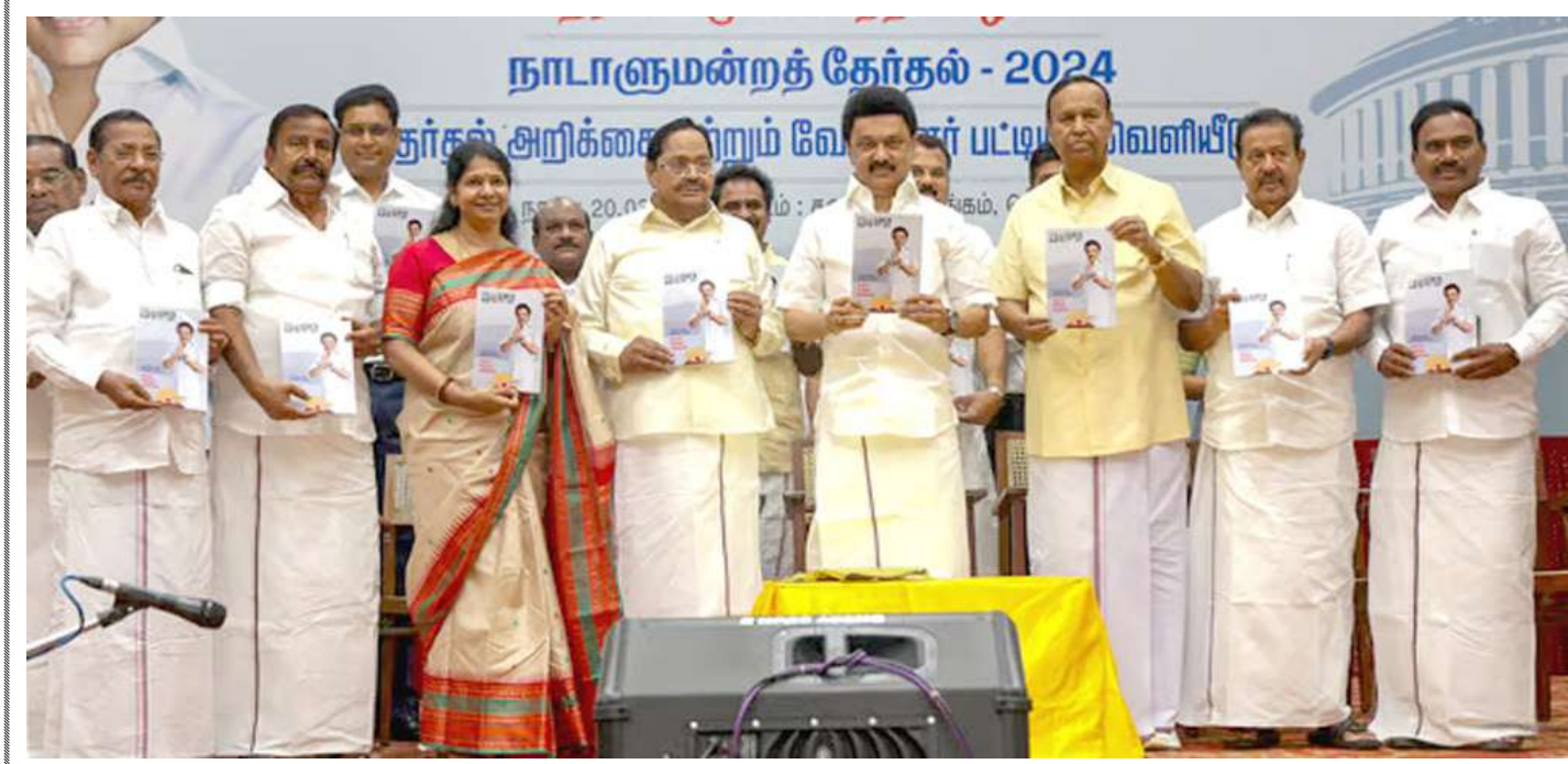
તામિલનાડુના સીએમ અને ડીએમકેના વડા એમકે સ્ટાલિન પદના નેતા કનિમોગી સાથે ચેન્નાઈમાં પાર્ટીની બેઠક દરમિયાન પદના ઉમેદવારોની યાદી અને ટંદેરો જાહેર કરવામાં આવ્યો હતો.

ભાજપે ૩૦૩ બેઠકો પર જીત મેળવી હતી, તે જોતા તેને એક બેઠક સરેરાશ પોણા ચાર કરોડ રૂપિયામાં પડી હતી. કોંગ્રેસે બાવન બેઠકો મેળવી હતી. આ વખતની લોકસભાની ચૂંટણીમાં આશરે ૧.૨૦ લાખ કરોડ રૂપિયા ખર્ચ થવાનું અનુમાન છે, જેમાં ચૂંટણી પંચના ખર્ચનો હિસ્સો માત્ર ૨૦ ટકા