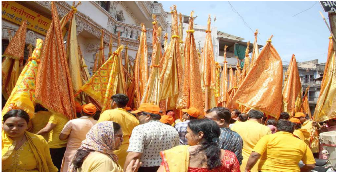
દરિયાપુર તીન ભત્તી પાસે આવેલ ખાદુરશ્યામ મંદિરમાં હજારોની સંખ્યામાં ભાવિક ભક્તો દ્વારા ઘણા ચઢાવવામાં આવી હતી.