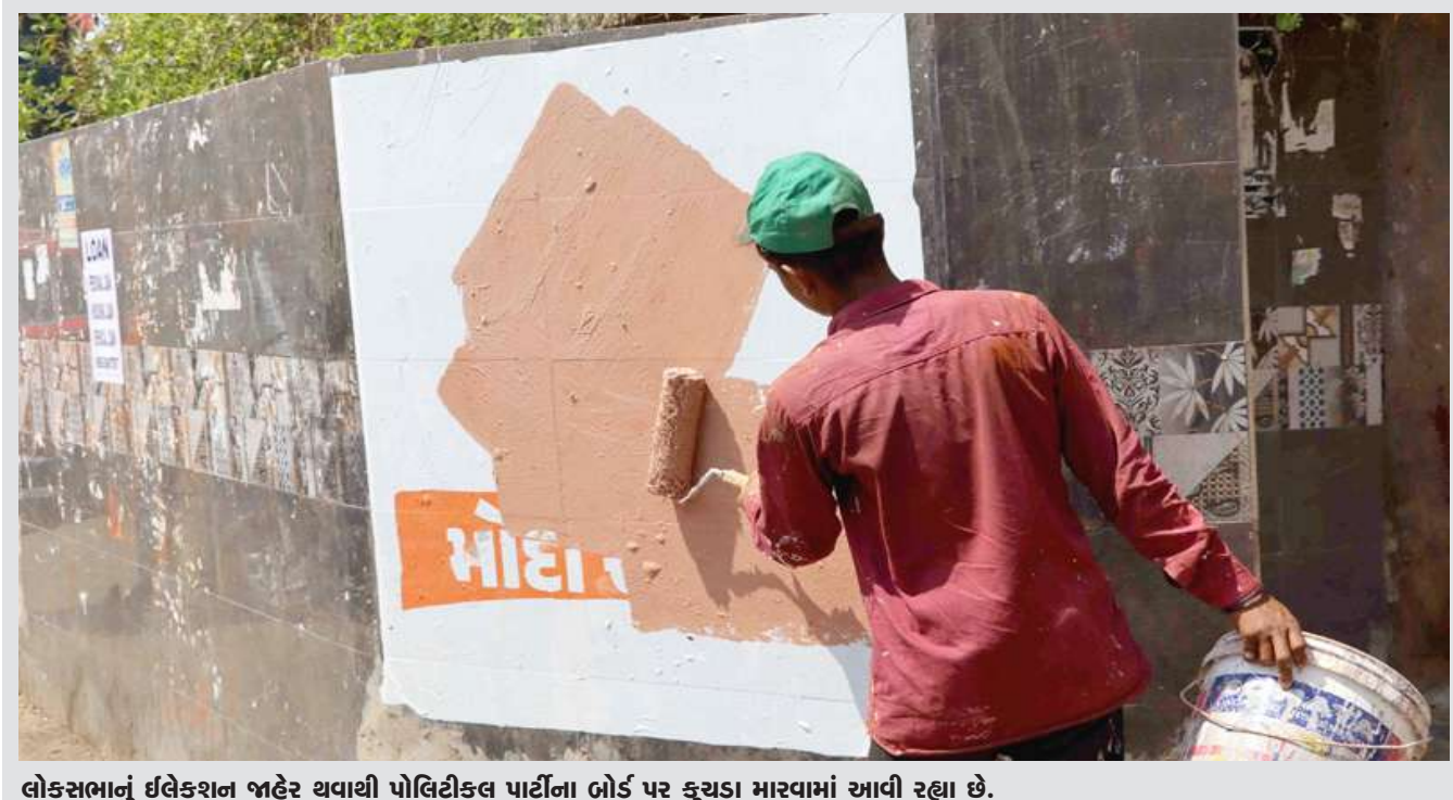
લોકસભાનું ઇલેક્શન જાહેર થવાથી પોલિટીકલ પાર્ટીના ભોંડ પર કુચડા મારવામાં આવી રહ્યા છે.

હોમલેન્ડ સિક્યોરિટી દ્વારા મે ૨૦૨૩થી લઈને ફેબ્રુઆરી ૨૦૨૪ના ગાળામાં ૧.૧૫ લાખ માર્ગચૂંટના કેડિબલ ફિયર ઈન્ટરવ્યુ લેવામાં આવ્યા હતા. અમેરિકન મીડિયાના રિપોર્ટ અનુસાર ડિપાર્ટમેન્ટ ઓફ હોમલેન્ડ સિક્યોરિટીએ ૧,૦૦૦ જેટલા અસાયલમ ઓફિસરને આ કામમાં લગાડ્યા છે, અને આવનારા સમયમાં તેને વધુ ઝડપી બનાવવા વધુ ઓફિસરને ટ્રેનિંગ અપાઈ રહી છે. જોકે, હકીકત એ પણ છે કે જે ગાળામાં બોર્ડર કોસ કરીને આવેલા ૧.૧૫ લાખ માર્ગચૂંટના કેડિબલ ફિયર ઈન્ટરવ્યુ લેવામાં આવ્યા હતા તે જ ગાળામાં બોર્ડર કોસ કરનારા લોકોની સંખ્યા ૧૭ લાખ નોંધાઈ હતી, મતલબ કે બોર્ડર કોસ કરીને આવનારા ૧૦ ટકાથી પણ ઓછા લોકોના કેડિબલ ફિયર ઈન્ટરવ્યુ થઈ શક્યા હતા. હાલ સ્થિતિ એ છે કે અમેરિકા પાસે બોર્ડર કોસ કરીને આવેલા લોકોને ડિટેન્શનમાં રાખવાની જગ્યા ના હોવાથી માર્ગચૂંટને કોર્ટમાં હાજર થવાની તારીખ આપીને રિલીઝ કરવામાં આવી રહ્યા છે. જે રીતે આખીય સિસ્ટમ અપગ્રેડ કરાઈ રહી છે તેને જોતા એવું ચોક્કસ કહી શકાય કે ટ્રમ્પ ફરી અમેરિકાના પ્રેસિડેન્ટ બને કે ના બને, પરંતુ હવે અસાયલમ માટે ખોટા દાવાઓ કરતા અન-ડોક્યુમેન્ટેડ ઈમિગ્રેન્ટ્સ પર સંકેતે કસવાની અમેરિકા પૂરી તૈયારી કરી રહ્યું છે.