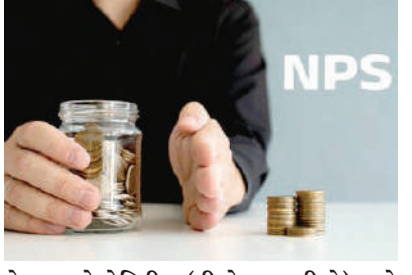
મેન્ટ ઓથોરિટી (પીએફઆરડીએ) એ માહિતી આપી હતી કે તે તેમની સિક્યુરિટી ફીચર્સને વધારવા જઈ રહી છે. હવે

। (એજન્સી) નવી દિલ્હી, તા.૨૦। જો તમે નેશનલ પેન્શન સિસ્ટમ (એનપીએસ)ના ખાતાધારક છો, તો આ સમાચાર તમારા માટે છે. પેન્શન ફંડ નિયામક (પીએફઆરડીએ)એ નેશનલ પેન્શન સિસ્ટમ (એનપીએસ)ની હાલની લોગિન પ્રક્રિયામાં કેટલાક ફેરફાર કરવાનો નિર્ણય કર્યો છે. આ નવા નિયમો આગામી તા. ૧ એપ્રિલ ૨૦૨૪ એટલે કે આવતા મહિનાથી લાગુ કરવામાં આવશે. પેન્શન ફંડ રેગ્યુલેટરી એન્ડ ડેવલપ