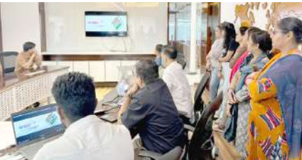
જેવી બાબતોની વિસ્તૃત જાણકારી આપવામાં આવી હતી...