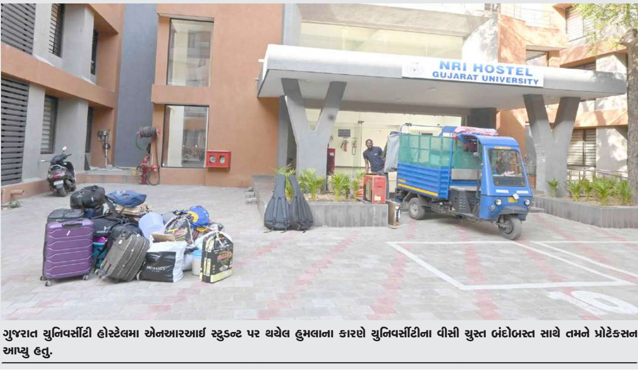
ગુજરાત યુનિવર્સિટી હોસ્ટેલના એનઆરઆઈ સ્ટુડન્ટ પર થયેલ હુમલાના કારણે યુનિવર્સિટીના વીસી યુસ્ત ઊંદોબસ્ત સાથે તમને પ્રોટેક્શન આપ્યું હતું.