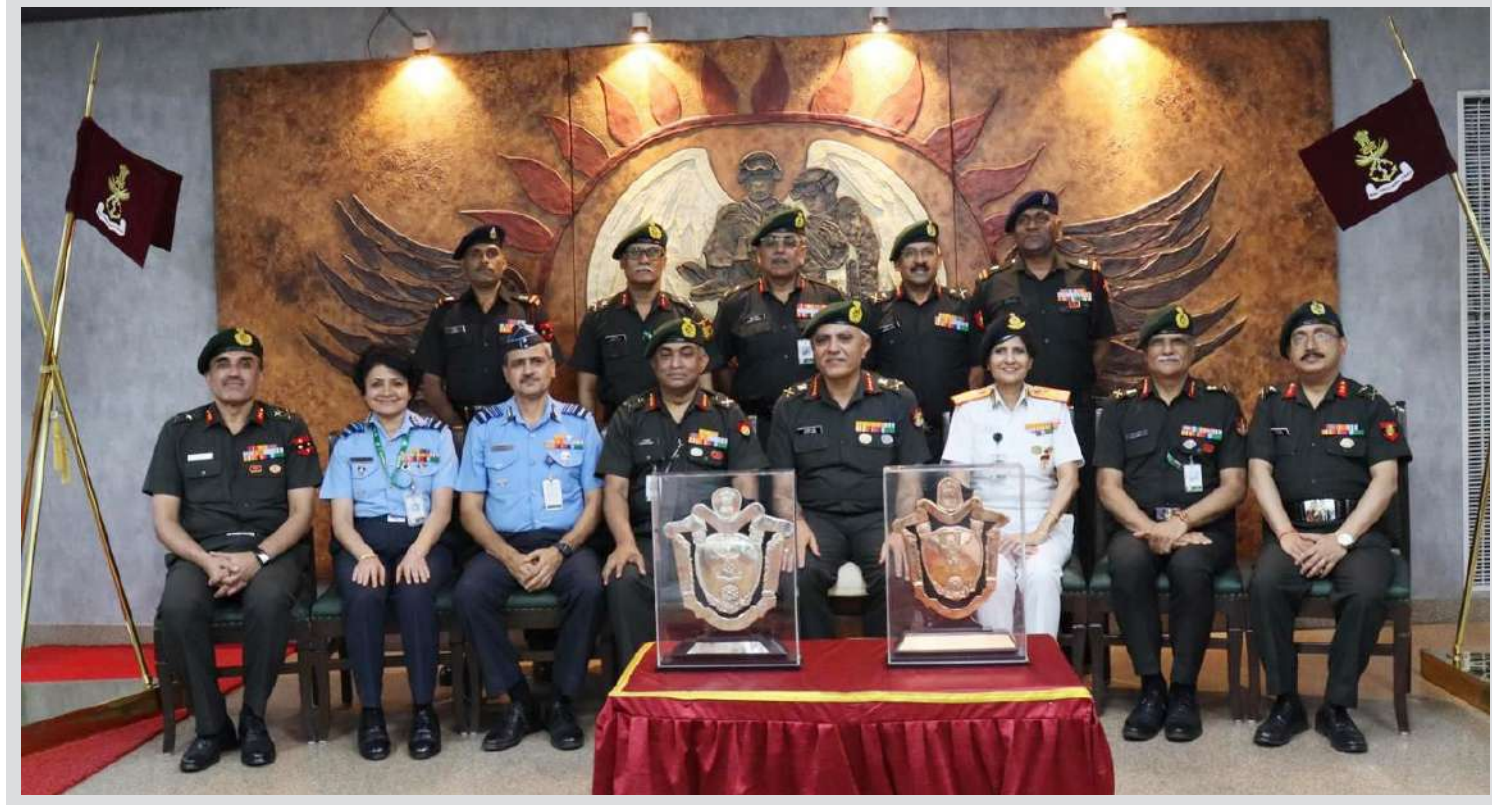
નવી દિલ્હીમાં સશસ્ત્ર દળ તબીબી સેવાઓના મહાનિર્દેશક અને વરિષ્ઠ કર્નલ કમાન્ડ, આર્મી મેડિકલ કોર્પ્સ લેફ્ટનન્ટ જનરલ દલજીત સિંઘ વર્ષ ૨૦૨૨ માટે આર્મ્ડ ફોર્સિસ મેડિકલ સર્વિસીસ (AFMS)ની શ્રેષ્ઠ અને બીજી શ્રેષ્ઠ કમાન્ડ હોસ્પિટલ માટે રક્ષા મંત્રીની ટ્રોફી એનાયત કરવામાં આવી.

1 (એજન્સી) નવી દિલ્હી, તા. ૧૯ । ભારતના નીરજ ચોપરા અને પાકિસ્તાનના અરશદ નદીમ જેવેલીન સુપરસ્ટાર છે. બંને એથલેટ આગામી આઉટડોર સીઝન માટે તૈયારી કરી રહ્યા છે. નીરજ ચોપરા હાલમાં તુર્કીમાં ટ્રેનિંગ લઈ રહ્યો છે, જ્યારે ૨૭ વર્ષીય નદીમ એક મોટા પડકારનો સામનો કરી રહ્યો છે. નદીમે તાજેતરમાં કહ્યું હતું કે તે ઘણા વર્ષોથી ઈન્ટરનેશનલ લેવેલના ભાલા મેળવવા માટે સંઘર્ષ કરી રહ્યો છે. તેણે જણાવ્યું કે તે છેલ્લા ૭-૮ વર્ષથી એક જ જેવેલીનનો ઉપયોગ કરી રહ્યો છે. વિશ્વ અને વર્તમાન ઓલિમ્પિક ગેમ્સિયાન નીરજ ચોપરા આ સાંભળીને ખૂબ જ નિરાશ છે. સ્પોર્ટ્સ ઓથોરિટી ઓફ ઈન્ડિયા (એસએઆઈ)ના નિવેદન અનુસાર ગયા વર્ષે બુડાપેસ્ટમાં વર્લ્ડ એથલેટિક્સ ગેમ્સિયાનમાં નીરજ ચોપરાએ નદીમ સાથે ભાગ લીધો હતો. જેમાં તે નીરજ ચોપરા બાદ બીજા સ્થાને રહ્યો હતો.