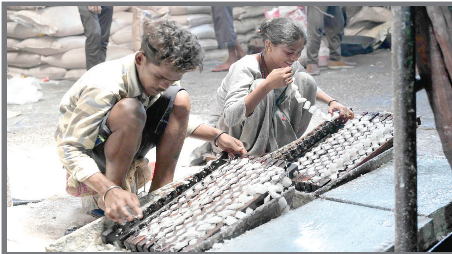
હોળી ધુળેટીના તહેવારમાં ભગવાનને ધરાવવા માટે હાચડા બનાવી રહેલ કરીગર.

। (એજન્સી) હિંમતનગર, તા.૧૯ । હિંમતનગર શહેરની આર્ટસ એન્ડ કોમર્સ કોલેજના મુખ્ય માર્ગ પર જ દબાણો વધવાને લઈ વિદ્યાર્થીઓને માટે સમસ્યા સર્જાઈ હતી. વિદ્યાર્થીઓની અવર જવરથી લઈને વિદ્યાર્થીઓની સલામતી માટે પાલિકા દ્વારા આ મામલે દબાણો દૂર કરવાની કાર્યવાહી શરૂ કરવામાં આવી હતી. પાલિકા દ્વારા બુલડોઝર ફેરવીને દબાણોને દૂર કરવાની કાર્યવાહી કરવામાં આવી હતી. આર્ટસ એન્ડ કોમર્સ કોલેજમાં દરરોજ ત્રણ થી ચાર હજાર વિદ્યાર્થીઓની અવરજવર રહેતી હોય છે. સાયન્સ, ફાર્મસી અને આર્ટસ એન્ડ કોમર્સ કોલેજના વિદ્યાર્થીઓ માટેનો મુખ્ય માર્ગ પર જ દબાણકારો દબાણ કરી દેવામાં આવ્યા હતા. તેમજ રોડ પર જ પાર્કિંગ કરી દેવામાં આવતા હતા અને જેની પર ટોળા વળીને દબાણકારોને ગ્રાહકો અને અન્ય ટોળાઓ બેસી રહેતા હોવાની ફરિયાદો ઉઠી હતી.