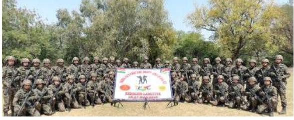
। નવી દિલ્હી, તા.૧૮ । ભારતીય સેના અને સેશેલ્સ સંરક્ષણ દળો (એસડીએફ) વચ્ચે સંયુક્ત સૈન્ય ક્વાયટ "એલએમઆઈ ટીઆઈવાયઈ-૨૦૨૪"ની દસમી આવૃત્તિમાં ભાગ લેવા માટે ભારતીય સૈન્યની ટુકડી આજે સેશેલ્સ જવા રવાના થઈ હતી. આ સંયુક્ત ક્વાયટ ૧૮થી ૨૭ માર્ચ, ૨૦૨૪ સુધી સેશેલ્સમાં હાથ ધરવામાં આવશે. કેઓલ ભાષામાં 'લેમિટીવાય' અર્થાત 'ફેન્ડશિપ' એ દિવાપિંક તાલીમ કાર્યક્રમ છે અને ૨૦૦૧થી સેશેલ્સમાં તેનું આયોજન કરવામાં આવે છે. આ ક્વાયટમાં ભારતીય સેનાની ગોરખા રાઈફલ્સ અને સેશેલ્સ ડિફેન્સ ફોર્સિસ (એસડીએફ)ના ૪૫-૪૫ જવાનો ભાગ લેશે. આ ક્વાયટનો ઉદ્દેશ શાંતિ જાળવણી કામગીરીઓ પર સંયુક્ત રાષ્ટ્રના ચાર્ટરનાં સાતમા પ્રકરણ હેઠળ અર્ધ-શહેરી વાતાવરણમાં પેટા-પરંપરાગત કામગીરીમાં