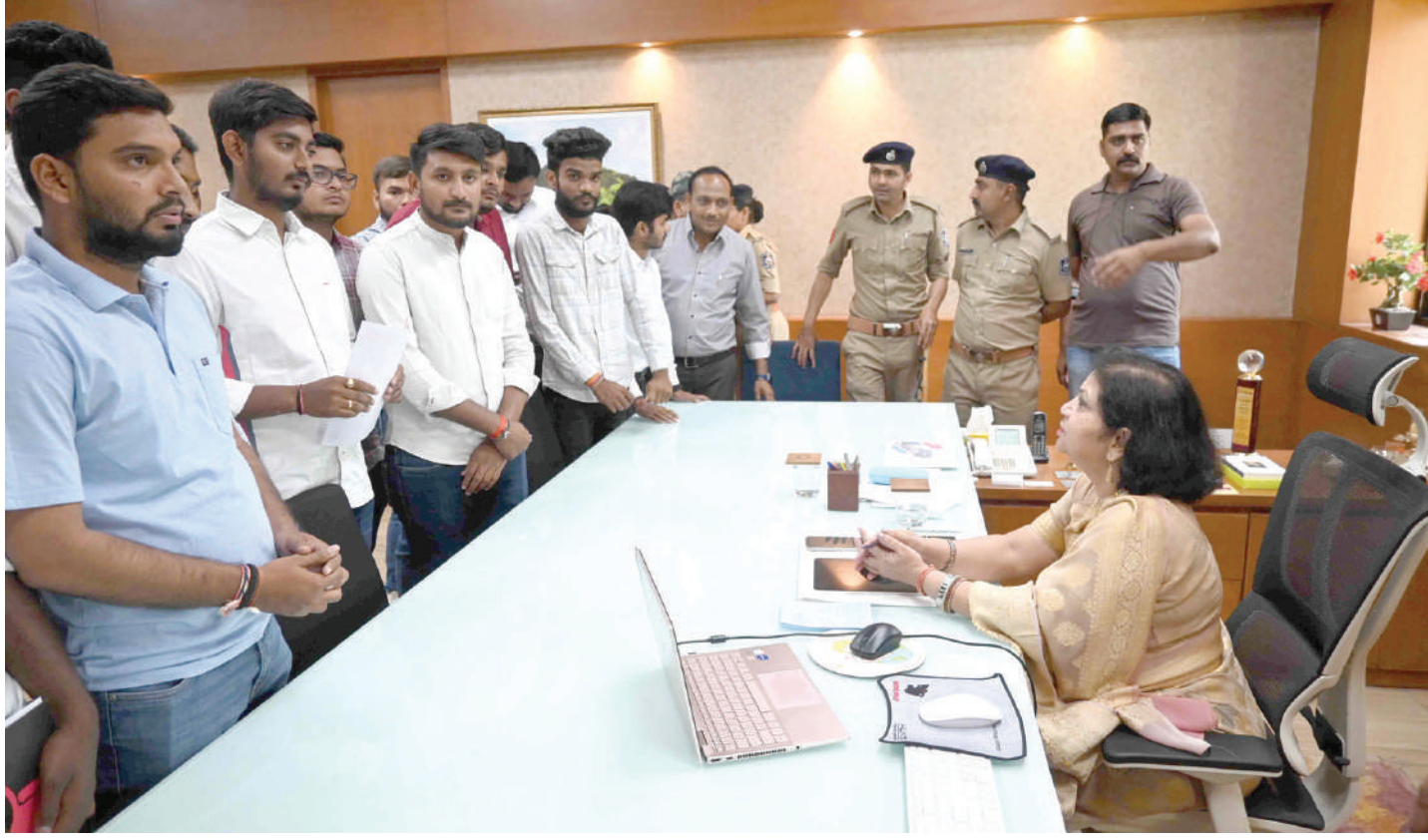
ગુજરાત યુનિવર્સિટી હોસ્ટેલમાં થયેલ હુમલાના વિરોધમાં વિદ્યાર્થીઓ દ્વારા યુનિવર્સિટીના વાઈસ ચાન્સેલરને રજુઆત કરવામાં આવી હતી.

। (એજન્સી) અમદાવાદ, તા.૧૮ । ગુજરાત યુનિવર્સિટી કેમ્પસમાં નમાઝ અદા કરવાના પ્રકરણમાં પાંચ વિદેશી વિદ્યાર્થીઓ પર હુમલાના કેસમાં સુઓમોટો સંજ્ઞાન હઈ પીઆઈએલ દાખલ કરવા એક એડવોકેટ દ્વારા કરાયેલી માંગણી ગુજરાત હાઈકોર્ટ ધરાવે ફગાવી દીધી હતી. ચીફ જસ્ટિસ સુનિતા અચવાલ અને જસ્ટિસ અનિરુધ્ધા માયીની ખંડપીઠે ઠરાવ્યું હતું કે, આ કોઈ પીઆઈએલની મેટર નથી. આ મામલામાં પોલીસ તેની રીતે જોશે અને તપાસ કરશે. દરેક બાબતમાં કંઈ જાહેરહિતની રિટ અરજીની મેટર ગણી શકાય નહીં. આ વિષય પોલીસ તપાસનો છે. હાઈકોર્ટે એડવોકેટની માંગણી ધરાવે ફગાવી દીધી હતી અને તેમને કોઈપણ પ્રકારની રાહત આપવાનો સાફ ઈન્કાર કરી દીધો હતો. હાઈકોર્ટે જણાવ્યું કે, તમે પોલીસમાં જાઓ. આ પોલીસ ક્રિયાદની વાત છે. અદાલતનું કામ પોલીસ ઈન્સ્પેક્ટરની જેમ વર્તવાનું નથી. અમે કંઈ તપાસનીશ અધિકારી નથી.