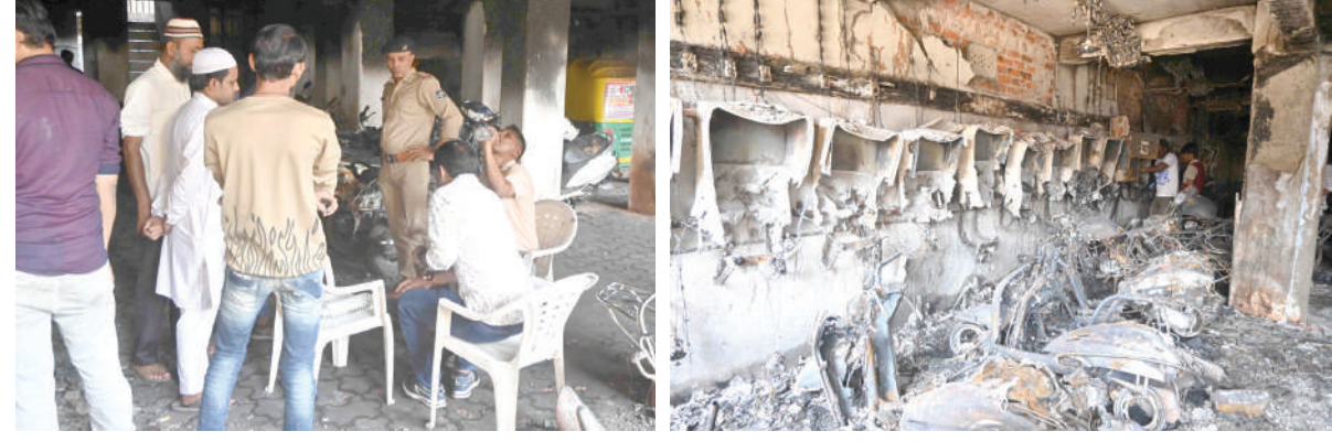
વહેલી સવારે જુહાપુરા ફતેવાડી વિસ્તારના એક એપાર્ટમેન્ટમાં અસામાજિક તત્વો દ્વારા આગ લગાડાઈ હતી. ફાયર ટીમે ભારે જહેમત બાદ આગને કાબુમાં લીધી હતી.