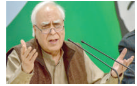
1 નવી દિલ્હી, તા. ૧૫ ।

ક્યાંકને ક્યાંક લાભના બદલામાં લાભ આપવાનું કામ થયું : કપિલ સિંઘલ