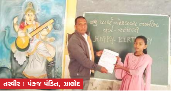
તસ્વીર : પંકજ પંડિત, ઝાલોદ

। (પ્રતિનિધી) ઝાલોદ, તા.૧૫ । સંજેલી તાલુકામાં આવેલ જય અંબે એજ્યુકેશન ચેરીટેબલ ટ્રસ્ટ પ્રેરિત ન્યુ પાર્થ એકલવ્ય તાલીમ વર્ગ સંજેલી કાર્યરત છે જેમાં ધોરણ ૫ માં અભ્યાસ કરતા વિદ્યાર્થીઓ એકલવ્ય મોડેલ રેસીડેન્સીયલ સ્કૂલ પ્રવેશ પરીક્ષાની તૈયારી કરાવવામાં આવે છે. તમામ બાળકોને એકલવ્યના અભ્યાસ ક્રમ પ્રમાણે છેલ્લા ૧૮ વર્ષથી સંજેલી - મોરા - સુખસર તાલીમ કેન્દ્રો કાર્યરત છે. જય અંબે એજ્યુકેશન ચેરીટેબલ ટ્રસ્ટના પ્રમુખશ્રી અને ન્યુ પાર્થ એકલવ્ય તાલીમ કેન્દ્રના સંચાલક શ્રી દિલીપ