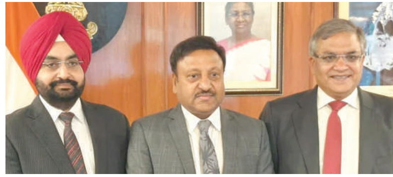
૧૦ માર્ચે તારીખોની જાહેરાત કરી હતી. પ્રથમ તબક્કાનું મતદાન ૧૧ એપ્રિલે અને

ચૂંટણી પંચે તેના સત્તાવાર સોશિયલ મીડિયા હેન્ડલ એક્સ પરથી પોસ્ટ કરીને કહ્યું હતું કે, 'ચૂંટણી પંચ દ્વારા આવતીકાલે એટલે કે ૧૬ માર્ચ બપોરે ૩ વાગે લોકસભા ચૂંટણી ૨૦૨૪ અને કેટલાક રાજ્યોની વિધાનસભા ચૂંટણીના કાર્યક્રમની જાહેરાત કરવા માટે એક પત્રકાર પરિષદનું આયોજન કરવામાં આવશે. ચૂંટણી પંચના સોશિયલ મીડિયા પ્લેટફોર્મ પર તેનું લાઈવ સ્ટ્રીમિંગ થશે. ૨૦૧૯માં લોકસભાની ચૂંટણી સાત તબક્કામાં યોજાઈ હતી. તે વખતે ચૂંટણી પંચે