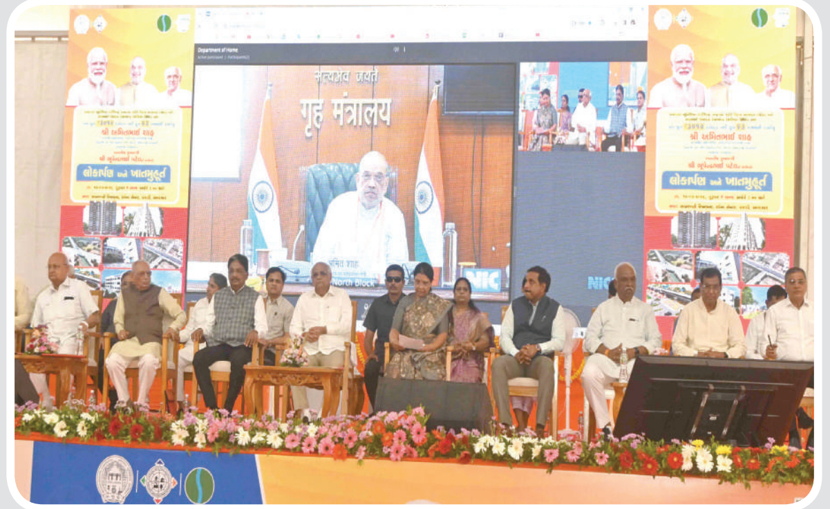
સાબરમતી રિવરફ્રન્ટ ગ્રાઉન્ડમાં BJP અને છસ્ર દ્વારા બનાવેલ પ્રોજેક્ટનું લોકાર્પણ ગુજરાતના મુખ્યમંત્રી ભૂપેન્દ્ર પટેલના હસ્તે થયું હતું.