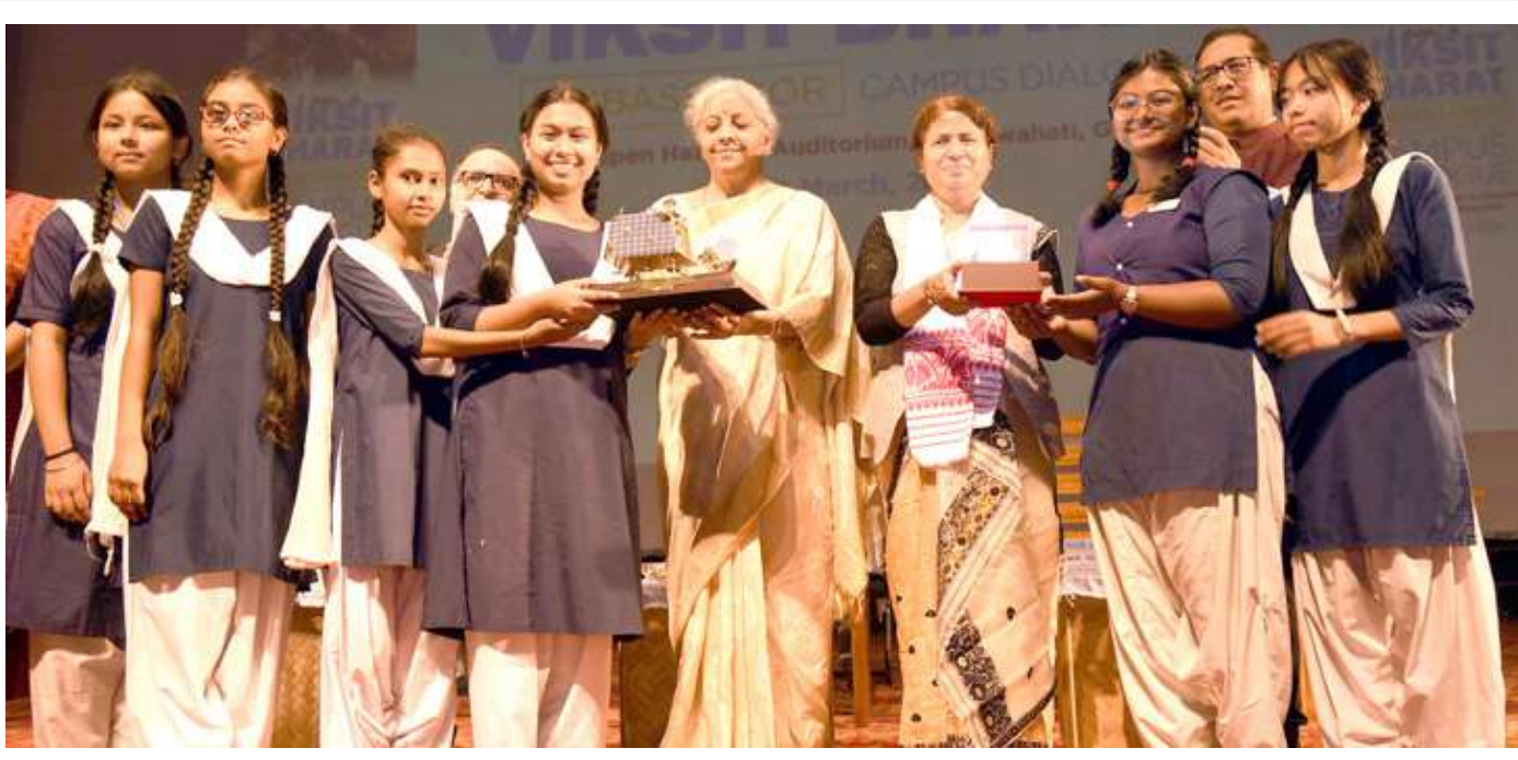
આસામના ઈન્ડિયન ઈન્સ્ટિટ્યૂટ ઓફ ટેકનોલોજી ગુવાહાટીમાં વિકસિત ભારત કેમ્પસ ડાયલોગના એક કાર્યક્રમમાં ગુવાહાટીની સરકારી શાળાઓના વિદ્યાર્થીઓને ચંદ્રયાન-૩ની પ્રતિકૃતિ રજૂ કરતા કેન્દ્રીય મંત્રી નિર્મલા સીતારમણ.

। (એજન્સી) ટોક્યો, તા.૧૪ । જાપાનનું એક શહેર એક બિલાડીના કારણે હાઈ એલર્ટ પર છે. આ બિલાડી મોડી રાત્રે ગાયબ થવા પહેલા ખતરનાક રસાયણોના એક ટેકમાં પડી ગઈ હતી. હિરોશિમાના કુકુયામામાં અધિકારીએ જણાવ્યું કે, તેમણે પેટ્રોલિંગ વધારી દીધું છે અને ત્યાંના રહેવાસીઓને આ બિલાડી પાસે ન જવાની ચેતવણી આપી છે જેને છેલ્લી વખત સુરક્ષા ફોર્સેસ રવિવારે એક પ્લેટિંગ ફેક્ટરીમાંથી નીકળતા જોઈ હતી. અધિકારીઓએ જણાવ્યું કે સોમવારે એક કાર્યકર્તા દ્વારા શોધવામાં આવેલા પંજાના નિશાનથી હેકસાવલેન્ટ કોમ્પોઝિટ ૩-મીટર ઊંડી ટાંકી મળી આવી હતી જે એક કેન્સરનું પેદા કરનારું રસાયણ છે જેને સ્પર્શ કરવાથી અથવા શ્વાસ લેવા પર ફોલ્ડીઓ અને સોજો આવી શકે છે. કુકુયામા સિટી હોલના એક અધિકારીએ જણાવ્યું કે આસપાસની તલાશી દરમિયાન હજુ સુધી બિલાડી નથી મળી અને તે પણ સ્પષ્ટ નથી કે તે જીવિત છે કે નહીં. નોમુરા મેક્કી કુકુયામા ફેક્ટરીના મેનેજર અકીહિરો કોબાયાશીએ જણાવ્યું હતું કે જ્યારે કામદારો સમાહના અંતે કામ પર પરત ફર્યા ત્યારે કેમિકલ વૈટને ઠીંકવામાં આવતી એક શીટ આંશિક રીતે કાટેલી મળી આવી. તેમણે કહ્યું કે કમ્પોઝિટ ઓક્સિજન બિલાડીની તલાશી કરી રહ્યા છે. કોબાયાશીએ કહ્યું કે, ફેક્ટરીના કમ્પોઝિટો સામાન્ય રીતે સુરક્ષાત્મક કપડા પહેરે છે.