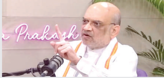
(સુધારા) કાયદામાં કોઈની કોઈ જોગવાઈ નથી. CAA નાગરિકતા છીનવી લેવાની દ્વારા ભાજપ નવી વોટ બેંક

ઈન્ટરવ્યુમાં કહ્યું, 'CAA કાયદો ક્યારેય પાછો ખેંચવામાં આવશે નહીં. આપણા દેશમાં ભારતીય નાગરિકતા સુનિશ્ચિત કરવી એ અમારો સાર્વભૌમ અધિકાર છે, અમે તેની સાથે ક્યારેય બાંધછોડ કરીશું નહીં.' અગાઉ મંગળવારે કેન્દ્રીય ગૃહમંત્રી અમિત શાહે ખાતરી આપી હતી કે, નાગરિકતા