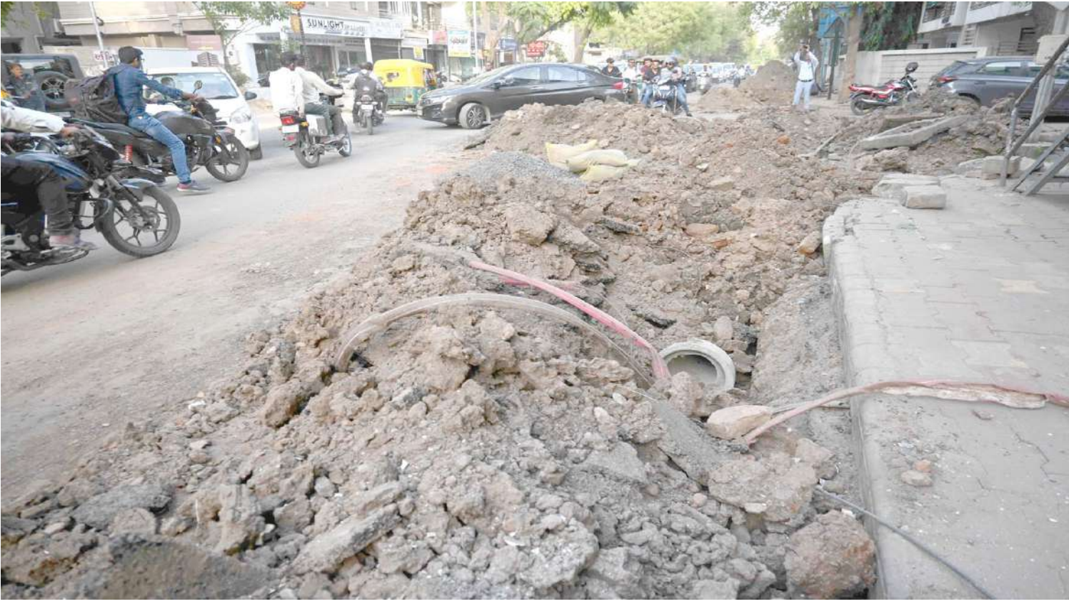
AMC દ્વારા નારાયણપુરા પંચશીલ ચાર રસ્તા પાસે કામ ચાલી રહેલ છે.