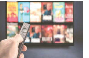
પ્લેટફોર્મ અને વેબસાઈટ્સને બ્લોક કરવામાં આવી છે. માહિતી અને પ્રસારણ મંત્રાલયે જણાવ્યું કે બિભત્સ સામગ્રી પીરસવા સામે વારંવાર ચેતવણી આપવા છતાં પગલાં લેવાયા ન હતા. તેના કારણે ૧૮ ઓટીટી પ્લેટફોર્મને બ્લોક કરવામાં આવ્યા છે. કુલ ૧૯ વેબસાઈટ, ૧૦ એપ અને ૫૭ સોશિયલ મીડિયા એપ્લિકેશન

। (એજન્સી) નવી દિલ્હી, તા.૧૪ । ભારતમાં એક સમયે બિભત્સ સામગ્રી પર આકરા નિયંત્રણો હતા પરંતુ ઓટીટી અને ઈન્ટરનેટના જમાનામાં બિભત્સ કન્ટેન્ટની આખી દુનિયા ખુલી ગઈ છે. તેના કારણે સમાજ પર પડતી વિપરીત અસરને ધ્યાનમાં રાખીને સરકારે આજે ૧૮ ઓટીટી પ્લેટફોર્મ અને ૧૯ વેબસાઈટ્સને બ્લોક કરી છે. ઓટીટી પ્લેટફોર્મ પર અશ્લિલ વીડિયો પ્રસારિત કરવામાં આવતા હોવાની ઘણા સમયથી ફરિયાદ થઈ હતી. આ વિશે અનેક વખત ચેતવણી આપવામાં આવી હતી છતાં સ્થિતિમાં કોઈ સુધારો ન થવાના કારણે આ ઓટીટી