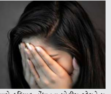
સામે ફરિયાદ નોંધાવવા પોલીસ સ્ટેશને પહોંચી ત્યાર પછી તેને રાજીનામું આપવાની ફરજ પાડવામાં આવી હતી. તેને એક કોરા