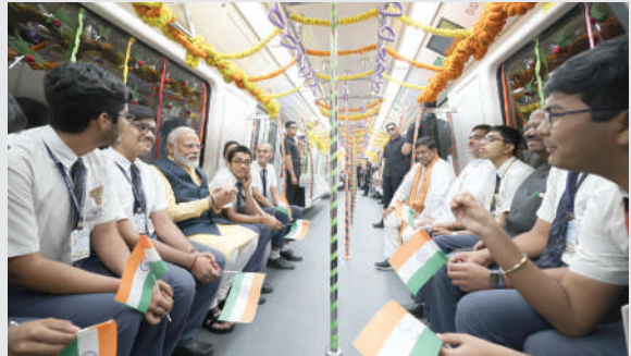
બંગાળના બે સદીઓ જૂના ઐતિહાસિક શહેરો છે અને આ ટનલ હુગલી નદીની નીચેથી આ બંને શહેરોને જોડશે.

૧. (એજન્સી) કોલકાતા, તા.૬ । વડાપ્રધાન મોદીએ આજે કોલકાતામાં ભારતની પ્રથમ અંડરવોટર મેટ્રોનું ઉદ્ઘાટન કર્યું છે. આ અંડરવોટર મેટ્રો રેલ નદી અને હાવડાને કોલકાતા શહેર સાથે જોડશે. આજે દેશને તેની પહેલી અંડરવોટર મેટ્રો મળી ગઈ છે. વડાપ્રધાન નરેન્દ્ર મોદીએ કોલકાતામાં મેટ્રોનું ઉદ્ઘાટન તેમજ અનેક અન્ય પ્રોજેક્ટનું શિલાન્યાસ અને ઉદ્ઘાટન પણ કર્યું હતું. કુલ મળીને વડાપ્રધાન મોદીએ બંગાળને ૧૫૪૦૦ કરોડ રૂપિયાની ભેટ આપી છે. નોંધનીય છે કે કોલકાતાની અંડરવોટર મેટ્રોની ટનલ હુગલી નદીની નીચે બનાવવામાં આવી છે. વડાપ્રધાન મોદીએ અંડરવોટર મેટ્રોનું ઉદ્ઘાટન ઉપરાંત કવિ સુભાષ-હેમંત મુખોપાધ્યાય મેટ્રો સેક્શન અને તરતલા-માજેરહાટ મેટ્રો સેક્શનનું પણ ઉદ્ઘાટન કર્યું છે. મેટ્રો રેલ અનુસાર, આ કોરિડોરની ઓળખ ૧૯૭૧માં શહેરના માસ્ટર પ્લાનમાં કરવામાં આવી હતી. મેટ્રો રેલવેના મુખ્ય જનસંપર્ક અધિકારી કૌશિક મિત્રાએ જણાવ્યું હતું કે હાવડા અને કોલકાતા પશ્ચિમ