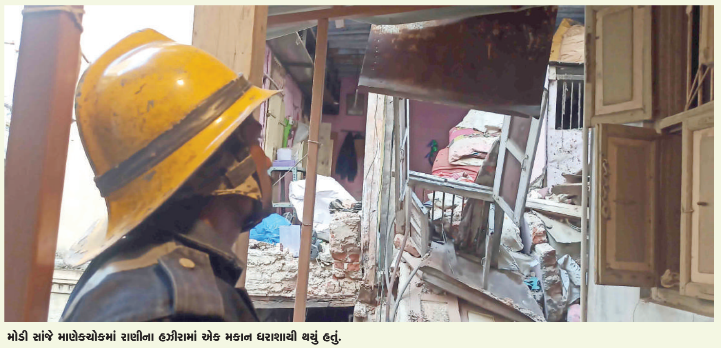
મોડી સાંજે માલેકચોકમાં રાણીના હઝીરામાં એક મકાન ધરાશાયી થયું હતું.