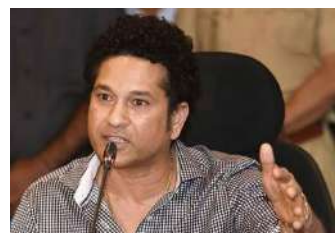
પરંતુ આજના ક્રિકેટરો આમ કરવામાં ખચકાય છે. મારું માનવું છે કે તેનાથી યુવા ખેલાડીઓને ફાયદો થાય છે." સચિન તેંડુલકરે રણજી ટ્રોફીને લઈને પોતાની પોસ્ટમાં લખ્યું, "રણજી ટ્રોફીની સેમિફાઈનલ રસપ્રદ હતી. મુંબઈ શાનદાર બેટિંગની મદદથી ફાઈનલમાં પહોંચ્યું હતું, જ્યારે ક્રિકેટના સેમિફાઈનલ છેલ્લા દિવસ સુધી રમાઈ રહી હતી. મધ્યપ્રદેશને

। (એજન્સી) મુંબઈ, તા.૬ । ભારતીય ટીમના પૂર્વ દિગ્ગજ ખેલાડી અને ક્રિકેટના ભગવાન કહેવાતા સચિન તેંડુલકરે યુવા ખેલાડીઓને ડોમેસ્ટિક ક્રિકેટને પ્રાથમિકતા આપવાની સલાહ આપી છે. સચિને કહ્યું કે, "આ વખતે રણજી ટ્રોફીની સેમિફાઈનલ રસપ્રદ હતી. મુંબઈએ બેટિંગના આધારે ફાઈનલમાં પ્રવેશ કર્યો, જ્યારે વિદર્ભ અને મધ્યપ્રદેશ વચ્ચે નિકટની હરીફાઈ ચાલુ છે." તેણે બીસીસીઆઈની પણ પ્રશંસા કરી જે ડોમેસ્ટિક ક્રિકેટને પ્રોત્સાહન આપી રહી છે. સચિને એ પણ કહ્યું કે, "જ્યારે પણ મને તક મળી ત્યારે હું મુંબઈ માટે રમ્યો હતો,