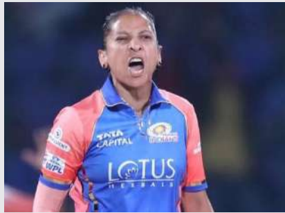
શબનીમ ડબલ્યુપીએલ ૨૦૨૪માં મુંબઈ ઈન્ડિયન્સનો ભાગ છે. ટુર્નામેન્ટની ૧૨મી મેચમાં તેણે મહિલા ક્રિકેટના ઇતિહાસમાં ફાસ્ટેસ્ટ બોલ ફેંક્યો, જેની ઝડપ ૧૩૨.૧

। (એજન્સી) મુંબઈ, તા.૬ । ક્રિકેટના ઇતિહાસમાં ફાસ્ટેસ્ટ બોલ ફેંકવાનો રેકોર્ડ શોએબ અખ્તરના નામે છે, જેણે વર્લ્ડકપ ૨૦૦૩માં ઈંગ્લેન્ડ સામે ૧૬૧.૩ કિમી પ્રતિ કલાકની ઝડપે બોલ ફેંક્યો હતો. પરંતુ હવે મહિલા ક્રિકેટમાં શોએબ અખ્તર જેવો બોલર જોવા મળી રહ્યો છે. હાલમાં ડબલ્યુપીએલ ૨૦૨૪માં ૨મી રહેલી સાઉથ આફ્રિકાની મહિલા ક્રિકેટર શબનીમ ઈસ્માઈલે મહિલા ક્રિકેટના ઇતિહાસમાં ફાસ્ટેસ્ટ બોલ ફેંકવાનો રેકોર્ડ બનાવ્યો છે. શબનીમની આ સિદ્ધિ જોઈને તેને મહિલા ક્રિકેટનો 'શોએબ અખ્તર' કહી શકાય