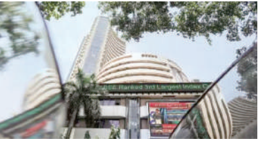
આજે ૨૦ ટકાનો ઘટાડો છે. કંપનીના શેરમાં ઘટાડો આરબીઆઈના એક્શન બાદ આવ્યો છે. મંગળવારે આરબીઆઈએ આઈઆઈએફઆઈના સ્કાન્સની ગોલ્ડ લોન આપવા પર રોક લગાવી દીધી છે. આરબીઆઈએ ગોલ્ડ લોન પોર્ટફોલિયોમાં

૧. (એજન્સી) મુંબઈ, તા.૬ । શેરબજારમાં આજે (૬ માર્ચ ૨૦૨૪) તેજી જોવા મળી છે. નિફ્ટીના ૫૦માંથી ૨૬ શેરોમાં તેજી છે. સેન્સેક્સ ૪૦૮ પોઈન્ટના ઉછળા સાથે ૭૪૦૮૫ના સ્તરે બંધ થયું. ત્યારે નિફ્ટી ૧૧૭ પોઈન્ટની તેજી સાથે ૨૨,૪૭૪ના સ્તરે બંધ થયું. આઈટી અને બેન્કિંગ શેયર્સમાં સૌથી વધુ તેજી છે. નિફ્ટી આઈટીમાં ૦.૮૨%, નિફ્ટી બેંકમાં ૦.૭૯% અને નિફ્ટી એક્સેમસીજમાં ૦.૩૪%ની તેજી જોવા મળી રહી છે. આઈઆઈએફઆઈના સ્કાન્સના શેરમાં