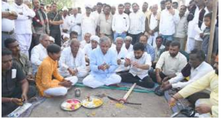
બસે ગામના આગેવાનો અને સરપંચશ્રીઓ અને અગ્રણીઓએ મંત્રીશ્રીનું ઉત્સાહપૂર્વક સ્વાગત કર્યું હતું. કનેસરા ખાતે મંત્રીશ્રીએ ઉદબોધન કરતા જણાવ્યું હતું કે, ગામના આર્થિક વિકાસમાં રસ્તાનું યોગદાન અનેરું હોય છે.

। (માહિતી) રાજકોટ, તા.૬ । રાજ્યના જળસંપત્તિ અને પાણી પુરવઠા મંત્રીશ્રી કુંવરજીભાઈ બાવળીયાએ પાનેલીયા માર્કેટીંગગેશન સ્કીમના રીપેરીંગ કામનો પ્રારંભ કરાવ્યો હતો. પાનેલીયા નાની સિંચાઈ યોજના અંતર્ગત રૂ.૨૯૧ લાખના ખર્ચે માટીપાળાની મરામત, સ્ટોન પિથિંગ, દરવાજાની કામગીરી, ડેમ સેફ્ટી વર્ક કરવામાં આવનાર છે. જેનાથી જળસંચય થતા કોટડા, રૂપાવતી અને કંધેવાળિયા ગામના ખેડૂતોને પાણીનો લાભ મળશે. મંત્રીશ્રીએ જસદણ તાલુકાના કનેસરા ગામે કનેસરા કુંદણી રોડના કામનું ખાતમુહૂર્ત કર્યું હતું.