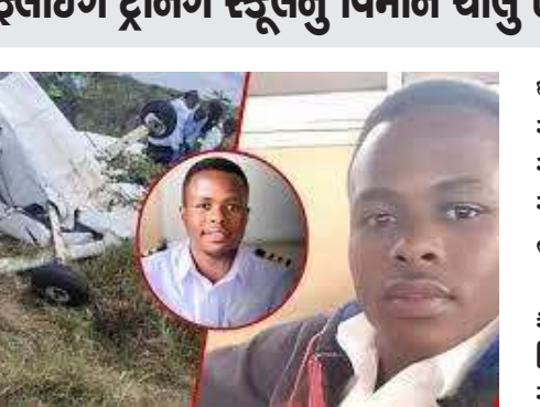
થોડા સમય બાદ જ જોરદાર ધડાકો થયો હતો, પ્લેન કેન્યાના દરિયાકાંઠે ડિયાની તરફ જઈ રહ્યું હતું અને તેમાં ૪૪ લોકો સવાર હતા. જો કે સદનસીબે