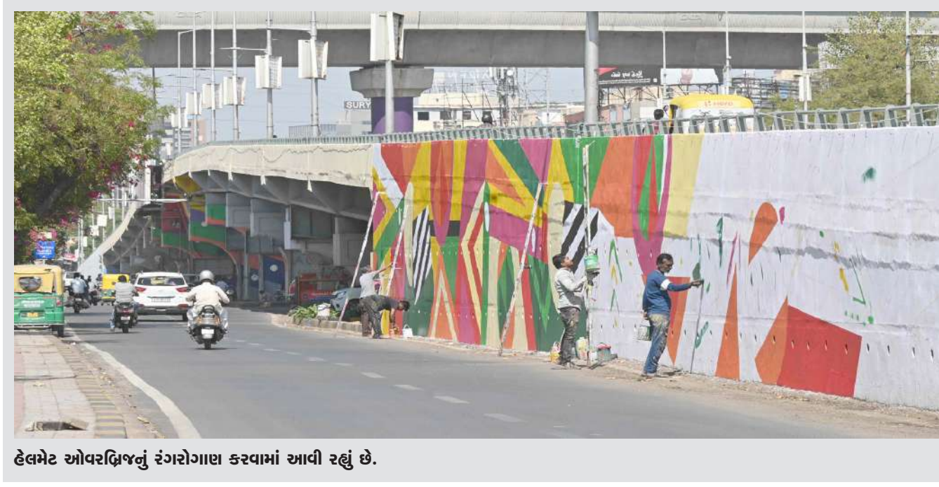
હેલમેટ ઓવરડ્રિજનું રંગરોગાણ કરવામાં આવી રહ્યું છે.