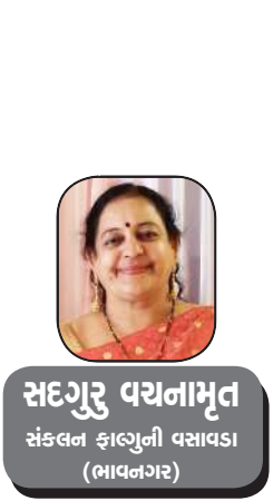
સદગુરુ પચનામૃત સંકલન કાવ્યગુની વસાવડા (ભાવનગર)

સમાજની મોટાભાગની મહિલાઓ આજે ઘણી આગળ નીકળી ગઈ છે, તેની સાથે આવાં વ્યવહારો થતાં નથી, કારણ કે સમાજે ઉદારતાથી ઘણું બધું સ્વીકારી લીધું છે પરંતુ આજે પણ સ્ત્રી કેમ સુરક્ષિત નથી! શું માતા એક જ મહિલા છે?