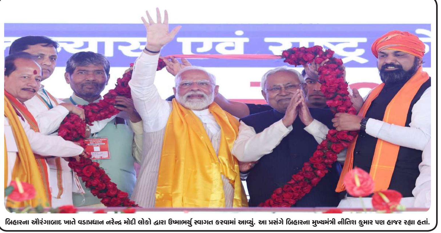
બિહારના ઔરંગાબાદ ખાતે વડાપ્રધાન નરેન્દ્ર મોદી લોકો દ્વારા ઉષ્માભર્યું સ્વાગત કરવામાં આવ્યું. આ પ્રસંગે બિહારના મુખ્યમંત્રી નીતિશ કુમાર પણ હાજર રહ્યા હતાં.

ભાજપના ઉમેદવારોની પ્રથમ યાદીમાં એસસીમાંથી ૨૭, એસટીમાંથી ૧૮ અને ઓબીસીમાંથી ૫૭ ઉમેદવારો છે. જેમાં યુપીમાંથી ૫૧, બંગાળમાંથી ૨૦, એમપીમાંથી ૨૪, ગુજરાતમાંથી ૧૫, રાજસ્થાનમાંથી ૧૫, કેરળમાંથી ૧૨, તેલંગાણામાંથી ૮, આસામમાંથી ૧૧, ઝારખંડમાંથી ૧૧, છત્તીસગઢમાંથી ૧૧ ઉમેદવારોને ટિકિટ મળી છે. દિલ્હીની ૫, જમ્મુ અને કાશ્મીરની ૨, ઉત્તરાખંડની ૩, ગોવાની ૧, ત્રિપુરાની ૧, આંદામાન અને નિકોબારની ૧ અને દમણ દીવની ૧ બેઠક માટે નામોની જાહેરાત કરવામાં આવી છે.