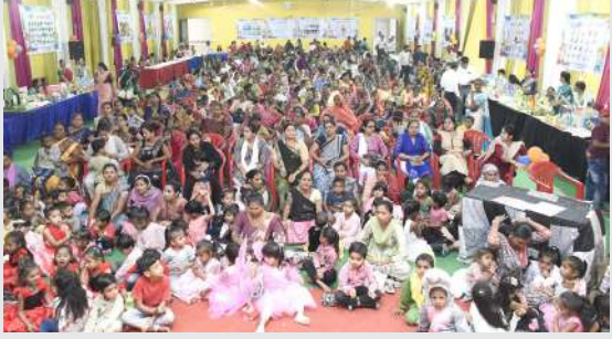
1 (માહિતી) દાહો 1