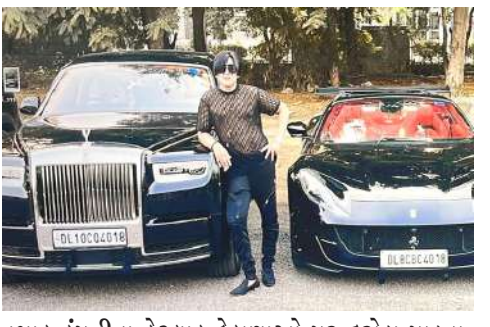
તમાકુ કંપનીના કેટલાક ઠેકાણાઓ પર દરોડા પાડ્યા. કાનપુર સહિત ૫ રાજ્યોમાં ૧૫ થી ૨૦ ટીમો દ્વારા આ કાર્યવાહીને અંજામ અપાયો. નયાગંજ સ્થિત બંસીધર

। (એજન્સી) કાનપુર, તા.૧ । આવકવેરા વિભાગે (આઈટી) ઉત્તરપ્રદેશના કાનપુરની એક તમાકુ કંપનીમાં દરોડા પાડ્યા હતા. સાથે જ દિલ્હી, મુંબઈ, ગુજરાત સહિત ૨૦ ઠેકાણા પર પણ દરોડા પાડ્યા હતા. સૂત્રોના અનુસાર, કંપનીએ પોતાનું ટર્નઓવર ૨૦થી ૨૫ કરોડ બતાવ્યું છે, પરંતુ હકિકતમાં આ ટર્નઓવર લગભગ ૧૦૦-૧૫૦ કરોડ આસપાસ છે. આ દરોડામાં મળેલા સામાનની તસવીરો જોઈને તમે ચોંકી જશો. તમે આ જોઈને એ વિચાર કરશો કે તમાકુ બનાવતી કંપની કેટલું કમાઈ શકે છે અને આટલું બધું કોઈ દરોડામાં કેવી રીતે મળી શકે છે. જોકે, આવકવેરા વિભાગે કાનપુરમાં બંસીધર