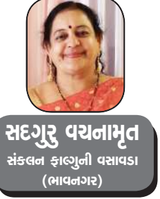
સદગુરુ વચનામૃત સંકલન ફાઉન્ડેશન વસાવડા (ભાવનગર)

રામચરિતમાનસ સકલ લોગ જગભાવની ગંગા છે, એના સાત કાંડ મુજબ એમાથી સાત વસ્તુઓ તારવી લેવામાં આવે, જે મને ગુરૂકૃપાથી સમજાય છે, મેં જાણ્યું છે જે મેં અનુભવ્યું છે, એ સાત વસ્તુને પકડીને જીવન ધન્ય બનાવી શકાય.