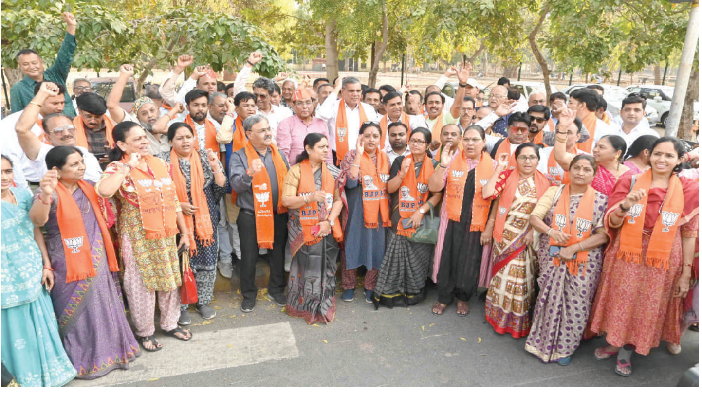
લાલ દરવાજા સરદાર બાગ પાસે બંગાળના મુખ્યમંત્રી મમતા બેનર્જીની પાર્ટી વૃણમૂલ કોંગ્રેસના નેતા શાહજહાં શેખના વિરોધમાં દેખાવો કરવામાં આવ્યા હતા.

ગાંધીનગર, તા. ૧ | આગામી એપ્રિલ માસમાં ગૌણસેવા વર્ગ ૩ ની ૫૫૫૪ જગ્યાઓ માટે ૧૯ દિવસ પરીક્ષાનું આયોજન કરવામાં આવ્યું છે. ૧ લી એપ્રિલથી ૮મી મે સુધી પ્રિલીમીનરી પરીક્ષા નું કરાયું આયોજન કરવામાં આવ્યું છે. આવતીકાલે વેબસાઈટ પર પરીક્ષાની તારીખ સહિતની વિગતો જાહેર કરવામાં આવશે. રાજ્યમાંથી કુલ ૫ લાખ ૧૭ હજાર ઉમેદવારોએ અરજી કરી છે.