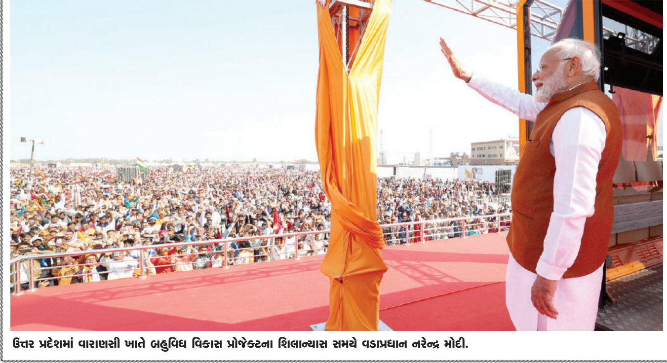
ઉત્તર પ્રદેશમાં વારાણસી ખાતે બહુવિધ વિકાસ પ્રોજેક્ટના શિલાન્યાસ સમયે વડાપ્રધાન નરેન્દ્ર મોદી.

અફુલના માતા-પિતાએ કહ્યું કે અમે અનુભવ કરી શકીએ છીએ કે અમારા બાળક તે સમયે ઠંડીના કારણે કેવી રીતે ઠડ્યો હશે ૧૮ વર્ષીય ભારતીય-અમેરિકી વિદ્યાર્થી અફુલ ધવનનું કથિત રીતે ઘણા કલાક સુધી લાપતા રહ્યા બાદ મોત થઈ ગયું હતું. અફુલની મોતની આ ઘટના જાન્યુઆરીમાં થઈ હતી. ઈલિનોઈસમાં શેમ્પેઈન કાઉન્ટી કોરોનરના કાર્યાલયે મામલે પર આ અહવાલિયે કહ્યું કે ભારતીય-અમેરિકી વિદ્યાર્થીનું મૃત્યુ દાઝરના નશામાં થવા અને વધુ સમય સુધી જરૂરિયાતથી વધુ ઠંડી તાપમાનમાં રહ્યા બાદથી થઈ. બેકે, ઈલિનોઈસ અને મધ્યપશ્ચિમના મોટાભાગના ભાગમાં જાન્યુઆરીમાં ભીષણ ઠંડી હોય છે. ઠંડા પવનના કારણે ત્યાંનું તાપમાન -૨૦થી -૩૦ ડિગ્રી રહે છે. પાર્ટીમાં એન્ટ્રી ન મળ્યા બાદ અફુલ બહાર ઊભો રહ્યો. જેના કારણે તેનું હાઈપોથર્મિયાથી મોત થઈ ગયું. શરૂઆતી તપાસમાં પોલીસને શંકા લાગી હતી પરંતુ પછી આ મામલે પોલીસ ટ્રેક એન્ગલથી તપાસ કરી રહી હતી. હવે સ્પષ્ટ થઈ ગયું કે અફુલનું મોત હાઈપોથર્મિયાથી થયું છે. અફુલના માતા-પિતા ઈશ અને દિતુ ધવને યુનિવર્સિટી પોલીસ વિરુદ્ધ બેટરકારીનો મામલો નોંધાવ્યો છે. તેમનું કહેવું છે કે અફુલને યોગ્ય સમયે શોધવા નીકળી જતા તો કદાચ તે બચી જાત. પોલીસે આ મામલે બેટરકારી દાખવી. અફુલનો મૃતદેહ લાપ તા થવાની જાણકારી આપવાના ૧૦ કલાક બાદ મળ્યો.