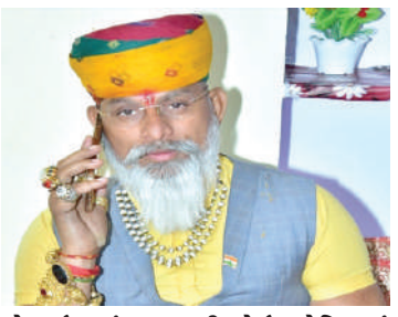
મોબાઇલ નંબર પરથી કોઈ ઓફિસમાં કોલ કરીને પાંચમી જાન્યુઆરી સુધીમાં જાનથી મારી નાખવાની ધમકી આપી હતી. કરણી સેનાની વિહ્વલવાજા હરિદેશન પાસે આવેલી ઓફિસના નંબર પર સતત ધમકી મળી હતી. જે અંગે નરોડા પોલીસ મથકે તેમણે ફરિયાદ નોંધાવતા પોલીસે તપાસ શરૂ કરી છે.

1 (એજન્સી) અમદાવાદ, તા.૨૩ | ક્ષત્રિય કરણી સેનાના રાષ્ટ્રીય અધ્યક્ષ રાજ શેખાવતને અજાણ્યા શખ્સોએ જાનથી મારી નાખવાની ધમકી આપવાની ફરિયાદ નરોડા પોલીસ મથકે નોંધવામાં આવી છે. જેમાં તેમને આગામી પાંચમી જાન્યુઆરી સુધીમાં જાનથી મારી નાખવાનો કોલ અજાણ્યા લોકોએ કર્યો હતો. આ અંગે નરોડા પોલીસે તપાસ શરૂ કરી છે. મળતી માહિતી અનુસાર કુખ્યાત ગેંગસ્ટર લોરેન્સ બિશ્નોઈના સાગરિતો દ્વારા ધમકી આપવામાં આવી છે તેવી ફરીયાદ દાખલ કરવામાં આવી છે. રાષ્ટ્રીય કરણી સેનાના સંસ્થાપક અને રાષ્ટ્રીય અધ્યક્ષ રાજ શેખાવતને ગત ૧૮મી જાન્યુઆરીના રોજ કોઈ અજાણ્યા