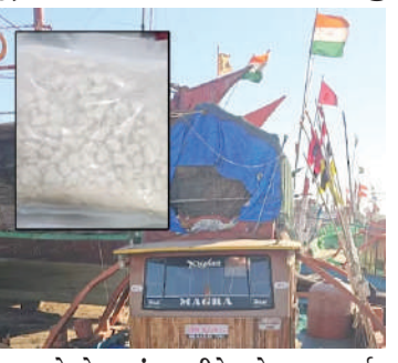
દ્વારા ઓપરેશન સંયુક્ત રીતે અને સફળતાપૂર્વક પાર પાડવામાં આવ્યું છે. નવ આરોપીઓની ધરપકડ કરીને આગળની કાર્યવાહી હાથ ધરવામાં આવી. જો કે, હાલ આટલી માત્રામાં ડ્રગ્સ પકડતાં એફએસએલ, ગીર સોમનાથ એસઓજીઅને એલસીબીસહિત તપાસ શરૂ કરવામાં આવી છે.

1 (એજન્સી) વેરાવળ, તા.૨૩ | ગીર સામનાથના વેરાવળ બંદર પરથી એક શંકાસ્પદ બોટમાંથી પોલીસે અંદાજીત ૩૫૦ કુરોડની કિંમતનો ૫૦ કિલો હેરોઈનનો જથ્થો જપ્ત કરી લીધો હતો. સાથે ત્રણ મુખ્ય આરોપીઓ સહિત નવ આરોપીઓની ધરપકડ કરવામાં આવી છે. મોડી રાત્રે ખાતમીને આધારે પોલીસે શંકાસ્પદ ફિશિંગ બોટને જપ્ત કરી પાડીને નશીલો જથ્થો કબજે કર્યો હતો. મળતી માહિતી અનુસાર, ગુજરાત પોલીસ દ્વારા વેરાવળ બંદરના નલિયા ગોળી કાંઠે દરોડા પાડવામાં આવતા એક ફિશિંગ બોટમાંથી રૂપિયા ૩૫૦ કુરોડના ૫૦ કિલોના સિલબંધ હેરોઈનનો જથ્થો મળી આવ્યો હતો. એસઓજીઅને એનડીપીએસની ટીમ