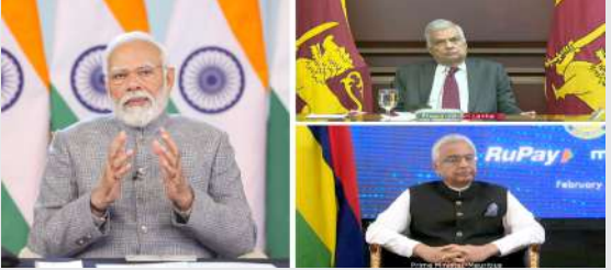
૧ નવી દિલ્હી

પ્રધાનમંત્રી શ્રી નરેન્દ્ર મોદીએ આજે શ્રીલંકાના રાષ્ટ્રપતિ શ્રી રાનિલ વિક્રમસિંહે અને મોરેશિયસના પ્રધાનમંત્રી શ્રી પ્રવિન્દ જગન્નાથ સાથે સંયુક્તપણે શ્રીલંકા અને મોરેશિયસમાં યુનિફાઇડ પેમેન્ટ ઈન્ટરફેસ (યુપીઆઈ) સેવાઓનું શુભારંભ કરાવ્યો હતો તથા વીડિયો કોન્ફરન્સિંગ મારફતે મોરેશિયસમાં રુપે કાર્ડ સેવાઓનો પણ શુભારંભ કરાવ્યો હતો. મોરેશિયસના પ્રધાનમંત્રી શ્રી પ્રવિન્દ જગન્નાથે માહિતી આપી હતી કે, કો-બ્રાન્ડેડ રુપે કાર્ડને મોરેશિયસમાં ડોમેસ્ટિક કાર્ડ તરીકે નિયુક્ત કરવામાં આવશે. પ્રધાનમંત્રીએ કહ્યું હતું કે, આજની શરૂઆતથી બંને દેશોનાં નાગરિકોને ઘણી સુવિધા મળશે. શ્રીલંકાનાં રાષ્ટ્રપતિ શ્રી રાનિલ વિક્રમસિંહેએ પ્રધાનમંત્રીને અયોધ્યા ધામમાં શ્રી રામ મંદિરનાં અભિષેક માટે અભિનંદન પાઠવ્યાં હતાં. તેમણે સદીઓ જૂના આર્થિક સંબંધો પર પણ ભાર મૂક્યો હતો. રાષ્ટ્રપતિએ બંને દેશો વચ્ચેના સંબંધોને ગાઢ બનાવવા અને કનેક્ટિવિટીની ગતિ જાળવવાની આશા વ્યક્ત કરી હતી. આ પ્રસંગે સંબોધન કરતાં પ્રધાનમંત્રીએ જણાવ્યું હતું કે, અત્યારે ભારત, શ્રીલંકા અને મોરેશિયસ એમ ત્રણ મિત્ર દેશો માટે વિશેષ દિવસ છે, જ્યારે તેમનાં ઐતિહાસિક જોડાણો આધુનિક ડિજિટલ જોડાણનું સ્વરૂપ ધારણ કરે છે. તેમણે કહ્યું કે તે લોકોના વિકાસ પ્રત્યે સરકારની પ્રતિબદ્ધતાનો પુરાવો છે. પ્રધાનમંત્રીએ ભારપૂર્વક જણાવ્યું હતું કે, ફિનટેક કનેક્ટિવિટી સરહદ પારના વ્યવહારો અને જોડાણોને વધારે મજબૂત કરશે. પ્રધાનમંત્રીએ ભારપૂર્વક જણાવ્યું હતું કે, “ભારતનું યુપીઆઈ અથવા યુનાઈટેડ પેમેન્ટ્સ ઈન્ટરફેસ આજે નવી ભૂમિકામાં છે - ભારત સાથે ભાગીદારોને જોડવા.”