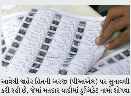
આવેલી જાહેર હિતની અરજી (પીઆએલ) પર સુનાવણી કરી રહી છે, જેમાં મતદાર યાદીમાં ડુપ્લિકેટ નામો શોધવા

! (એજન્સી) નવી દિલ્હી, તા.૬ | લોકસભા ચૂંટણી પહેલા ભારતીય ચૂંટણી પંચે મતદાર યાદીમાંથી ૧.૬૬ કરોડથી વધુ નામો કાઢીને સુધારેલી યાદીમાં ૨.૬૮ કરોડથી વધુ મતદારોને જાડવામાં આવ્યા છે. મતદારોની સંખ્યા વધીને ૯૭ કરોડ થઈ ગઈ છે. આસામ, મધ્યપ્રદેશ, છત્તીસગઢ, રાજસ્થાન, મિઝોરમ અને તેલંગાણાની મતદાર યાદીમાં સુધારો કરવામાં આવ્યો નથી. આ આંકડાઓ ચૂંટણી પંચ દ્વારા ૨ ફેબ્રુઆરીએ સુપ્રીમ કોર્ટમાં એક એફિડેવિટ દ્વારા શેર કરવામાં આવ્યા હતા, જે સેવ ધ કોન્સ્ટિટ્યુશન ટ્રસ્ટ દ્વારા દાખલ કરવામાં