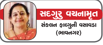
સદગુરુ વર્યાનામૃત સંકલન ફાલ્ગુની વસાવડા (ભાવનગર)

મિત્રો વસંત આવતા લગ્નની મોસમ હવે પૂરબહારમાં ખીલશે, અને કંઈક યુવક યુવતીઓ સમપદીના સાત વચને દામ્પત્ય ભણી પગ માંડશે. બાહ્ય રૂપની બોલબાલા વાળા આ સમયમાં દરેક સંબંધ આજકાલ કાચના વાસણ જેવા થઈ ગયા છે, અને એને હેન્ડલ વિષ્ય કેર જેમ જતન કરવું પડે છે! જરાક ઊંચીનચી થાય એટલે ડિવોર્સની ધમકી! પરંતુ આવાં સમયમાં પણ કોઈ હોય છે જેને મન સંબંધના પાયામાં સચ્ચાઈની ખેવના હોય છે. આજે સવિનય સોસાયટીના નાનકડા એવા એક ઘરમાં દોડાદોડી ચાલી રહી હતી, અને બધા ઘરને વ્યવસ્થિત કરતાં હતાં, જેથી કરીને આવનારના મનમાં ખરાબી ઉભેરણ ઊભી થાય નહીં. શેટી પર નવો રેશમી ઓછાડ પાથરવામાં આવ્યો હતો, ટિપો પર પણ ભરેલો રૂમાલ પાથર્યો, અને રસોડામાં નવીન વ્યંજન બન્યા હતાં, મુખવાસની પેટી પણ તૈયાર થઈ ગઈ. રૂમની અંદર અગરબત્તી પ્રગટાવીને વાતાવરણને ખુશનુમા કરવાની કોશિશ થઈ રહી હતી, તેમજ એક ખૂણમાં તાજા ફૂલો વાળો ગુલદરનો પણ રાખવામાં આવ્યો હતો, અને બારણે શુકનવંતુ આસોપાલવનું તોરણ બંધાયું હતું, કે આ વખતે જો બધું પાર પડી જાય તો સારું!! દાદી એ તો સવાસો રૂપિયાના પ્રસાદની માનતા પણ માની હતી, અને મમ્મી પપ્પાએ પણ ભગવાન આગળ દીવો કરીને પ્રાર્થના કરી હતી. સૌ કોઈના મનમાં એક જ આશા હતી કે આ વખતે દીકરીનું બધું ગોઠવાઈ જાય. વાત જાણે એમ હતી કે આ ઘરની એક માત્ર એવી લાડકી દીકરી એટલે કે ખેવનાને જોવા આવવાના હતા. ખેવના એક ઉર્મિથી ભરેલી અને લગ્નની ઉંમરે પહોંચેલી ખૂબ જ સુંદર કહી શકાય એવી અપ્સરા જેવી યુવતી હતી, પરંતુ તકલીફ ત્યાં હતી કે તેને પીઠ પર એક સફેદ ડાઘ હતો, અને આશ્ચર્યની વાત તો એ હતી, કે એ ડાઘ મામૂલી ડાઘ હતો. કોઈ બીમારીનો નહોતો. નાનપણમાં કોઈ કારણસર ફટાકડથી એ ડાઘ પડ્યો હતો, અને યોગ્ય ટીટમેન્ટ મળે તો કદાચ સારું પણ થઈ જાય, પણ દાદીના પાડતાં હતાં કે