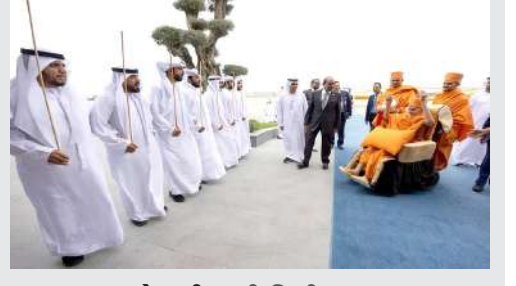
1 (એજન્સી) નવી દિલ્હી, તા.૬ |

તેની ઊંચાઈ ૧૦૮ ફૂટ છે, જેમાં ૪૦ હજાર ક્યુબિક મીટર માર્બલ અને ૧૮૦ હજાર ઘન મીટર સેન્ડસ્ટોનનો સમાવેશ થાય છે